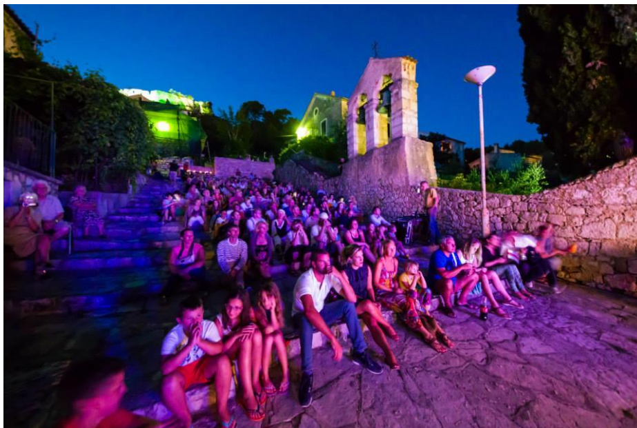
Slika 14. jazz koncert na škalinama