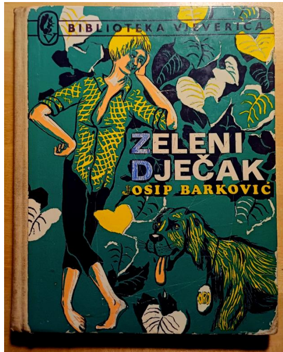
Slika 2. Zeleni dječak Josipa Barkovića – zadnji naslov tiskan u Biblioteci Vjeverica 1974