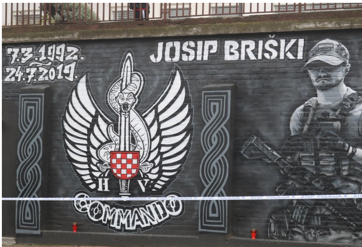
Slikovni prilog 12. Mural kao tehnologija pamćenja suvremenih bitaka HV-a. Fotografija je nastala u Koloni sjećanja 2020.