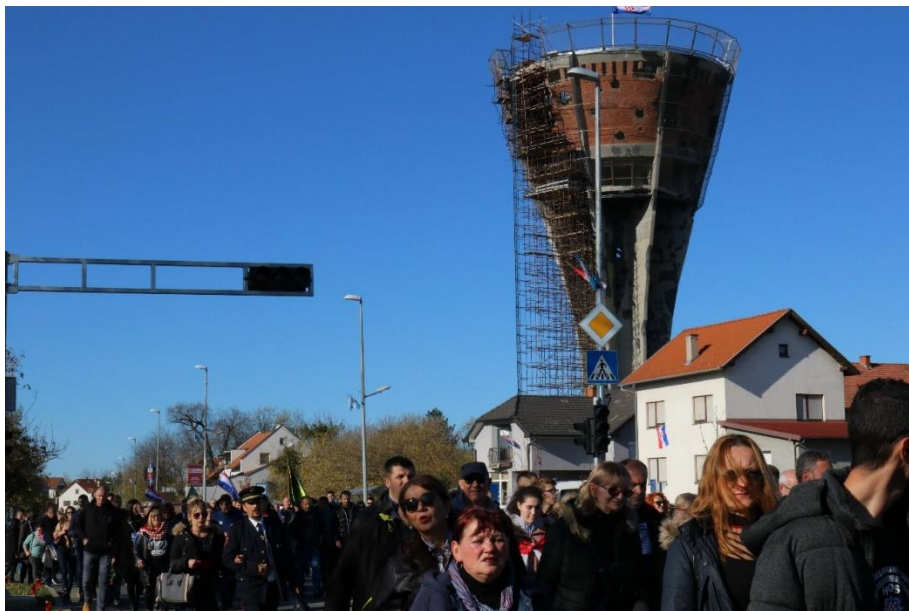
Slikovni prilog 13. Fotografija Kolone sjećanja s Vukovarskim tornjem u pozadini. Fotografija je nastala u Koloni sjećanja 2019.