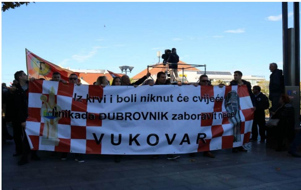
Slikovni prilog 10. Transparent kao poveznica maritrija dva grada pod opsadom. Fotografija je nastala u Koloni sjećanja 2019. Autor fotografije je Božidar Popović.

Fotografija je nastala u Koloni sjećanja 2020. Autor fotografije je Božidar Popović.