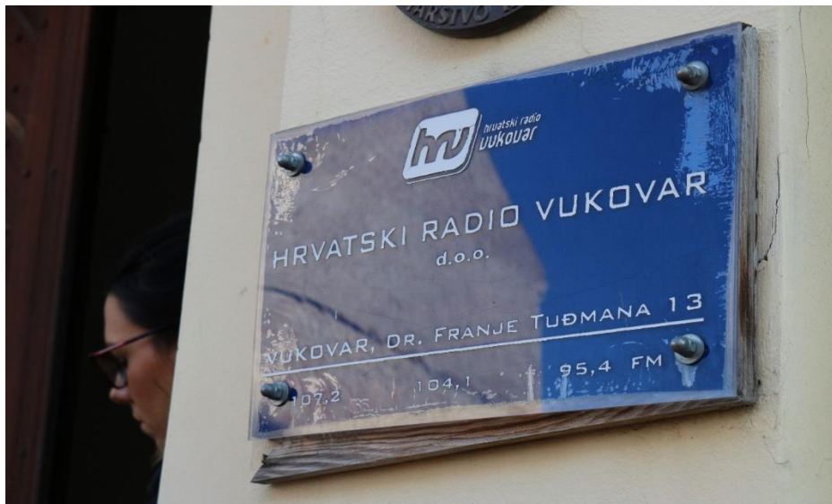
Slikovni prilog 11. Zvučna kulisa glasa Siniše Glavaševića evocira ambijentalnost Vukovarske bitke. Fotografija je nastala u Koloni sjećanja 2019.