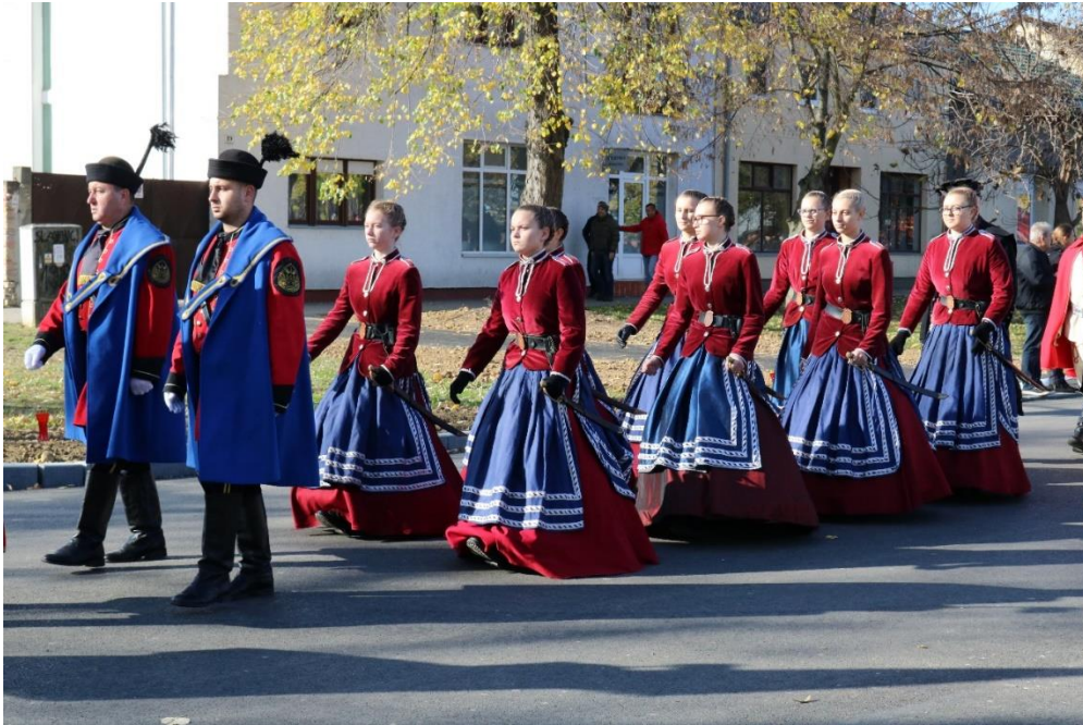
Slikovni prilog 3. Vizualna šarolikost odora oživljava povijesnu ambijentalnost.

Fotografija je nastala u Koloni sjećanja 2019.