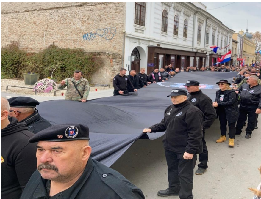
Slikovni prilog 5. Orkestrirana izvedba mimohoda zastava HOS-a kao ikonografija pamćenja. Fotografija je nastala u Koloni sjećanja 2019. Autor fotografije je Božidar Popović.