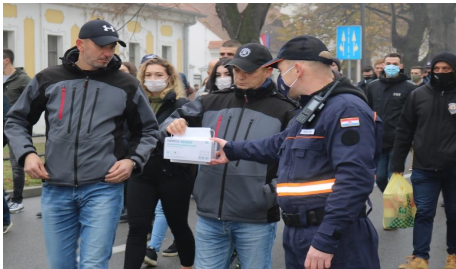
Slikovni prilog 7. Kolona sjećanja pod utjecajem epidemiološkog mjera uslijed pandemije COVID-19. Fotografija je nastala u Koloni sjećanja 2020.