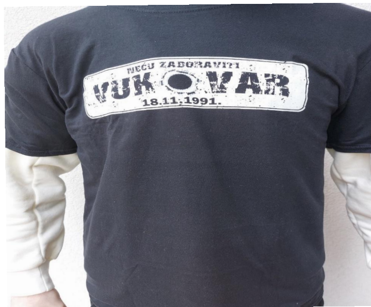
Slikovni prilog 6. Vizualna mnemonika datuma i mjesta vukovarske tragedije. Fotografija je nastala u Koloni sjećanja 2020.