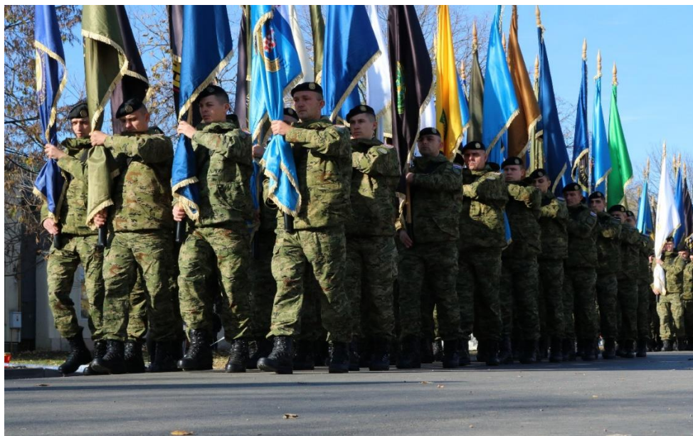
Slikovni prilog 4. Mimohod zastava povijesnih vojnih postrojbi evocira prošlost u sadašnjosti. Fotografija je nastala u Koloni sjećanja 2019. Autor fotografije je Božidar Popović

Fotografija je nastala u Koloni sjećanja 2019. Autor fotografije je Božidar Popović