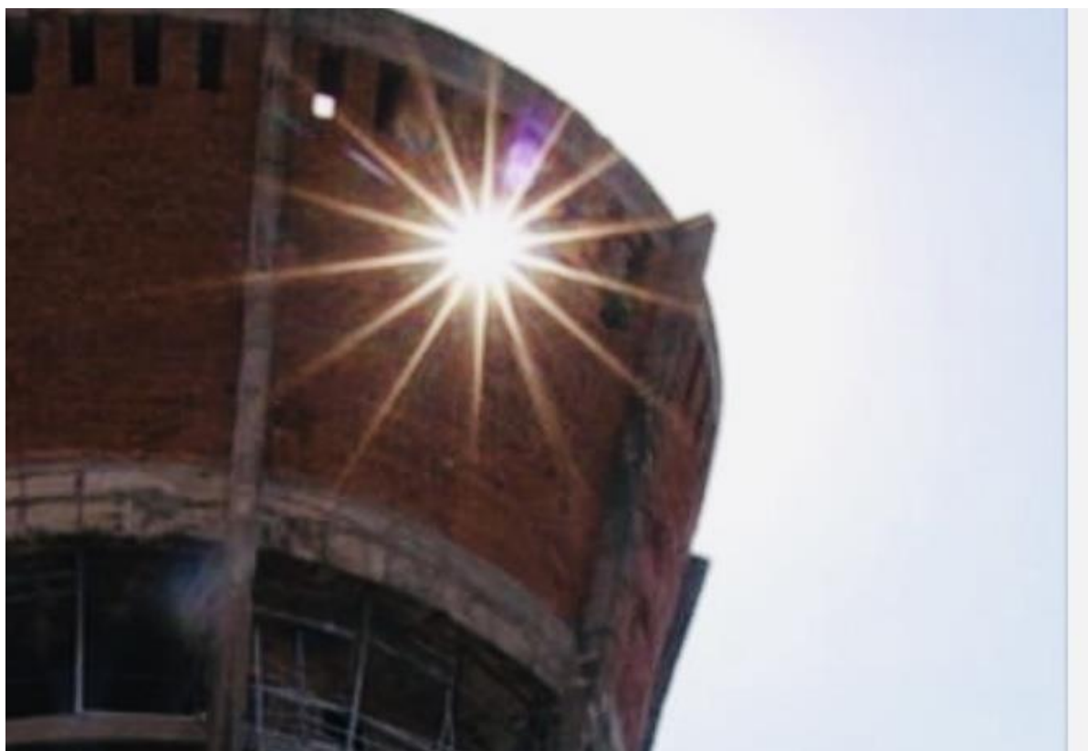
Slikovni prilog 14. Umjetnička fotografija. Takav izranjavani vodotoranj isijava svjetlost. Fotografija je nastala 2016.