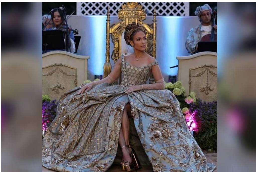
Slika 7. Jennifer Lopez u haljni M. Malhtre