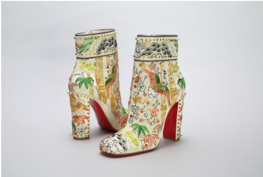
Slika 5. Louboutin čizme iz kolekcije jesen/zima 2017.

Izvor: Fukai, A. (2019.) How the Kimono has Influenced the World of Fashion, nippon.com, https://www.nippon.com/en/japan-topics/g00646/how-the-kimono-has-influenced-the-world-of-fashion.html (preuzeto: 18. listopada 2024.)