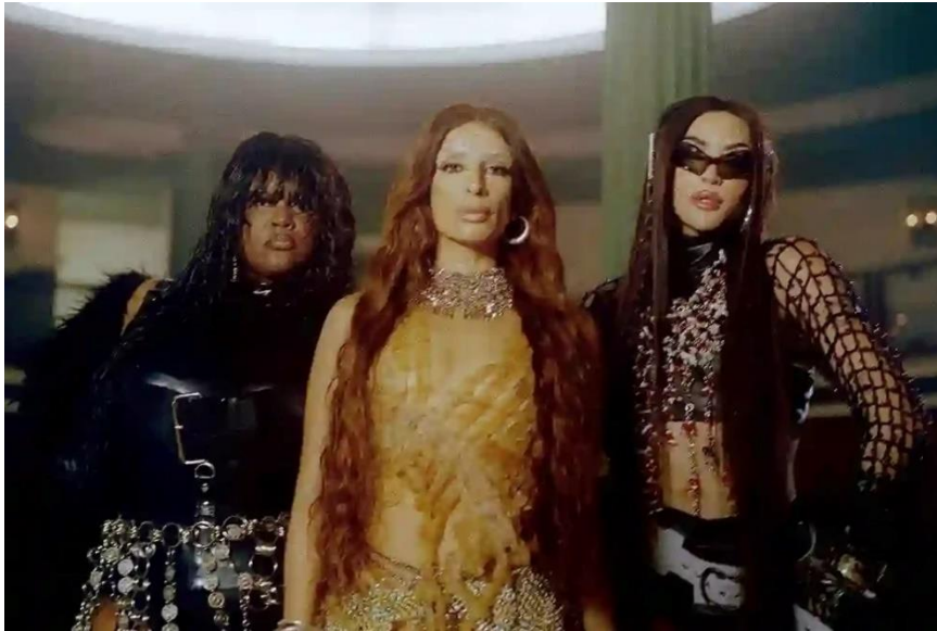
Slika 9. Sevdaliza, Pablo Vittar & Yseult