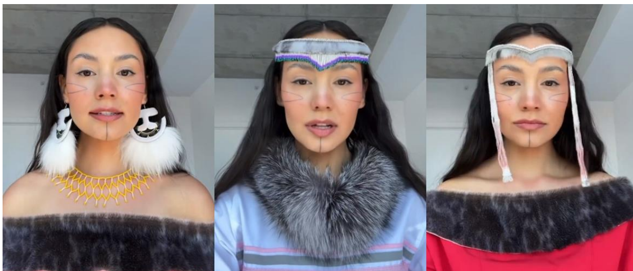
Slika 12. Shina Novalinga

Jedan od takvih kreatora je Shina Novalinga koja ponosno koristi društvene mreže TikTok s 4 milijuna i Instagram s 2 milijuna pratitelja za predstavljanje svoje kulturne baštine. Tradicionalna odjeća, grleno pjevanje, hrana, legende i običaji inuitske kulture samo su neki od sadržaja njezinih platformi. No, Shina ne nastoji predstavljati samo ono lijepo već i ono što je problematično i što se možda želi spremiti pod tepih. Svoje platforme Shina tako koristi i za razbijanje klišeja koje šira javnost ima o inuitskoj kulturi (npr. eskimski poljubac) kao i za skretanje pažnje na nasilje i zlostavljanje koje su pretrpjeli pripadnici njezinog naroda. Otvoreno govori o pretrpljenoj diskriminaciji od dolaska doseljenika, akulturaciji, otuđivanju djece od roditelja i obitelji, marginalizacije njihovih tradicionalnih tetovaža... (Poutrel, 2024).