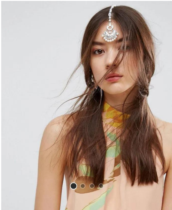
Slika 8. ASOS-ova Chandelier Hair Clip