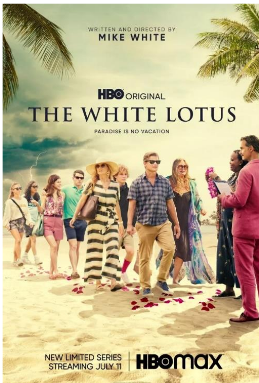
Slika 4. Serija Bijeli lotus