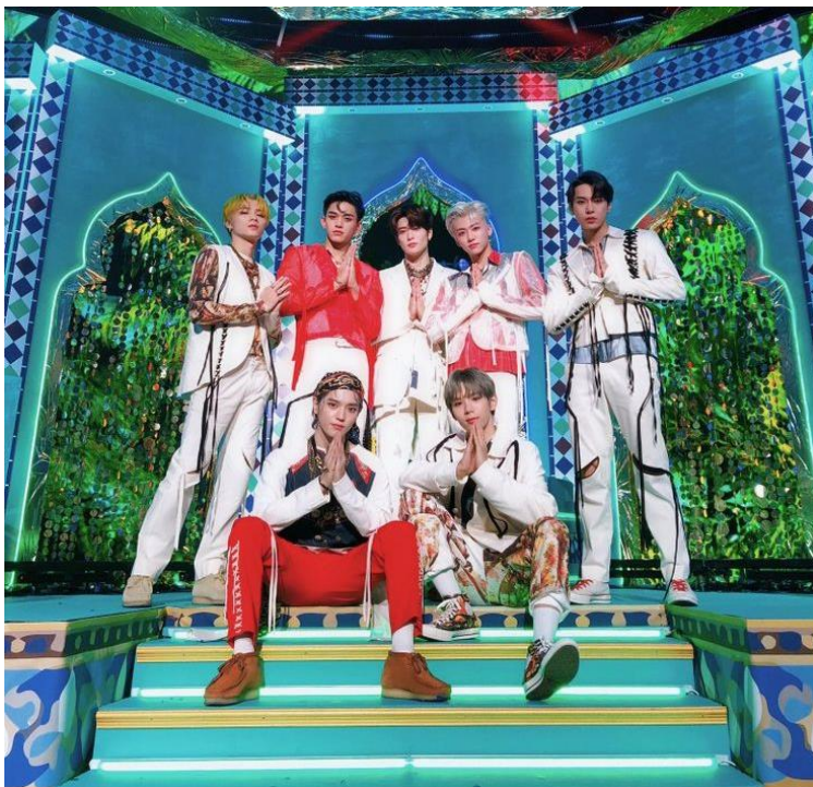
Slika 10. Grupa NCT U