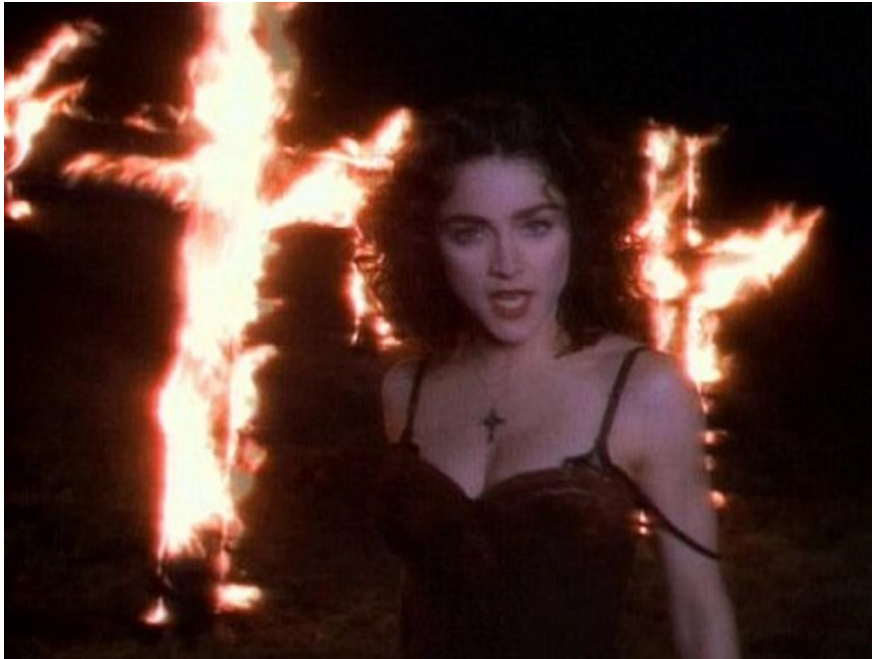
Slika 11. Madonna u spotu Like a Prayer