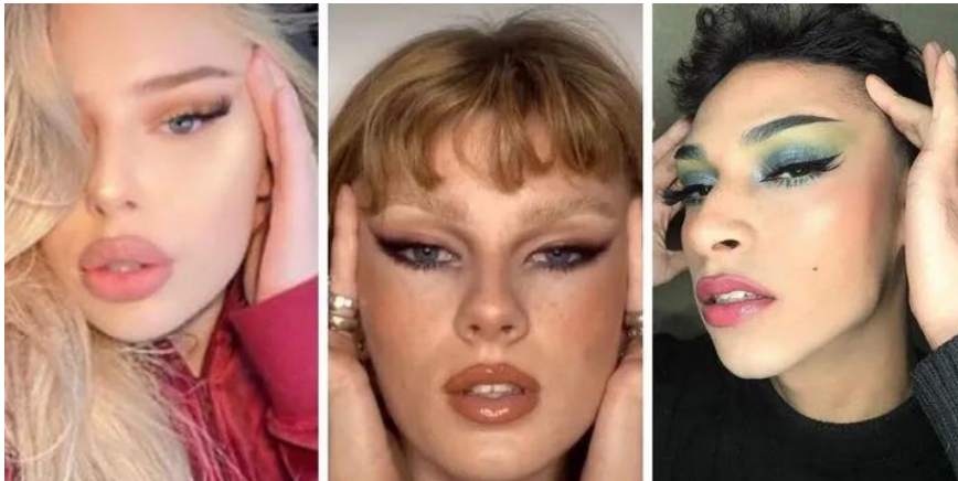
Slika 14. Beauty trend “fox eye”

Ivor: Glavski, S. (2020.) Fox Eyes and Why Cultural Appropriation Should Be Celebrated , Strong Opinion, Weekly Held, https://strongopinionsweaklyheld.substack.com/p/fox-eyes-and-why-cultural-appropriation (preuzeto: 20. rujna 2024.)