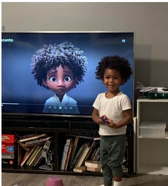
Slika 2. Film Encanto i raznovrsnost likova