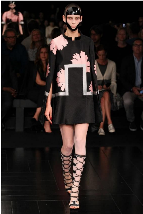
Slika 6. McQueenova inspiracija Japanom

Izvor: Alexander McQueen (2024.) https://www.vogue.com/fashion-shows/spring-2015-ready-to-wear/alexander-mcqueen/slideshow/collection#1 (preuzeto: 18. listopada 2024.)