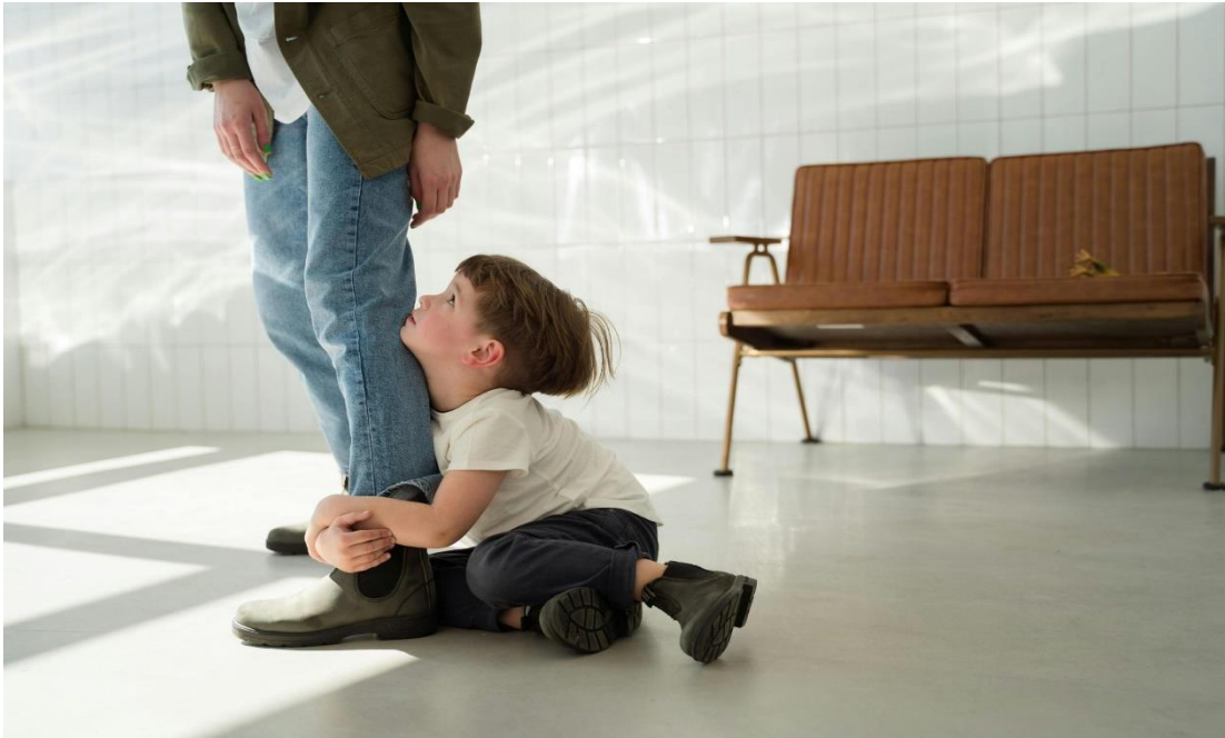
Slika 2. Razmaženo dijete