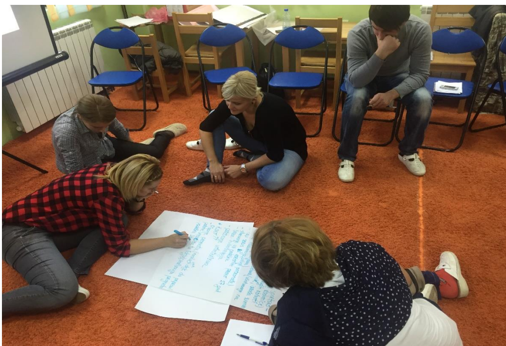
Slika 4. Suradnja odgojitelja i stručnih suradnika dječjeg vrtića