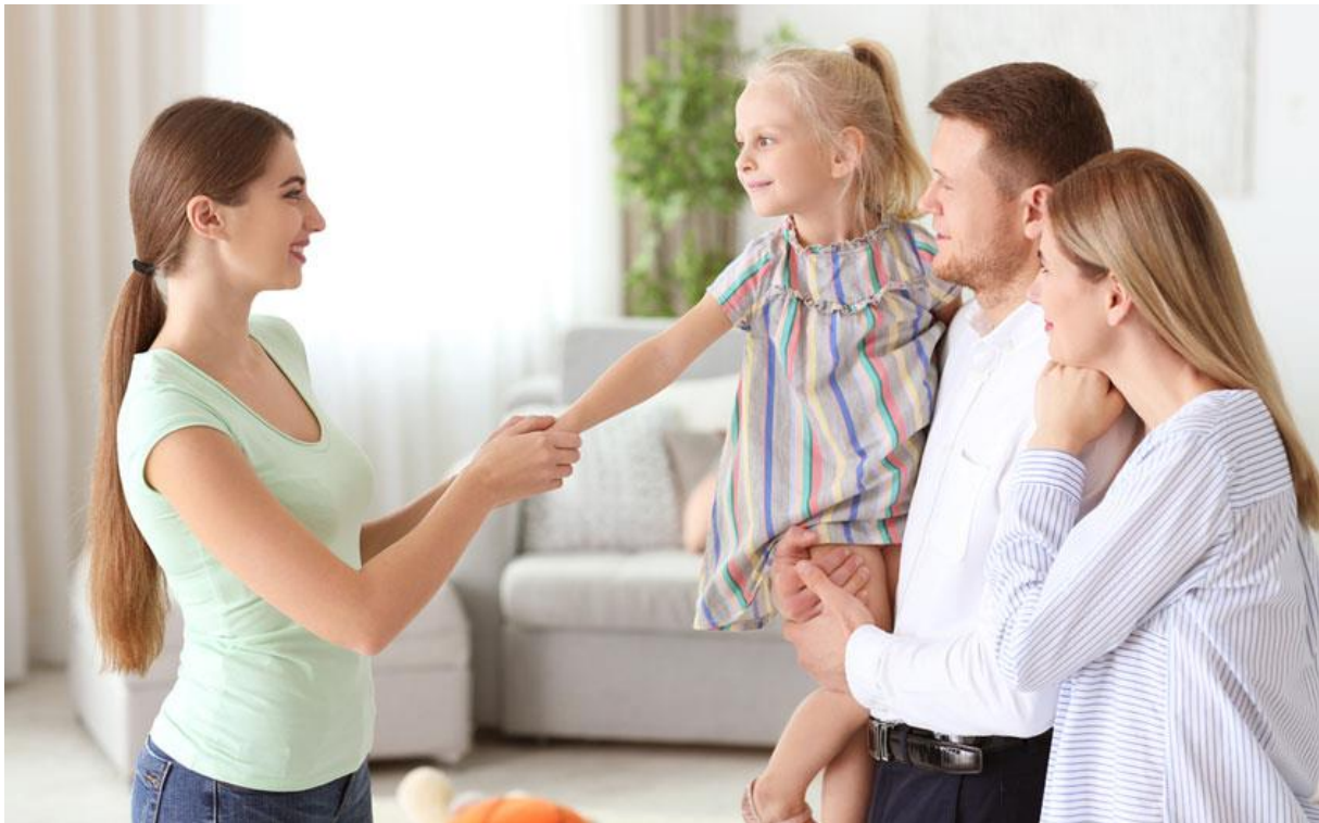
Slika 5. Suradnja roditelja i odgojitelja