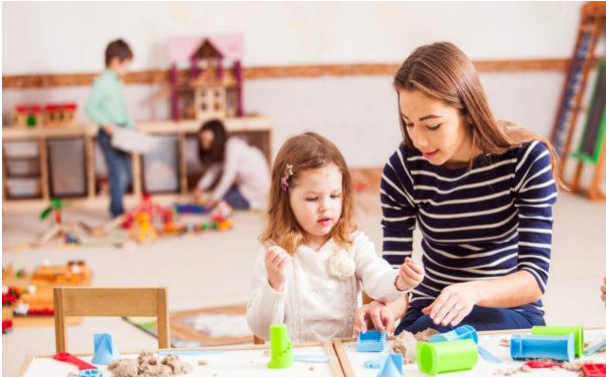
Slika 3. Rad odgojitelja s djetetom