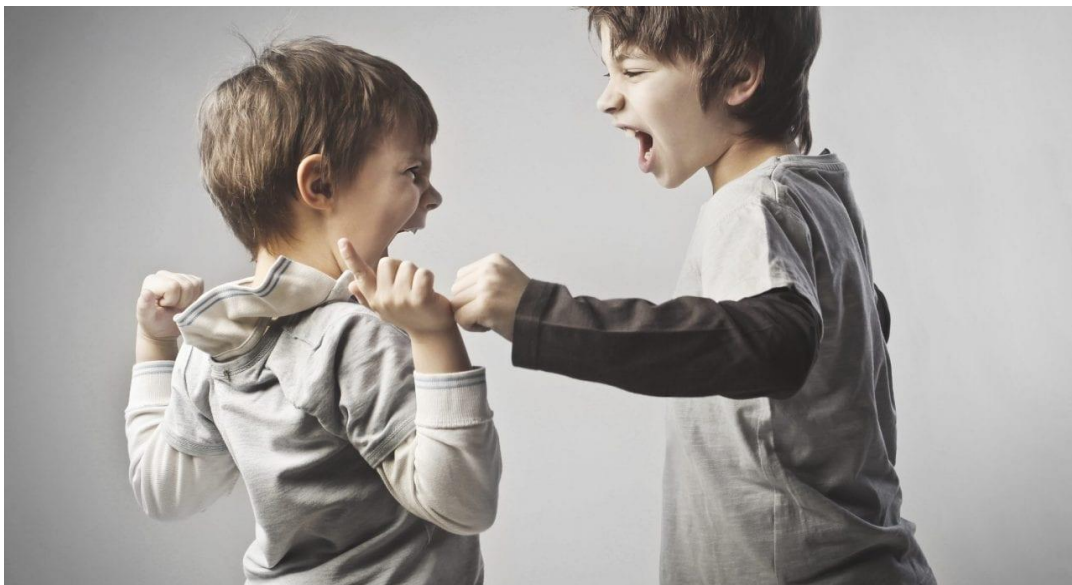
Slika 1. Fizička agresivnost kod djece