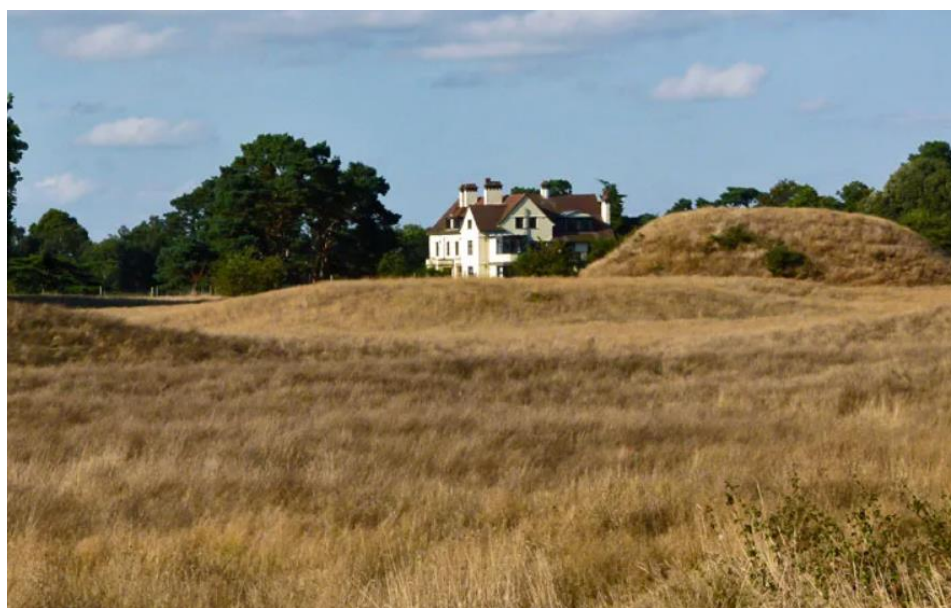
Sl. 2. Kuća na posjedu Edith May Pretty