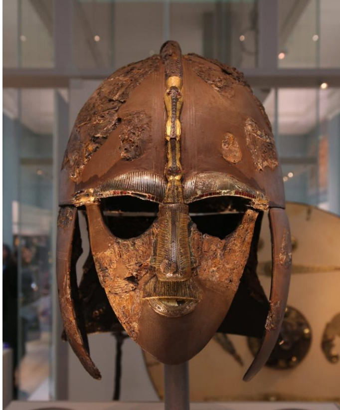
Sl. 7. Kaciga iz Sutton Hooa