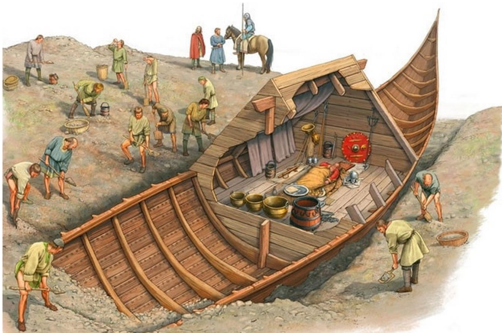
Sl. 6. Idejna rekonstrukcija broda iz Sutton Hooa