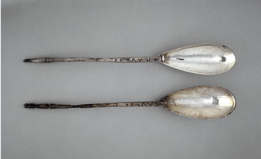
Sl. 11. Srebrne žličice s gravurama “Saulos” i “Paulos” (izvor: https://www.britishmuseum.org/collection/object/H_1939-1010-89 )