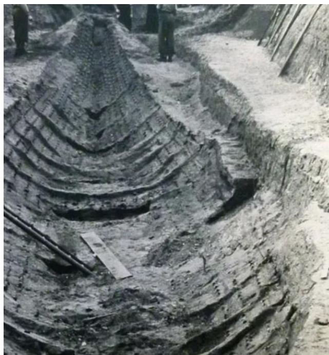
Sl. 4. Otisak broda iz zemljanog humka broj 1