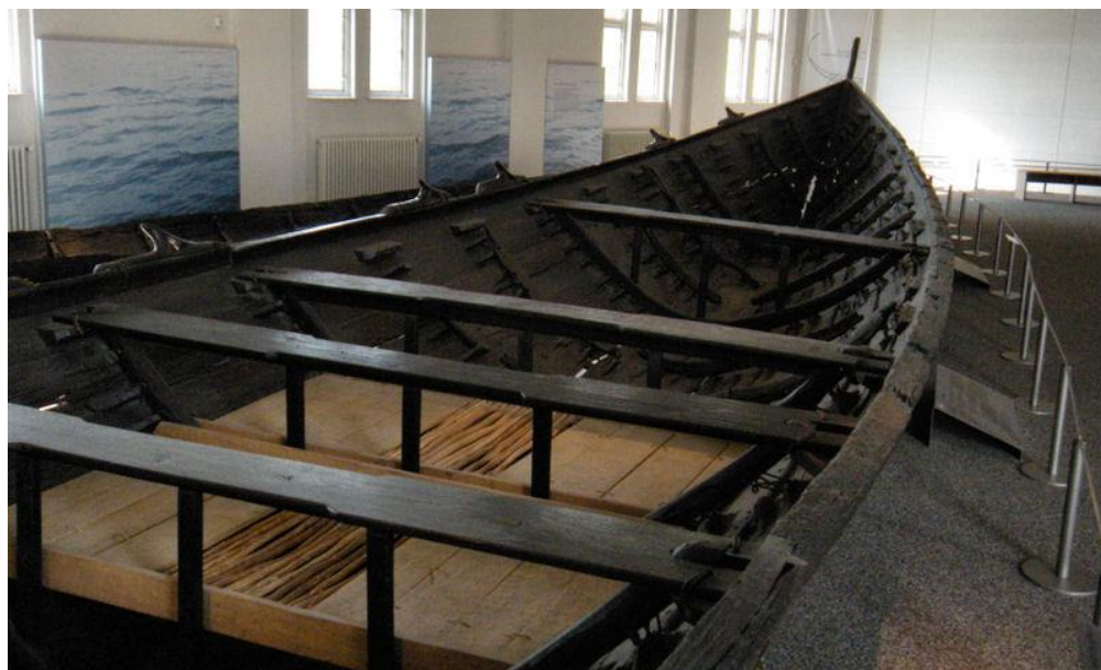
Sl. 5. Brod iz Nydama