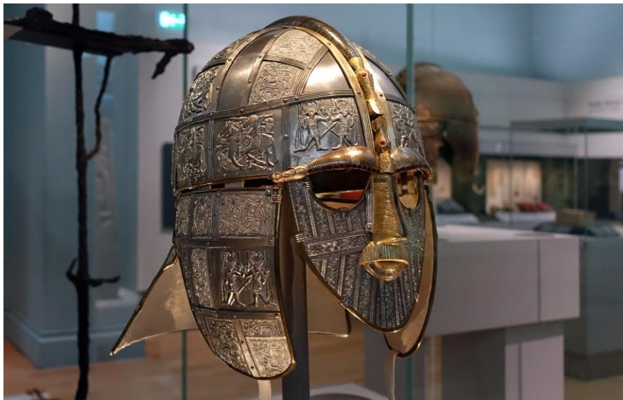
Sl. 8. Idejna rekonstrukcija kacige iz Sutton Hooa