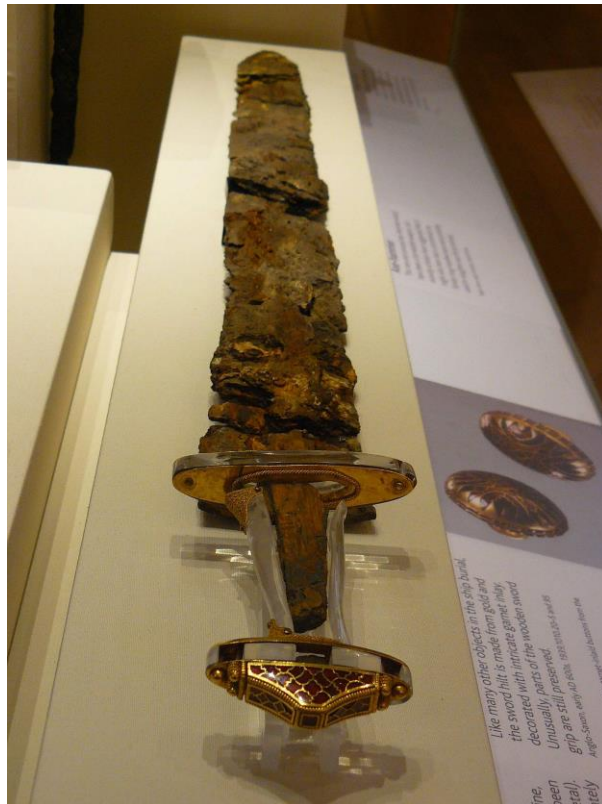
Sl. 10. Izvorna rekonstrukcija mača iz Sutton Hooa