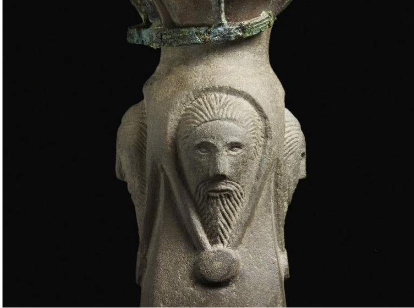
Sl. 9. Detalj “žezla” iz Sutton Hooa