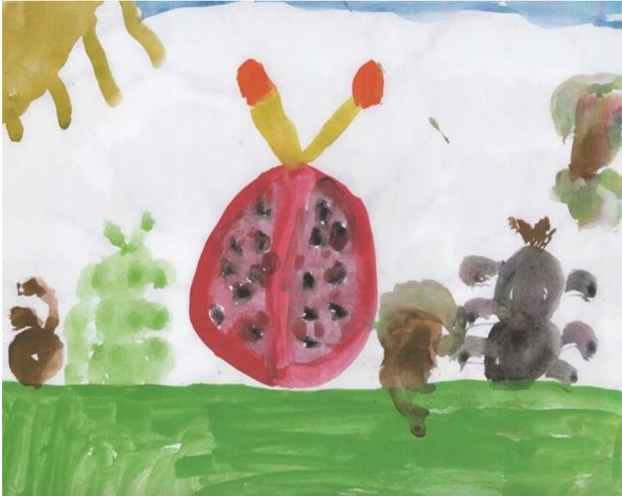
Slika 1. Stanovnici livade plešu čaroban ples, Mia (6)