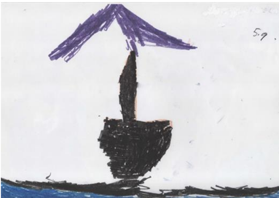
Slika 3. Zločesti dimnjak koji pluta po moru, Mladen (5)

Važnu ulogu kod likovnog izražavanja glazbenih dojmova ima i dobra odgojiteljeva priprema koja omogućuje da se djeca odazovu na aktivnost. Prije svakog slušanja potrebno je upozoriti djecu da će poslije slušanja crtati ili slikati ono što im glazba „priča“. Tako usmjerena djeca slušajući glazbu služe se sjećanjima i prethodno stečenim iskustvima kako bi stvorila svoju zamisao crteža ili slike.