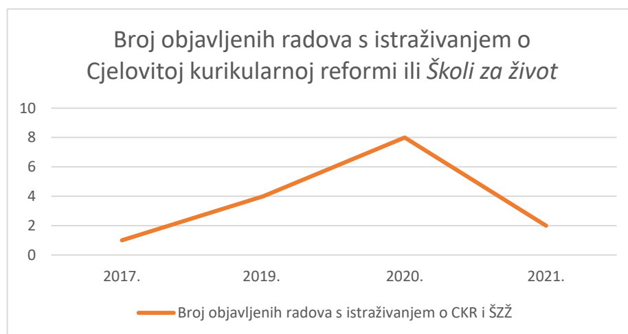
Grafikon 2. Distribucija radova prema kriteriju vremena njihova nastanka

Uzimajući u obzir teme istraživanja, svi su radovi nastali u vrijeme kad su Cjelovita kurikularna reforma i Škola za život bile izuzetno aktualne, što je razdoblje od 2014. do 2021. godine. Na sljedećem grafičkom prikazu vidljive su godine objave radova.