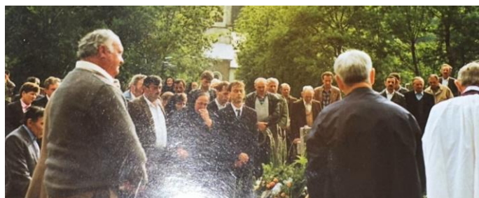
Slika 10 Sahrana