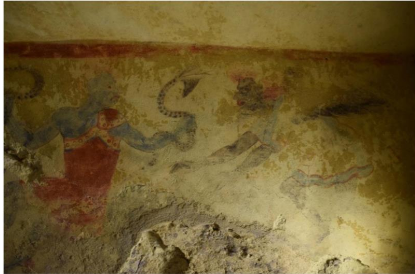
Slika 9. Plavi demon sa zmijama u ruci pored demona Eurinoma u Grobnici plavih demona (M. Morris, 2016, 23).

U istoj grobnici prepoznatljiv je prikaz demona koji stoji u čamcu i ima funkciju grčkog Harona, mitološke figure koja mrtve prevozi preko rijeke Stiks. Etruščanski Charun sličan je grčkom Haronu u njegovoj funkciji psihopompa, ali se njihov izgled razlikuje. Dok su Grci zamišljali Harona kao lađara koji preko rijeke Stiks prevozi pokojnike u zagrobni svijet, Etruščani su ga skoro uvijek zamišljali kao čudovište, personifikaciju smrti. Ipak, u Grobnici plavih demona u Tarkviniji, nalazi se prikaz koji se može usporediti s grčkim Haronom, sugerirajući da su Etruščani u ovom specifičnom kontekstu mogli imati prikaz Harona kao lađara. 64 U Grobnici Tomba dei rilievi prikazan je Charun s veslom i zmijskim nogama kako stoji pored psa Kerbera (Slika 10), koji čuva ulaz u podzemlje. Ovo je rijedak primjer Charuna koji ima prikazane motive koji bi se mogli usporediti s onima kod grčkog Harona, ali i ovdje nije u potpunosti prikazan kao čovjek već ima zmijske noge umjesto lađe. U ovom kontekstu Charun sa zmijskim nogama pored Kerbera prikazan je u ulozi čuvara vrata Hada prilikom dolaska pokojnika u podzemni svijet. 65