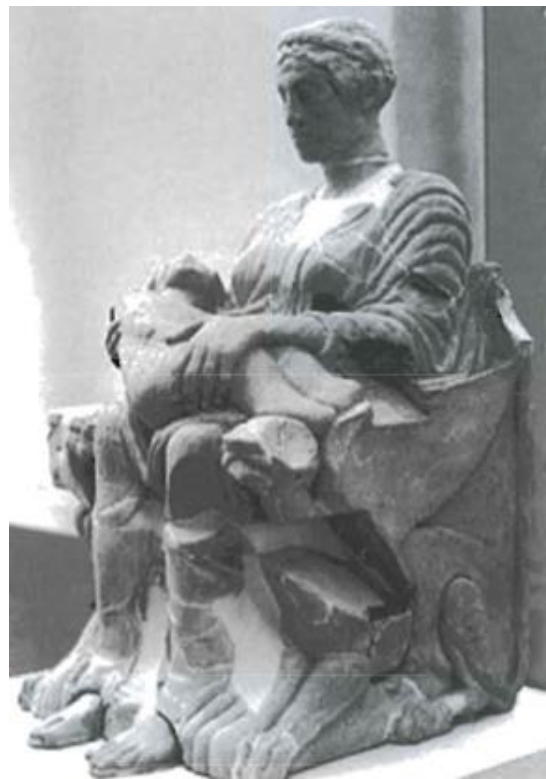
Slika 6. Žara iz grada Chianciano sa prikazom Phersipnai na prijestolju sa djetetom koje predstavlja pokojnika u ruci. (J. R. Jannot, 2000, 89.)