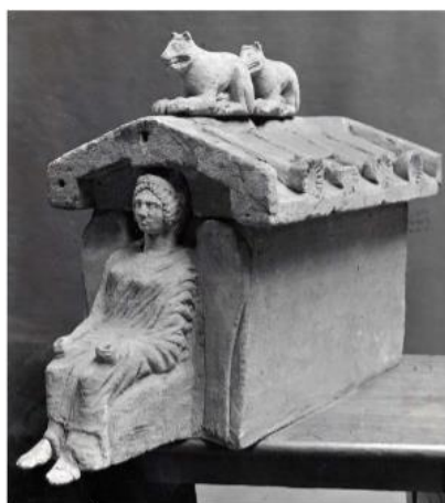
Slika 16. Žara u obliku kuće iz grada Chiusija.

također simbol transformacije hrane iz sirove u kuhanu te je tako božica povezana s mačkama također i božica transformacije. U prethodnom je poglavlju spomenut bog Apolon koji je kao božanstvo Sunca povezan s destruktivnom moći. U kontekstu Vanth koja izvršava funkciju Mojre, 85 ovdje se može povezati i sa božanstvom Sunca koje svojom destruktivnom moći ima mogućnost poznavanja sudbine i držanja ljudske sudbine u vlastitim rukama. 86 Dakle, Vanth bi se svojom ikonografijom mogla povezati s božicama, ali iz prethodnih primjera jasno je kako ona izvršava funkciju demona, tj. psihopompa.