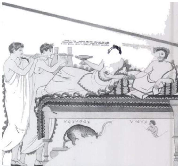
Slika 18. Aita i Phersipnai prikazani tijekom banketa u Grobnici Golini I. (N. T. de Grummond, 2006, 232).

Važan dio rituala pogreba jesu pogrebne povorke koje se pojavljuju na etrušćanskim grobnim freskama. Rani primjer pogrebne povorke prikazan je u Grobnici leoparda gdje su prikazani muškarci i žene koji nose ritualne predmete i kreću se prema banketu te u Grobnici Golini, gdje su dužnosnici zajedno s glazbenicima prikazani u pogrebnoj povorci. 109 Cilj pogrebne povorke je banket i u svijetu živih, ali i u svijetu mrtvih. U Grobnici Leoparda ritualnom banketu prethodila je pogrebna povorka i žrtvovanje životinje, a sama pojava banketa predstavlja završni ritualni čin čime je pokojnik ujedinjen sa precima gdje vladaju Aita i Phersipnai , a istodobno banket služi i za reintegraciju ožalošćenih u društvo nakon čega se mogu vratiti svom svakodnevnom životu. 110