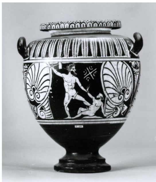
Slika 11. Prikaz Charuna s maljem u napadu na mušku figuru.

svijet stvorila se ovakva tipična slika Charuna drugačija od one u Grčkoj. 67 Smatra se i kako Charunov malj u većini prikaza nije simbolizirao sredstvo napada na pokojnika već je on imao funkciju otvaranja vrata podzemlja. No, u rijetkim slučajevima Charun je prikazan pri napadu na pokojnika upravo tim maljem, što ukazuje na njegovu dvojnju funkciju. U gladijatorskim je igrama figura slična etruščanskom Charunu, zvana Dis pater , naoružana maljem dolazila uklanjati mrtve iz arene. Keltski bog Sucellus također je prikazan s maljem u ruci, često uz božicu Nantosvelta s kojom se prikazuje kao božanski par. 68 Bog Sucellus prikazan je često i sa vučjom kožom na glavi kao etruščanski bog podzemlja Aita ili je prikazan uz Kerbera kao Charun na vratima podzemlja, ali svojim maljem ne izvršava funkciju ubijanja pokojnika. Moguće je da je bog Sucellus izvršavao sličnu funkciju kao etruščanski Charun na graničnom prostoru između živih i mrtvih kao čuvar. 69