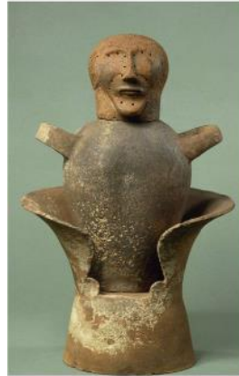
Slika 2. Urna iz 7. st. pr. n. e. s prikazom lica pokojnika iz grada Chiusi. Preuzeto sa https://www.britishmuseum.org/collection/object/G_1853-0604-1

teritorija razvijaju stav prema smrti i sudbini koji je često pesimističan. U ovom razdoblju se na freskama u grobnicama često pojavljuju Charun i Vanth , etruščanski „demoni“ i psihopompi koji mrtve ispraćaju u zagrobni svijet. 23