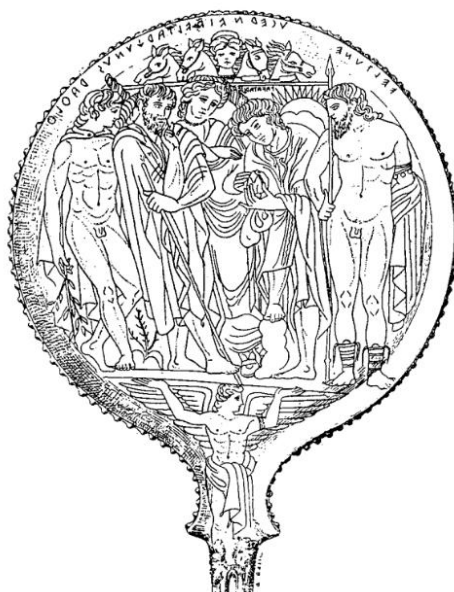
Slika 1. Zrcalo na kojem je prikazan Pava Tarchies (N. T. de Grummond, E. Simon, 2006, 30).

Tagesovo rođenje iz zemljine utrobe nosi mitske karakteristike jer i samo oranje brazde, koje za nas ima trivijalno značenje, u svijetu gdje je mit imao središnju ulogu ima religijski smisao. Plodnost žene se u takvim zajednicama izjednačava sa plodnošću zemlje te je uspješno obavljanje sijanja i sam rast biljaka izjednačavan sa ženskom mogućnošću stvaranja i rađanja. U europskoj tradiciji postojala su vjerovanja o djeci koja dolaze, kao i Tages , iz zemlje, bunara, vode, kamena, drveća, itd., što je sam prikaz zemljine plodnosti. No, postoji poveznica i sa svijetom mrtvih koji borave u istoj zemlji koja daruje plodnost i život. Pokojnik se nerijetko pokapao u „položaj fetusa“ što govori u prilog cikličkom pogledu na svijet – čovjek koji svoj život i podrijetlo duguje zemlji u istu se zemlju vraća umiranjem, a duše predaka one su koje utječu na stvaranje i plodnost biljaka. 15 Mit o Tagesu prikaz je ovih vjerovanja - njegov oblik djeteta i lice starca može se objasniti povezanošću kulta mrtvih i kulta plodnosti. Tages je dijete koje je dar božanstva zemlje, a lice starca