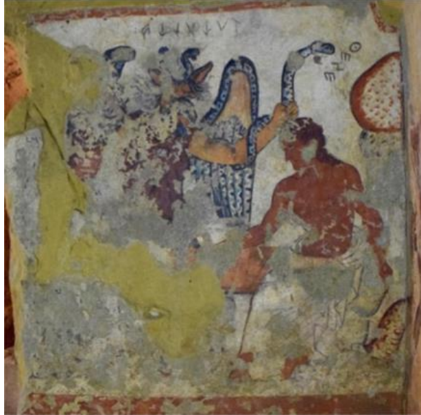
Slika 13. Tuchulcha pored Tezeja u Grobnici Orka II. (M. Morris, 2016, 22).

Charun i Tuchulcha sa svojim tipičnim karakteristikama - Charun je prikazan s maljem iza Alkestide, a Tuchulcha s bradatim zmijama iza Admeta. U mitu je Admet taj koji mora umrijeti, a Tuchulcha sa bradatim zmijama uperenima prema njemu izvršava taj prirodni poredak koji se ne smije narušiti. 73