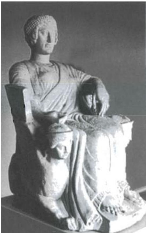
Slika 5. Žara iz grada Chiusija s prikazom božice Phersipnai na prijestolju. (J. R. Jannot, 2000, 89.)

na drugoj žari iz grada Chianciana, također datiranoj u drugu polovicu 5. st. pr. n. e., prikazana kako u ruci drži dijete koje bi predstavljalo pokojnika. Ikonografski ovakav prikaz odgovara ženskim božanstvima kao što je primjerice Izida s Horusom. Također, majčino mlijeko važan je simbol besmrtnosti, a uz metalne pločice pronađene u grobnicama Tarkvinije koje prikazuju rađanje, dodatno se povezuje smrt sa ponovnim rađanjem. U ovom kontekstu Phersipnai bi izvršavala funkciju majke pokojnicima koji se nadaju nastavku života u zagrobnom svijetu. 37