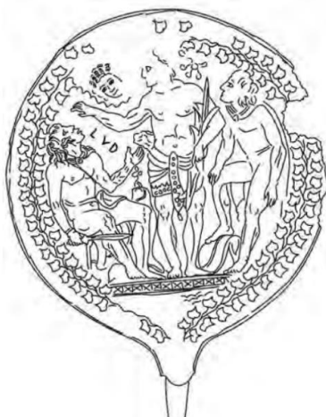
Slika 8. Zrcalo koje prikazuje Lura , Tiniju i nepoznatu figuru u ritualnoj sceni proricanja (N. T. de Grummond, 2014, 145).

rasporili utrobu ratnih zarobljenika kako bi proricali iz njihovih utroba. Naravno, to ne znači kako su Gali ili Kimbri naučili Etrušćane proricanju iz ljudskih žrtava već sugerira na ovu mogućnost i kod Etrušćana. 54 Tijelo s odrubljenom glavom pronađeno je u gradu San Giovanale na dnu bunara, a epigrafski dokazi sugeriraju na to da je Lur Larunitla tu imao svoj kult. 55 Upitno je u kojoj su mjeri korištene ljudske žrtve u svrhu proricanja, ali ipak postoje dokazi koji sugeriraju na to, i to ne samo u kontekstu božanstva Lura. Ljudska žrtva dječaka iz 9. st. pr. n. e. pronađena je u Tarkviniji na mjestu gdje je oltar putem prirodnog kanala bio povezan sa šupljinom u zemlji, što je bilo pogodno za libacije. Kostur ovog dječaka pokazuje kako je bolovao od epilepsije, što je u antici bilo povezano s proročkim sposobnostima koje su se manifestirale u trenutku epileptičkog napadaja. U gradu Cetamuri pronađena je ljudska tibija među životinjskim kostima u svetoj jami. Na ovom je mjestu moguć i Lurov kult jer je pored peći i žrtvenika pronađena keramička pločica s natpisom Lurs . Sve ovo sugerira na to da se Lur prikazuje kao božanstvo povezano s ratom, proricanjem i podzemnim svijetom. 56