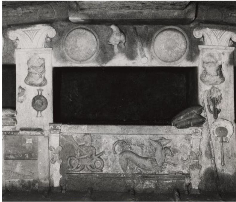
Slika 10. Prikaz Charuna s veslom i zmijskim nogama pored Kerbera u Grobnici Tomba dei rilievi .

Karakteristike etrušanskog Charuna razvijene su na etrušanskom području, a njegovi su atributi tipični za etrušansko poimanje smrti. Dakle, iako se u umjetnosti javljaju grčki motivi, to su pretežito mitološki motivi koji su svoje značenje mogli dobiti i u Etruriji, neovisno o njihovom podrijetlu, to jest, mitovi i religija nekog naroda mogu se razvijati razmjenom različitih simbola i mitoloških motiva koji u konačnici imaju isto značenje. Zbog toga je moguć sinkretizam, jer se ta pojava ne javlja isključivo zbog historijskih procesa između nekih razvijenih naroda, već je moguć upravo zbog percepcije svetog, a određena skupina ljudi će taj mitološki motiv, psihopompa ili božanstvo, prilagoditi svojim potrebama ili ga uklopiti u panteon svojih bogova. 66 Stoga je Charun kod Etrušćana uglavnom prikazan sa svojim tipičnim atributima – prikazan je kao krilati demon razbarušene kose, s kukastim nosom, magarećim ušima i maljem u ruci (Slika 11), a funkciju lađara napušta. Upravo zbog etrušanskog već postojećeg poimanja demona koji mrtve vode (ili pak tjeraju) u zagrobni