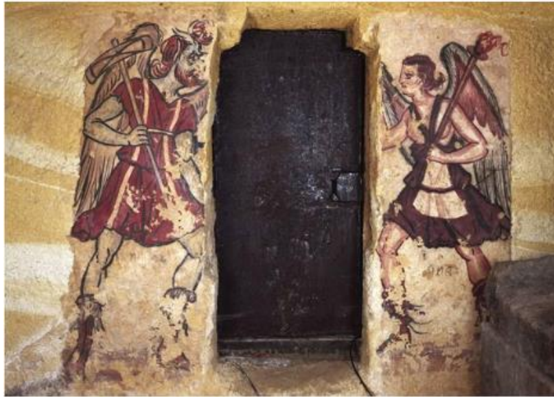
Slika 15. Vanth i Charun kao čuvari vrata podzemlja u Grobnici Anina (M. Morris, 2016, 31).

No, prikaz Vanth kao čuvarice vrata podzemlja nije prvi takav prikaz. Žara iz grada Chiusija (Slika 16), napravljena u obliku hrama ili kuće, datira se u kasno 5. ili rano 4. st. pr. n. e. te je na njoj prikazana ženska krilata figura u sjedećem položaju koja bi mogla predstavljati Vanth upravo u funkciji čuvara vrata podzemlja. 84 Ova figura je u rukama imala dva predmeta koji su vrlo vjerojatno predstavljali baklje, a na krovu žare nalaze se dvije pantere, također u funkciji čuvara kao i sfinge u Grobnici Anina. Mačke, kao psi i vukovi, imaju sličnu simboličku funkciju kretanja između svijeta živih i mrtvih, jer su predatori koji love noću te se kreću na velike udaljenosti, a mačke kao čuvari vrata podzemlja pojavljuju se i u etruščanskim grobnicama. Smatram kako je ovdje Vanth , ili pak figura koja izgleda kao Vanth , ikonografski prikazana bliže božici podzemlja. Mačke su često prikazane pored ženskih božanstava kao što su Kibela koja sjedi na tronu pored mačaka, božica minojske Krete sa zmijama u ruci i mačkom na glavi te egipatska božica Sekhmet prikazana s mačjom glavom. U Egiptu mačke su povezane s božanstvom Sunca te su bile zvane „kćeri boga Ra“, a samo je Sunce simbolički povezano s vatrom i ognjištem. Ognjište je kao središte doma