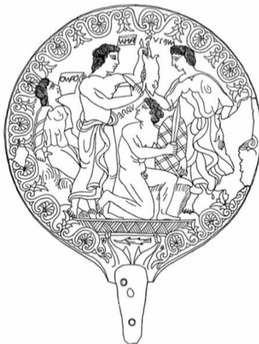
Slika 14. Vanth na brončanom zrcalu gdje je prikazana scena pročišćavanja Oresta (B. E. MacDonald, 2022, 28).

izvršava funkciju psihopompa kao inače. Prikazana je donekle nezainteresirano za sam događaj, kao i na zrcalu iz Bolsene, na kojem je prikazana scena ubojstva Troila, 78 pri čemu Vanth strpljivo čeka završetak događaja. No, moguće je da je Vanth slična grčkim Mojrama, božicama sudbine. Poznato je da je Oresta ubio ugriz zmiје u Arkadiji, a upravo na ovom zrcalu Vanth čvrsto drži zmiју kao da poznaje njegovu sudbinu, ali se ona još ne treba dogoditi. 79 Hipoteza o poistovjećivanju značenju imena Vanth kao riječi sudbina moglo bi se povezati s tom mitološkom scenom, ali i s njenim prikazima sa svitkom s kojega, vrlo vjerojatno, čita sudbinu preminulog. 80