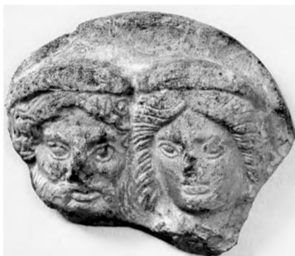
Slika 4. Skulptura Aite i Phersipnai iz 5. st. pr. n. e. iz svetišta Cannicella (N. T. de Grummond, E. Simon, 2006, 150.).

šakali uočava se zanimljivo instinktivno ponašanje zakopavanja i otkopavanja kostiju što bi ih dalje povezivalo sa zagrobnim svijetom te su upravo zbog svoje povezanosti sa zagrobnim svijetom psi ponegdje bili i žrtvovani. U svetištu Cannicella, u kojem se štovalo žensko božanstvo ( Vei , Phersipnai ili Turan ), i u kojem su pronađeni reljefi na kojima su prikazani Aita i Phersipnai (Slika 4) te Demetra i Kora , pronađeni su ostaci žrtvovanih životinja, uključujući i žrtvovane pse. Pas je životinja izuzetno ktoničnog karaktera koja se često prikazuje i uz druge životinje koje izvršavaju sličnu simboličku funkciju kao što su pijetao ili zmije. U svetištu su pronađeni i ostatci vrana što bi sugeriralo i na mogućnost korištenja ovog svetišta kao mjesta za proricanje, jer je i samo proricanje usko povezano sa zagrobnim svijetom. Čuvajući vrata zagrobnog svijeta oni također vrše ulogu psihopompa – kad se duša pokojnika vraća među žive često je prikazana sa psom, a često su božanstva podzemlja, kao što je Hekate , prikazana kao psi. Pas bi, dakle, zbog svojih ktoničnih karakteristika, mogao biti smatran „nečistom“ životinjom i zbog toga žrtvovan s ciljem ritualne purifikacije. 32 U kasnijim stadijima etruščanske kulture, Aita prestaje imati karakteristike vuka te je često prikazan na banketima uz suprugu Phersipnai (Slika 18) kao vladar podzemlja.