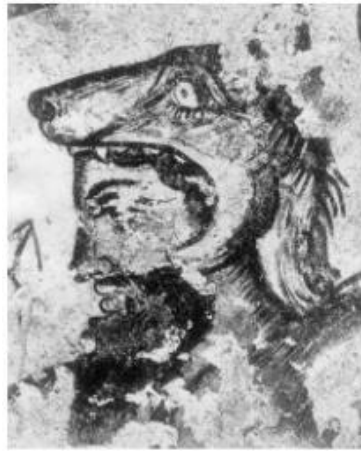
Slika 3. Aita sa vučjom kapom na glavi iz Grobnice Orka II. (N. T. de Grummond, E. Simon, 2006, 71).

u obliku psa, ali se kao vladar podzemlja isključivo prikazuje Aita , dok se Calu spominje u kontekstu mrtvih koji njemu odlaze. 26