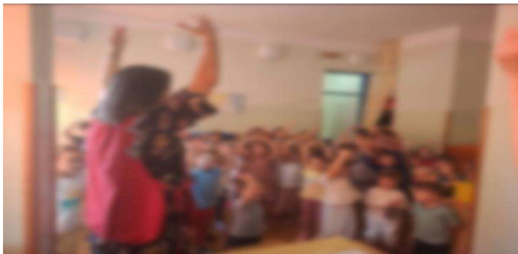
Slika 21. Pokret uz pjesmu Da mi je biti morski pas

Nadalje, djeca iz ove skupine vole izvoditi pokrete i uz pjesmu Da mi je biti morski pas koju su, u ovom slučaju, izvodila s djecom iz drugih skupina (slika 21).