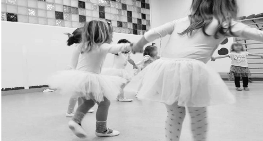
Slika 5. Ritmika i ples u dječjem vrtiću