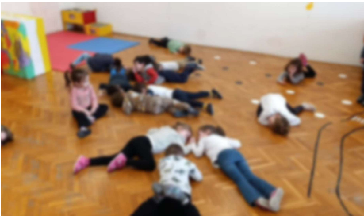
Slika 24. Pokret uz pjesmu Puž