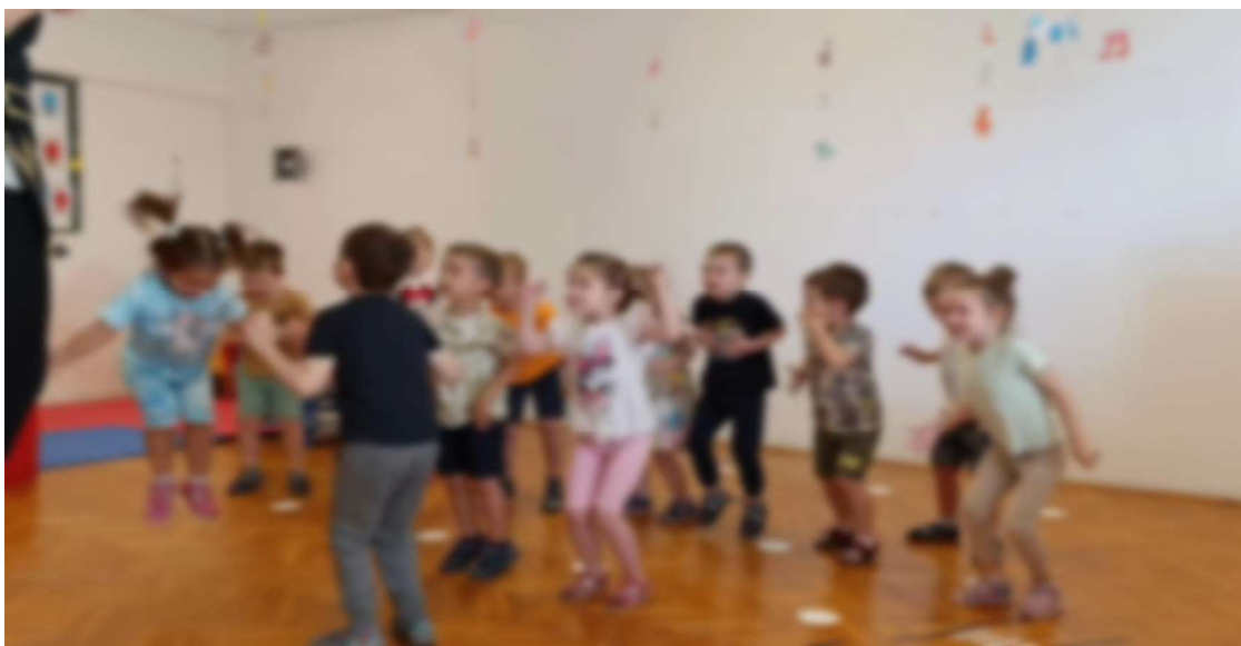
Slika 20. Pokret uz pjesmu Hoki-poki