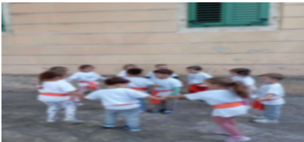
Slika 28. Plesanje kola uz pjesmu Igra, šeta 1