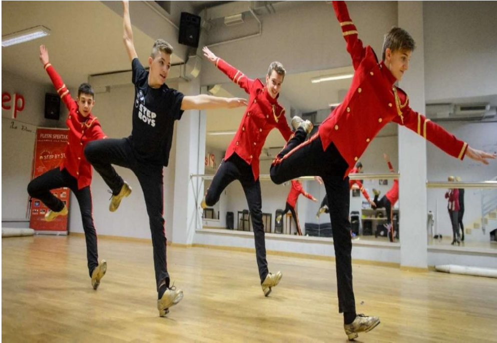
Slika 3. Step ples

Svaki od tih plesova ima svoje specifičnosti te ga obilježava kompleksnost u izvođenju zbog čega se profesionalni plesači moraju puno truditi, vježbati i raditi kako bi bili uspješni. Međutim, mnogo je ljudi koji plešu isključivo iz zabave i, kako bi reklo, „sebi za dušu“, odnosno uživaju u tome i plešu kako bi bili ispunjeni, ali na amaterskoj razini.