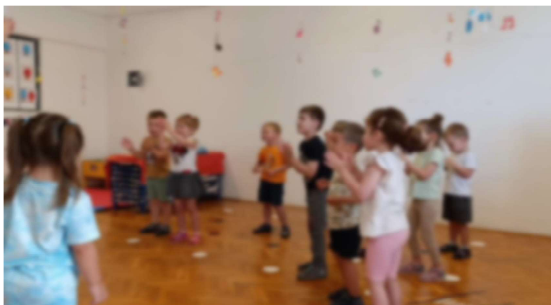
Slika 23. Pokret uz pjesmu Rim Tim Tagi Dim 2