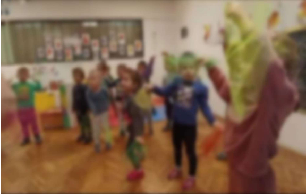
Slika 8. Pokretna igra – valcer cvijeća

Nadalje, odgojiteljice su zadale djeci pokretnu igru, odnosno plesale su zajedno s njima valcer cvijeća (slika 8).