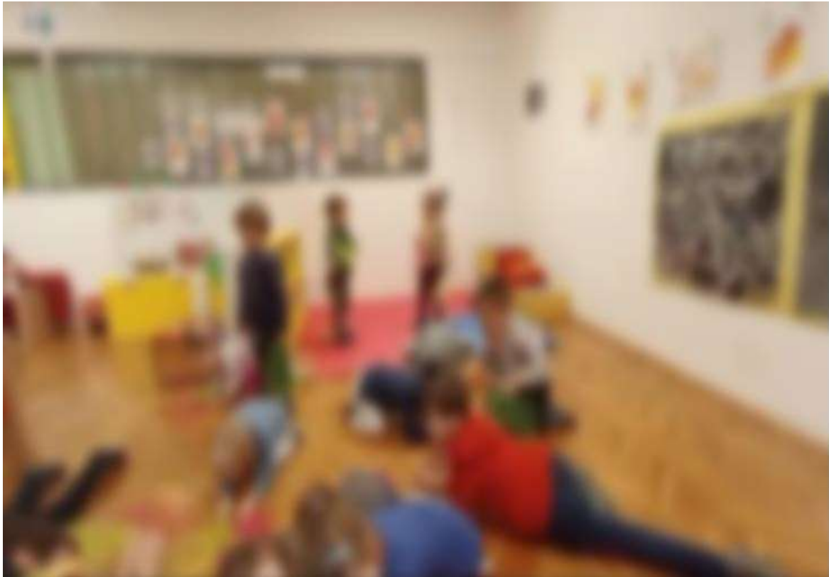
Slika 9. Pokretna igra – valcer cvijeća 2

I sljedeća slika prikazuje pokretnu igru – valcer cvijeća.