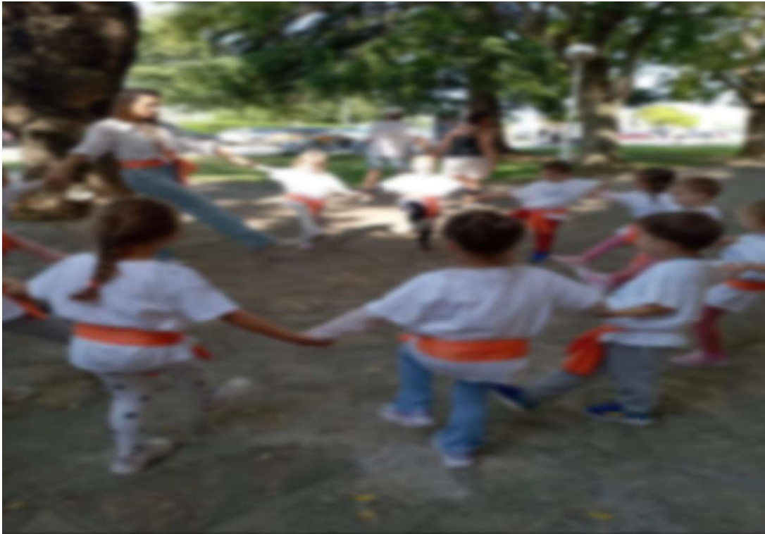
Slika 25. Plesanje kola 1