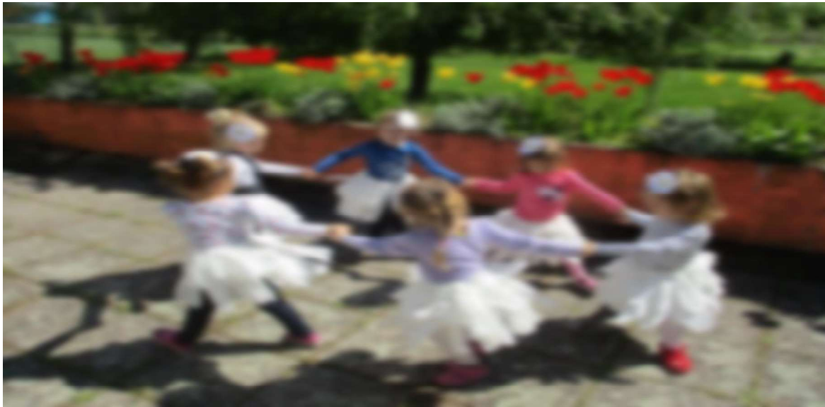
Slika 4. Ples kod djece rane i predškolske dobi