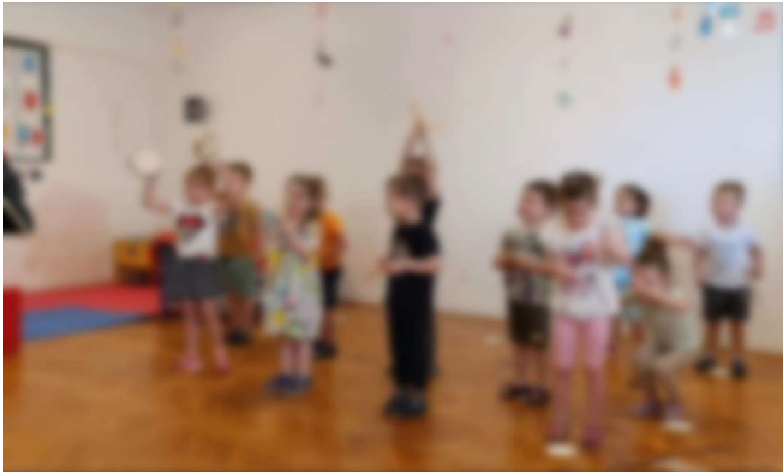
Slika 12. Ritmičke vježbe s instrumentima – udaranje i lupkanje

nogama, kao da su si davala dodatan ritam. Također, djeca su međusobno izmjenjivala instrumente kako bi svako dijete isprobalo svaki od instrumenata te su se na kraju opet vratila na svoj najdraži instrument pri čemu su se zaista lako dogovorila. Navedenu aktivnost prikazuje slika 12.