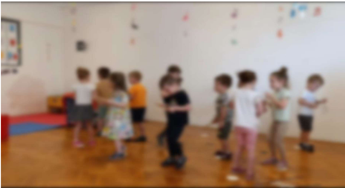
Slika 15. Ritmičke vježbe – udaraljke