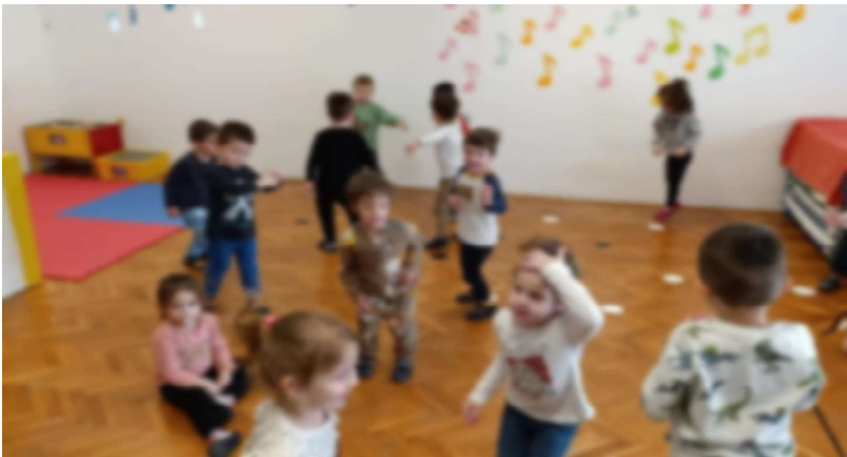
Slika 7. Slobodan ples – kreativno izražavanje

Prvi primjer je slobodan ples u kojemu su se djeca slobodno kretala uz pjesmu, bez ikakvih zadanih pokreta, a rezultate prikazuje slika 7.