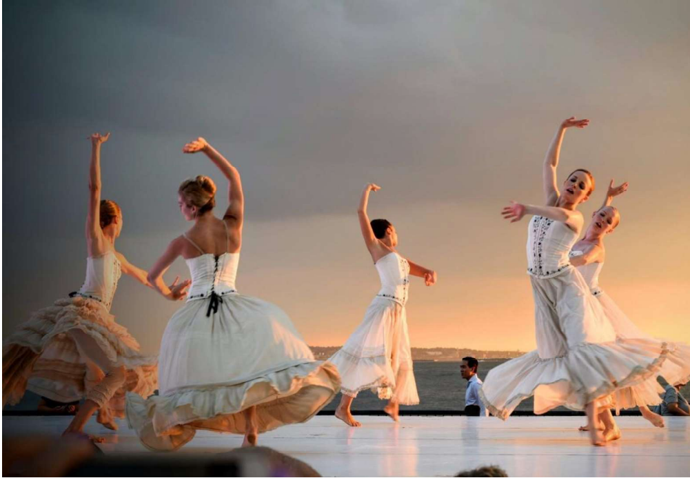
Slika 1. Ples