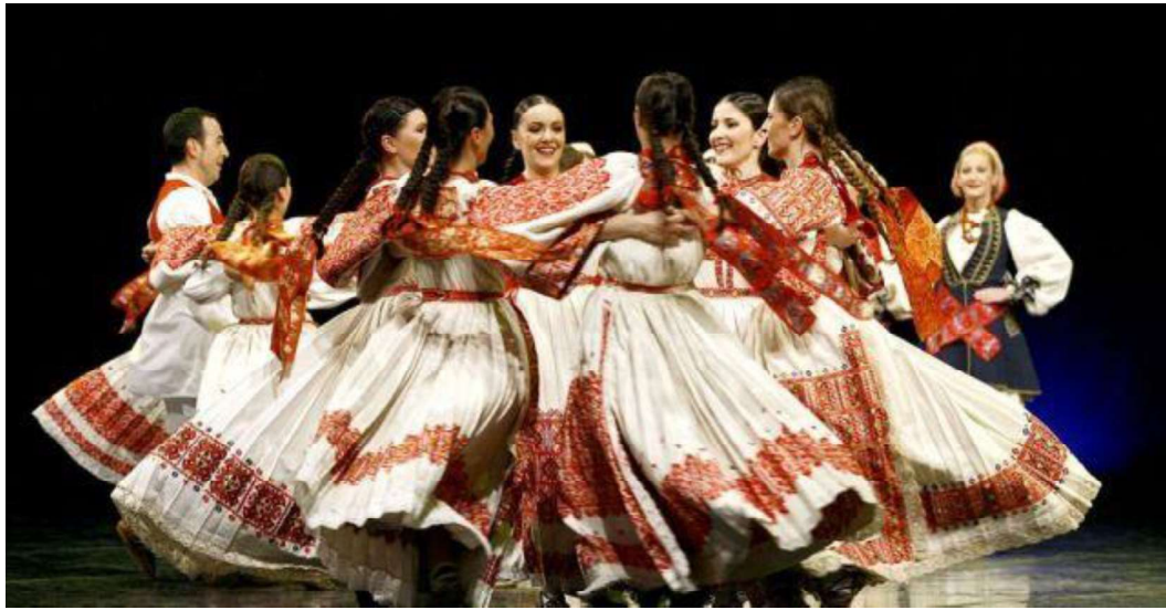
Slika 2. Folklor