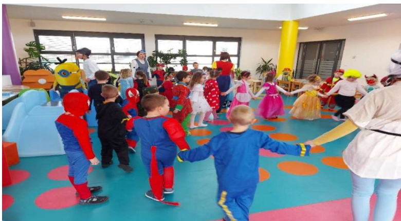
Slika 6. Odgojitelji i djeca plešu