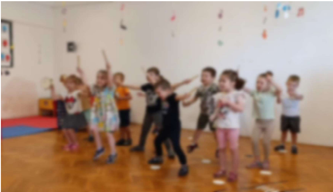
Slika 16. Ples s udaraljka – Rim Tim Tagi Dim