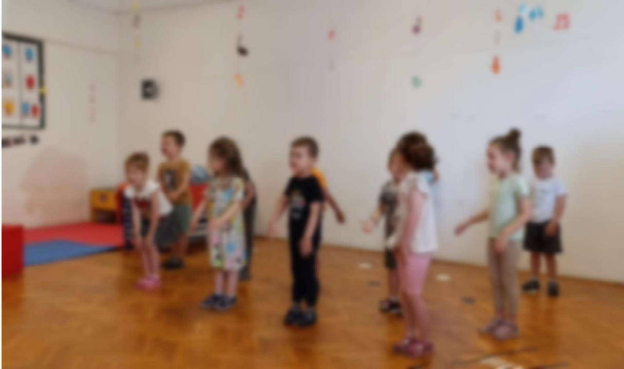
Slika 13. Pačji ples