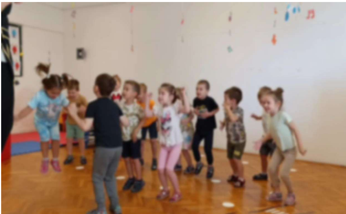
Slika 14. Ritmičke vježbe, udaraljke – Clap clap song