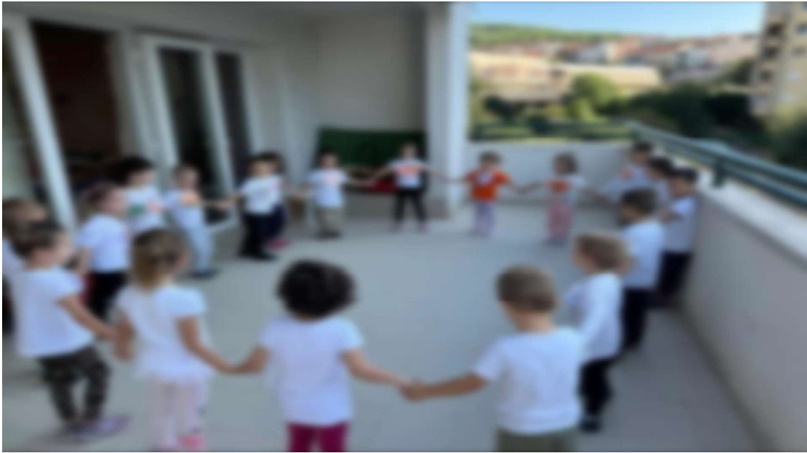
Slika 26. Narodni plesovi u vrtiću – Sv. Mihovil 1