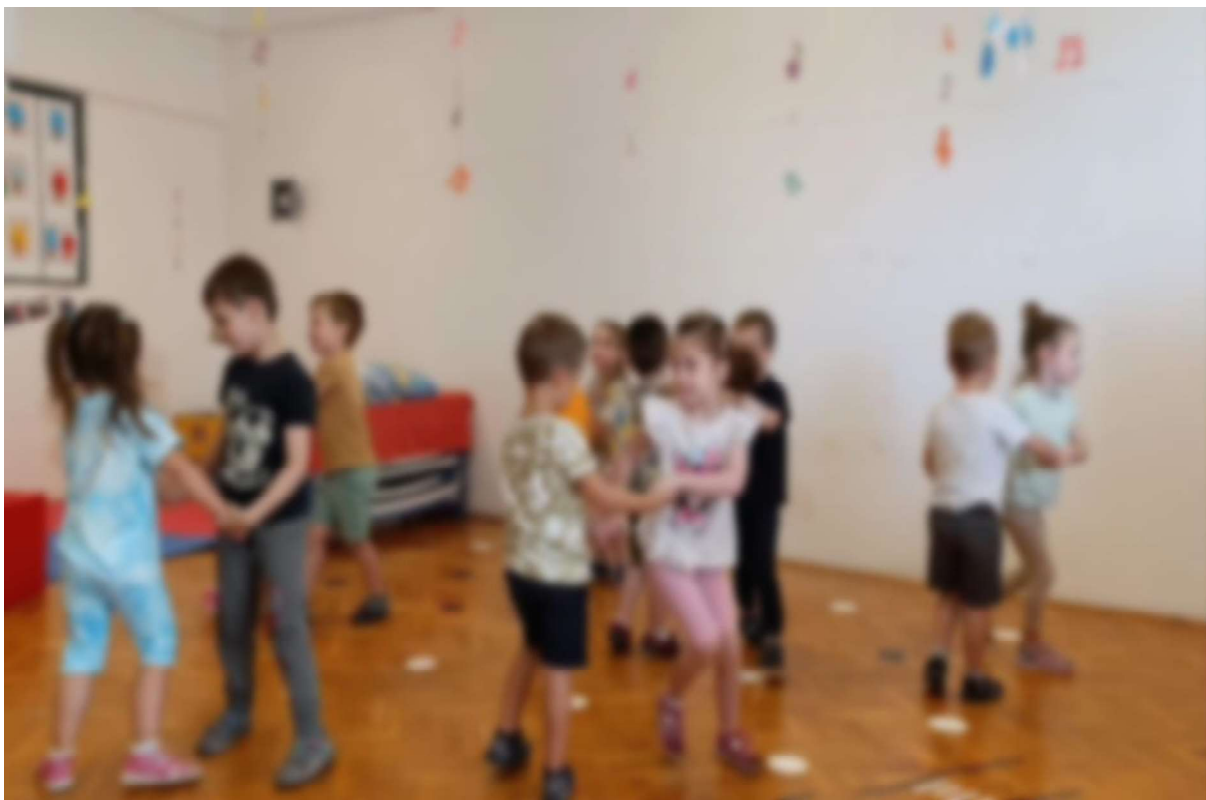
Slika 11. Pokretna igra Medo