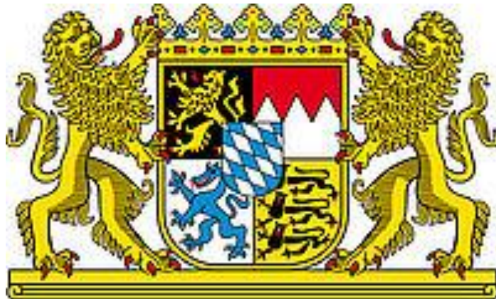
Slika 1: Veliki bavarski državni grb