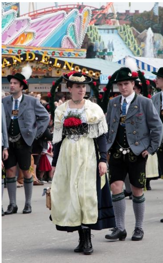
Slika 11,12: Tradicionalna odjeća ( Trachten )