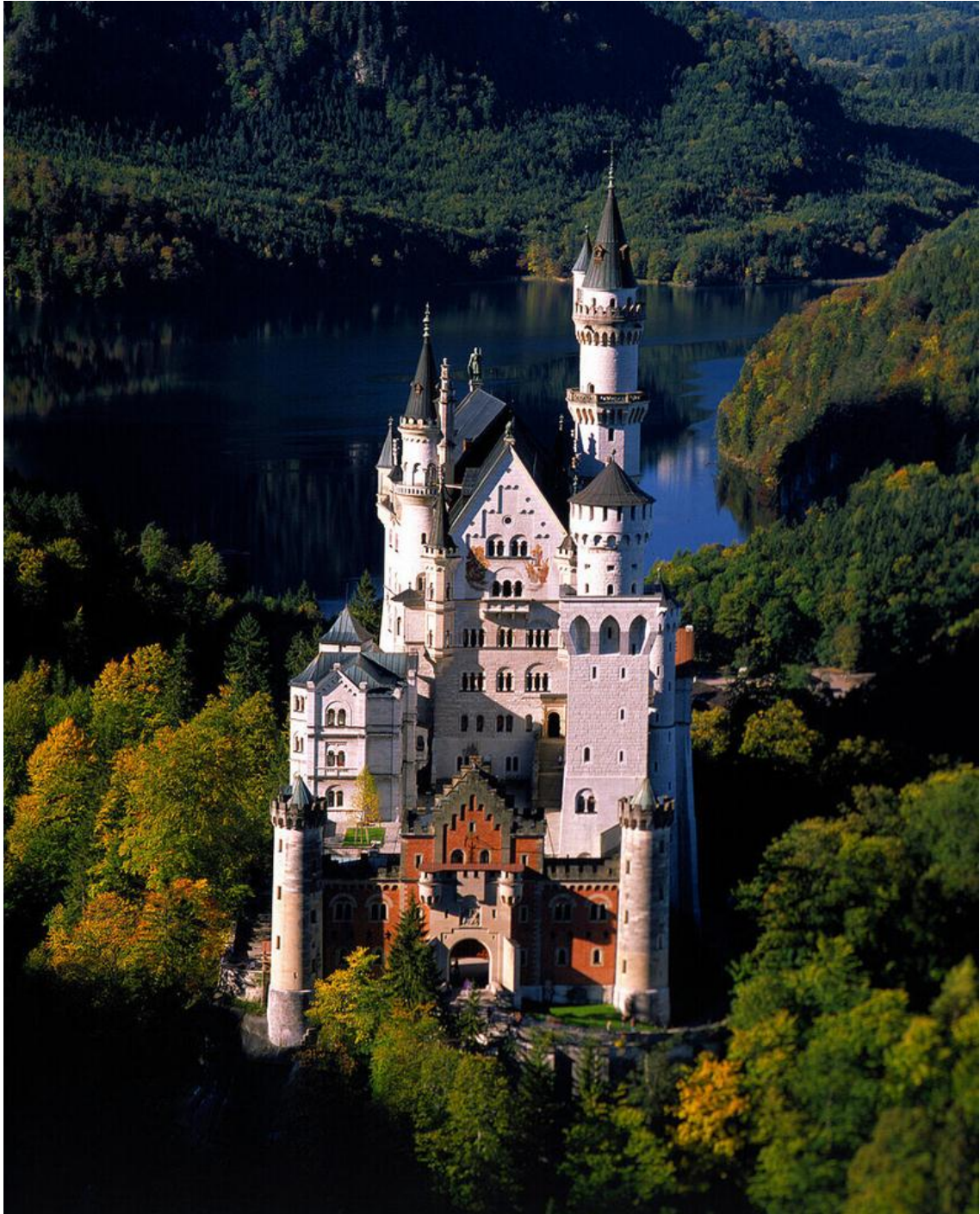
Slika 19: Dvorac Neuschwanstein