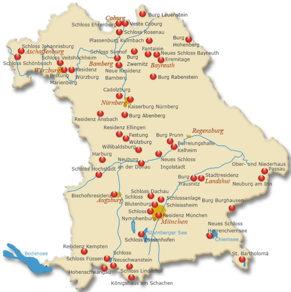
Slika 16: Bavarski dvorci i palače