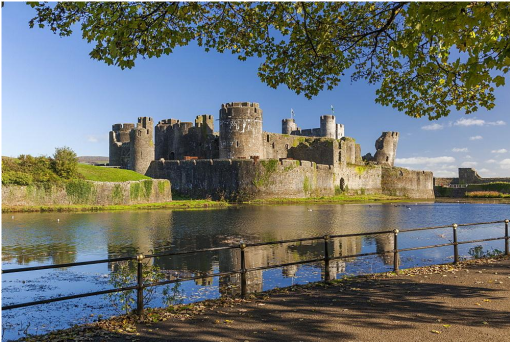
Slika 14: Koncentrični dvorac Caerphilly