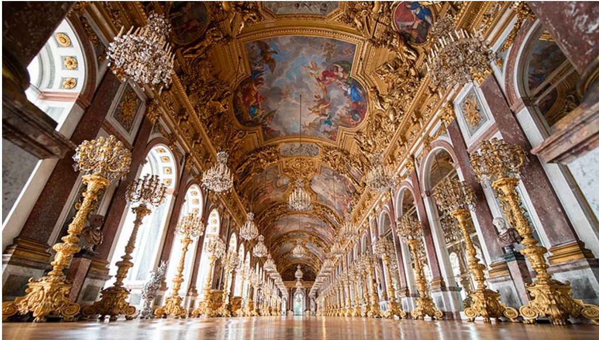
Slika 24: Dvorac Herrenchiemsee - Große Spiegelgalerie