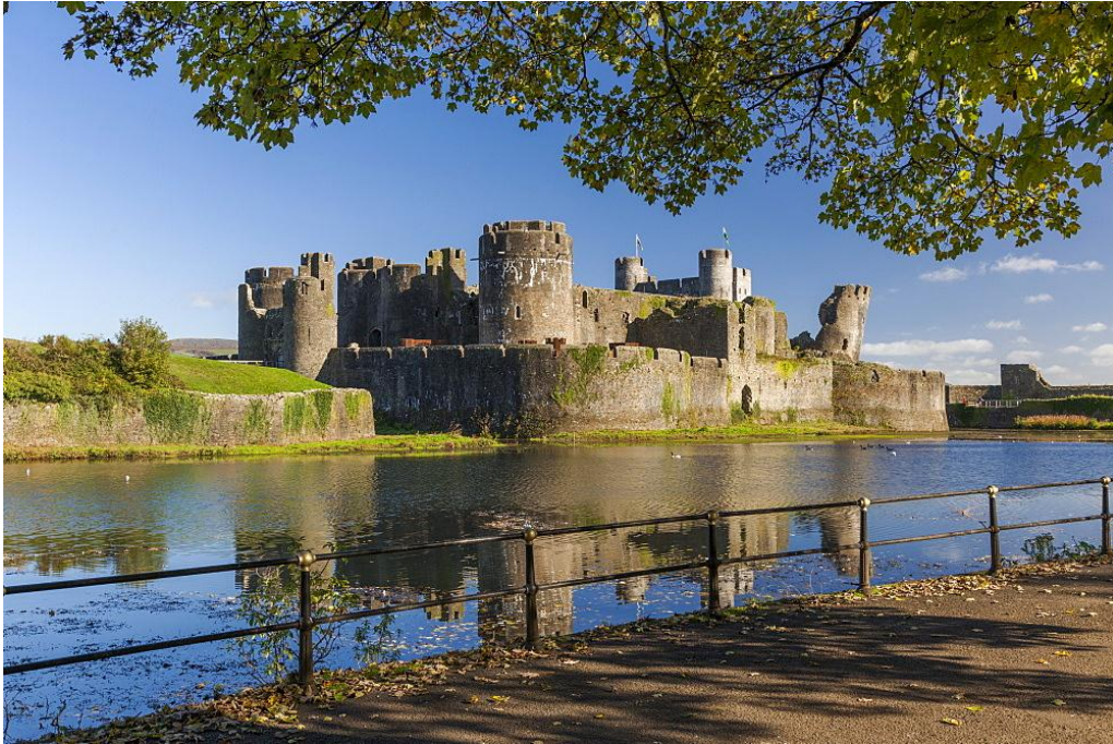
Slika 14: Koncentrični dvorac Caerphilly