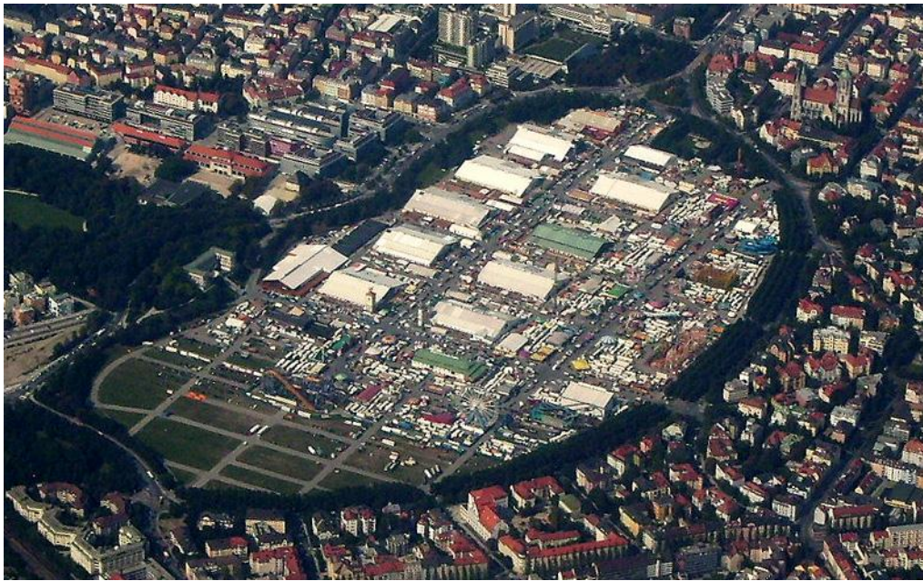
Slika 6: Theresienwiese dan prije otvaranja Oktoberfesta 2006.