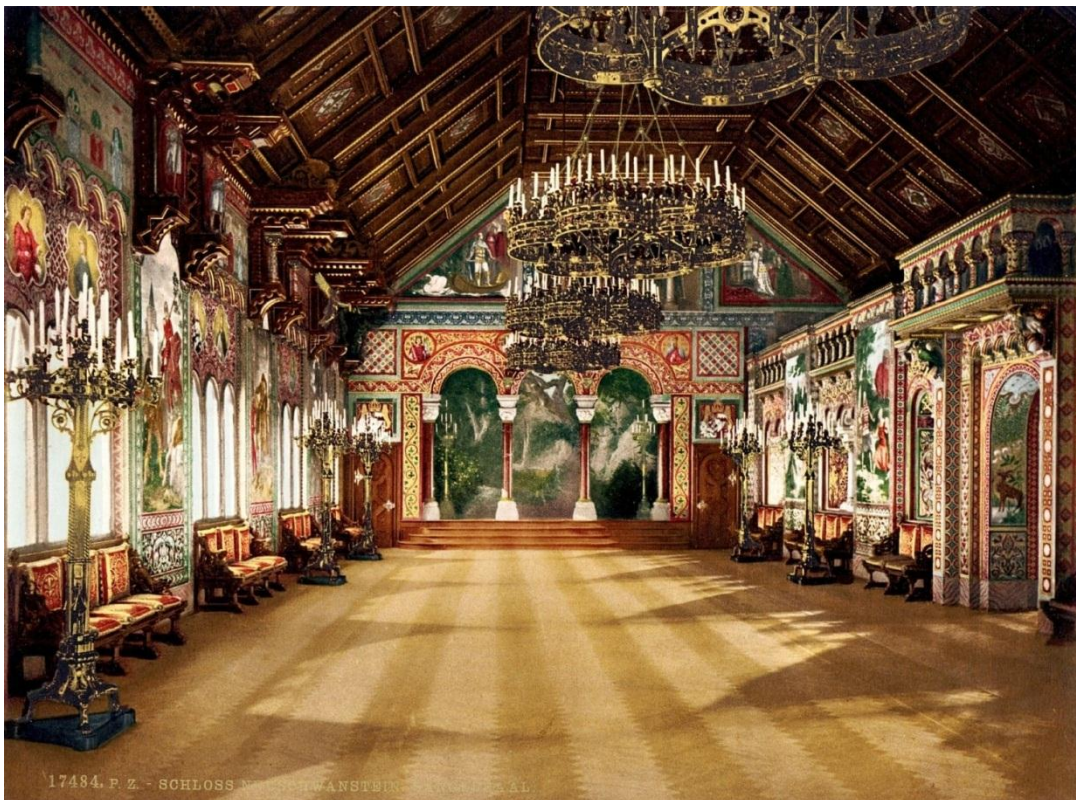
Slika 20: Neuschwanstein: Sängersaal