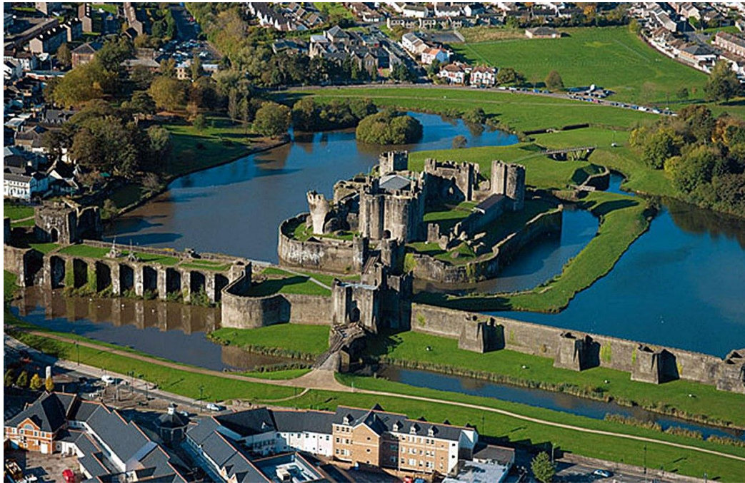
Slika 15: Dvorac Caerphilly