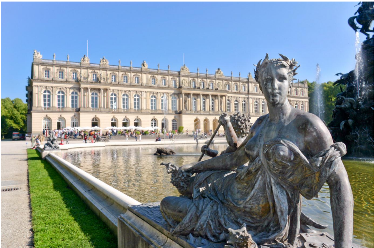
Slika 24: Dvorac Herrenchiemsee - Figura pored fontane ispred dvorca