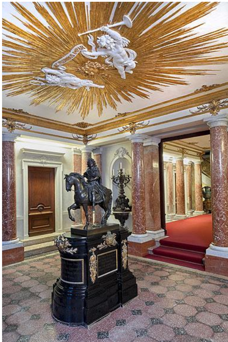
Slika 22: Linderhof - Vestibül