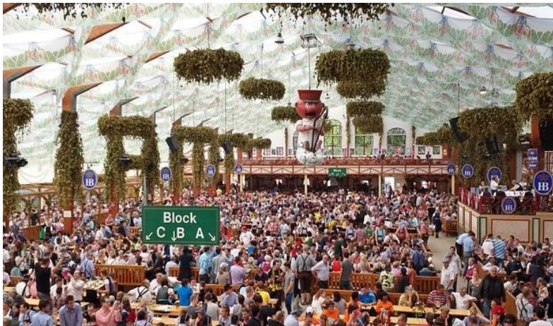
Slika 7-9: Oktoberfest