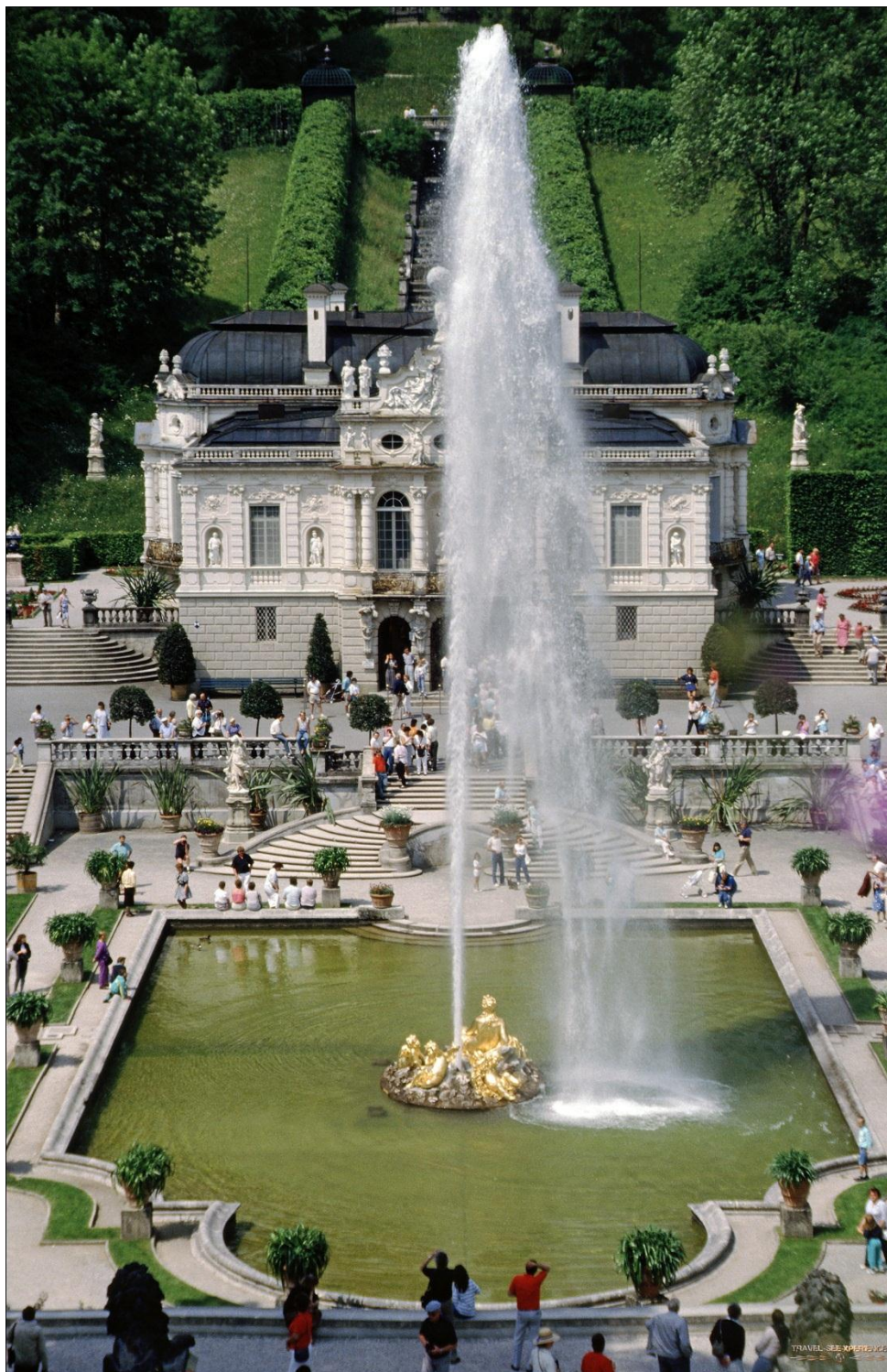
Slika 21: Dvorac Linderhof

Izvor: https://travel-see-xperience (15. 1. 2020.)