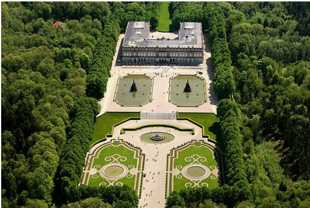
Slika 23: Dvorac Herrenchiemsee – Pogled iz zraka