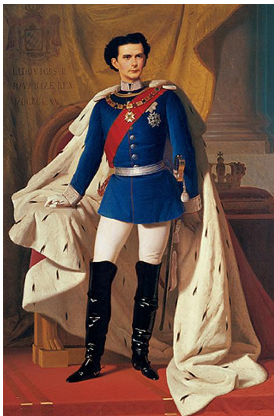
Slika 17. Kralj Ludwig II.