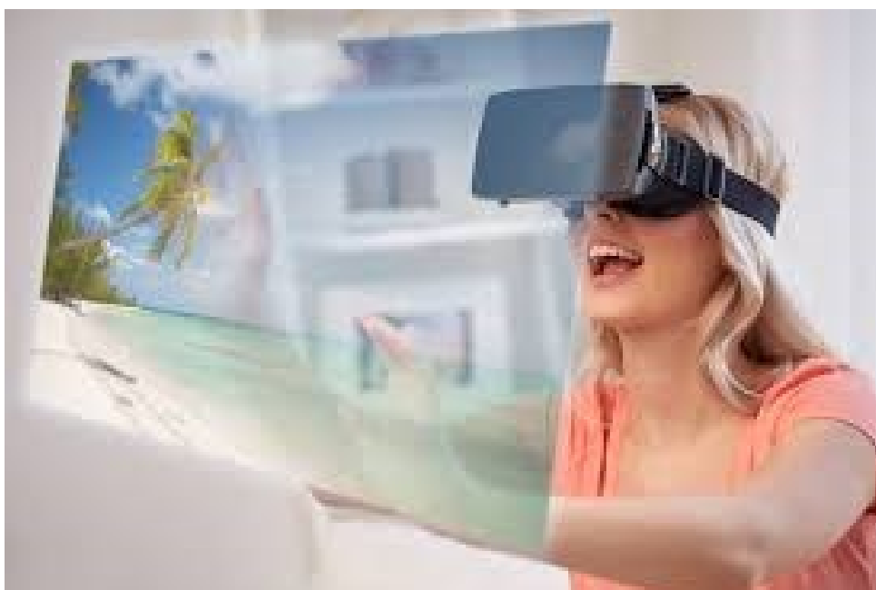
Slika 3. Virtualno putovanje pomoću VR tehnologije

Također, kroz virtualna sučelja rezervacija, korisnici mogu virtualno razgledati zrakoplov i odabrati sjedala putem simuliranoga iskustva. Preklapanje znanja i učenja kroz virtualnu stvarnost omogućuje povezivanje apstraktnih ideja sa stvarnim i fizičkim okruženjem. Nerijetko se primjenjuje za prikaz i doživljaj brojnih turističkih mjesta koja su povijesno poznata, kao i za prikaz umjetničkih izložbi, za obilaske parkova, gradova i sl. Smatra se da virtualna interakcija i znanje mogu omogućiti uvjerljivo imerzivno iskustvo uz podržavanje ekološke i socio-kulturne održivosti (Immersionvr.co.uk).