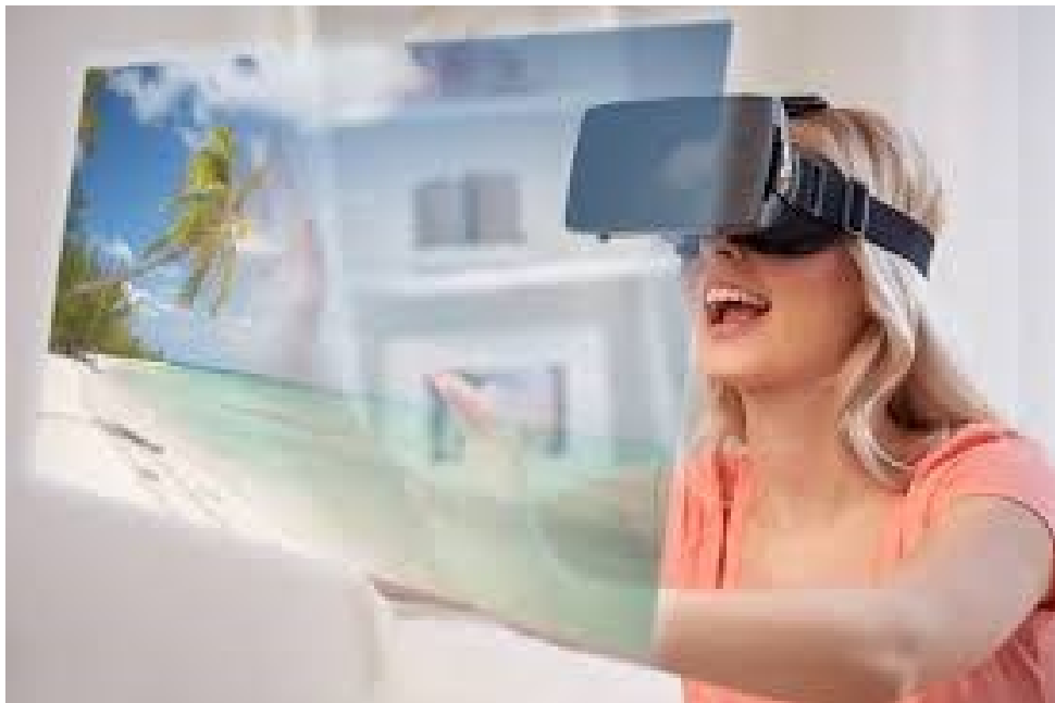
Slika 3. Virtualno putovanje pomoću VR tehnologije

Također, kroz virtualna sučelja rezervacija, korisnici mogu virtualno razgledati zrakoplov i odabrati sjedala putem simuliranoga iskustva. Preklapanje znanja i učenja kroz virtualnu stvarnost omogućuje povezivanje apstraktnih ideja sa stvarnim i fizičkim okruženjem. Nerijetko se primjenjuje za prikaz i doživljaj brojnih turističkih mjesta koja su povijesno poznata, kao i za prikaz umjetničkih izložbi, za obilaske parkova, gradova i sl. Smatra se da virtualna interakcija i znanje mogu omogućiti uvjerljivo imerzivno iskustvo uz podržavanje ekološke i socio-kulturne održivosti (Immersionvr.co.uk).