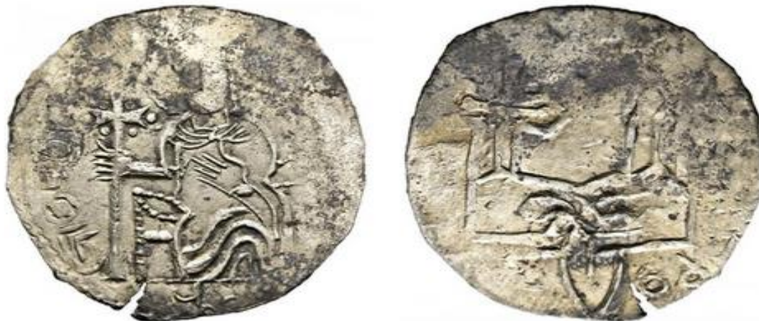
Slika 6: Svjatopolkov srebrenik

Kijevisko kovanje novca prestaje s Jaroslavom. Jedno kratko vrijeme knez Oleg Svjatoslavič kovao je svoj novac s likom sv. Mihaela. Kovanje novca, kao glavnog sredstva plaćanja na kijeviskom prostoru, međutim, nije ispunilo svoju svrhu. Naime, Jaroslav je zaustavio kovanje novca jer je vidio kako ono nije moglo zamijeniti strane valute kao što su denier ili dirham. 67