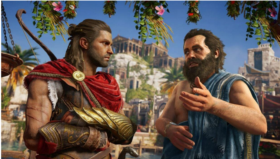
Slika 2 Prikaz glavnog lika Alexiosa i Sokrata u igri AC Odyssey