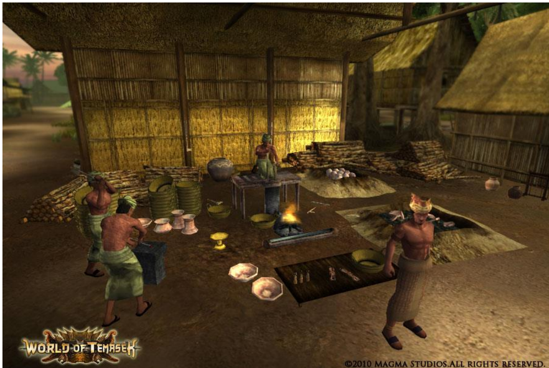
Slika 5 Prikaz iz igre World of Temasek