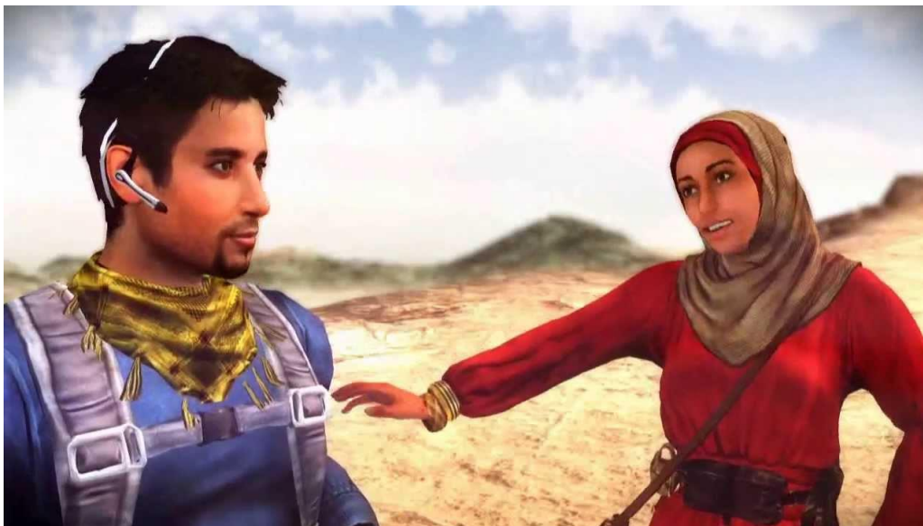
Slika 3 Prikaz glavnog lika Farisa i Danie u igri Unearthed: Trial of Ibn Battuta