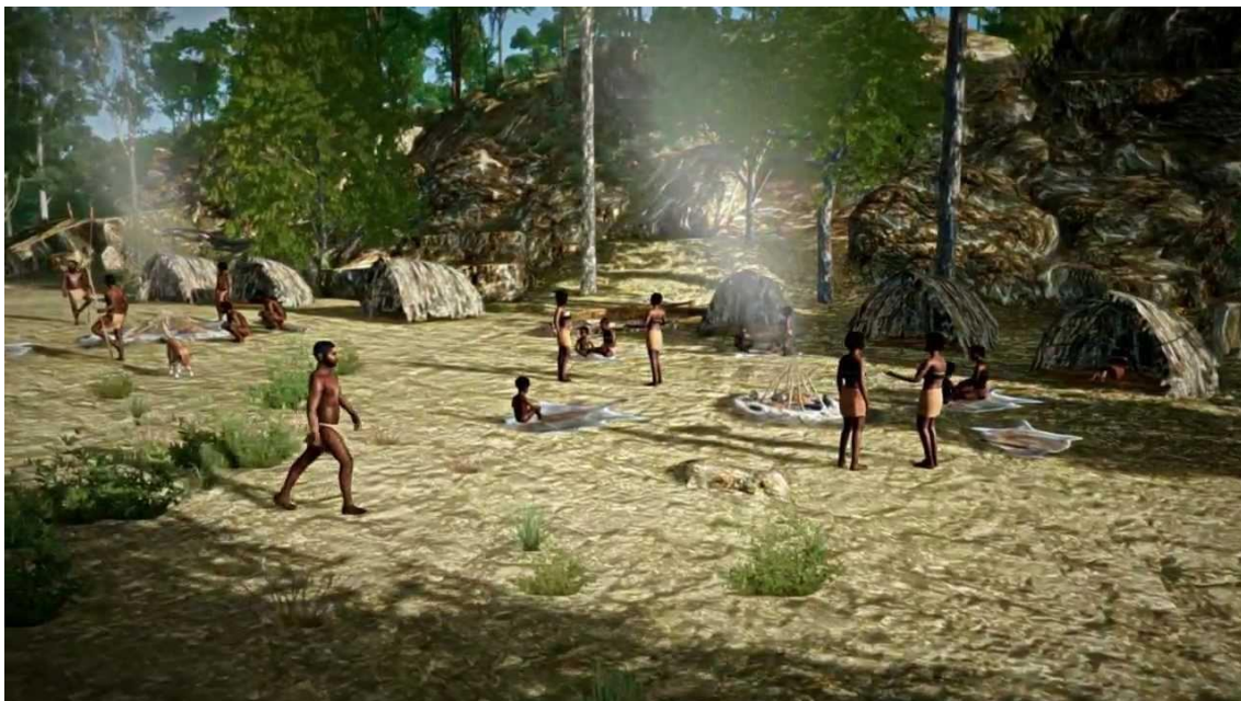
Slika 4 Prikaz iz igre Virtual Warrane II: Sacred Tracks of the Gadigal