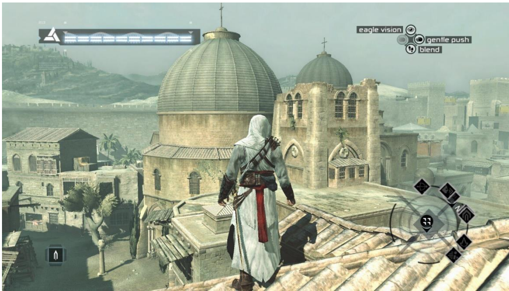
Slika 1 Prikaz Bazilike Svetog groba u Assassin's Creed I