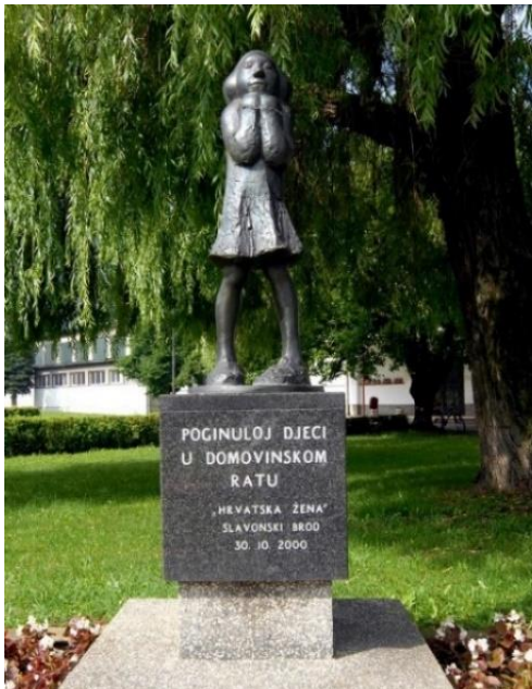
Slika 6. Spomenik "Djevojčica"