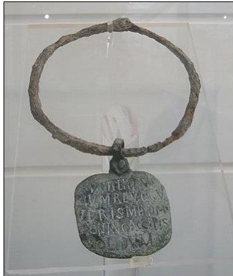
(Slika 2. Ovratnik robova, PUNISHMENTS IN ANCIENT ROME https://factsanddetails.com/world/cat56/sub408/entry-6360.html (05.08.2021.))

komada drveta oko vrata. To se drvo nazivalo furca , a robovi osuđeni na ovu kaznu zvali su se furciferi . 31