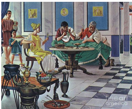
(Slika 1. Bogata rimska obitelj na objedu

Poneki gospodar svojem bi robu omogućio stupanje u poseban oblik bračne zajednice koji se zvao contubernium . To je bila vrsta gospodareve nagrade robu za dobro obavljene posao ili dobro ponašanje. Oba partnera u zajednici morali su biti robovi, a ona se nije smatrala zakonski prihvaćenom, iako jes vremenom poprimile neke značajke pravog rimskog braka odnosno ženidbe ( iustaconnubia ). Tako su upotrebljavali iste pojmove kao i u slučaju prave bračne zajednice: primjerice, supružnici su se nazivali coniuges , mariti ili uxores , a njihova djeca filii i filiae . Međutim, ta djeca zakonski su pripadala isključivo majci ropkinji. 23