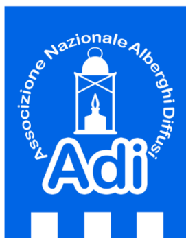
Slika 6: Logo Nacionalnog udruženja difuznih hotela, Italija