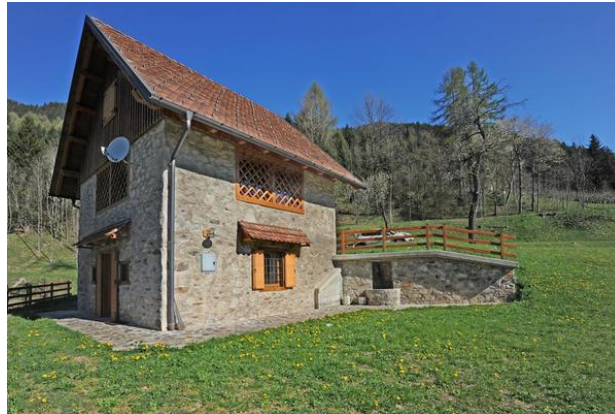
Slika 5: Jedna od smještajnih jedinica difuznog hotela "Comeglians"