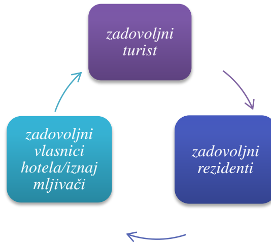
Slika 3: Krug aktivnih sudionika u modelu difuznog hotela