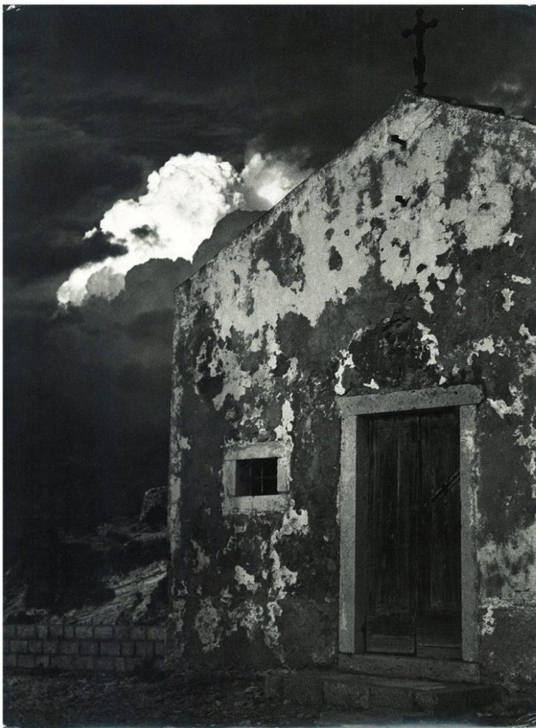
Zvonimir Brkan, Bijeli oblak , 1953. (BRAĆA BRKAN – Fotografije , Zadar 1956., 39)