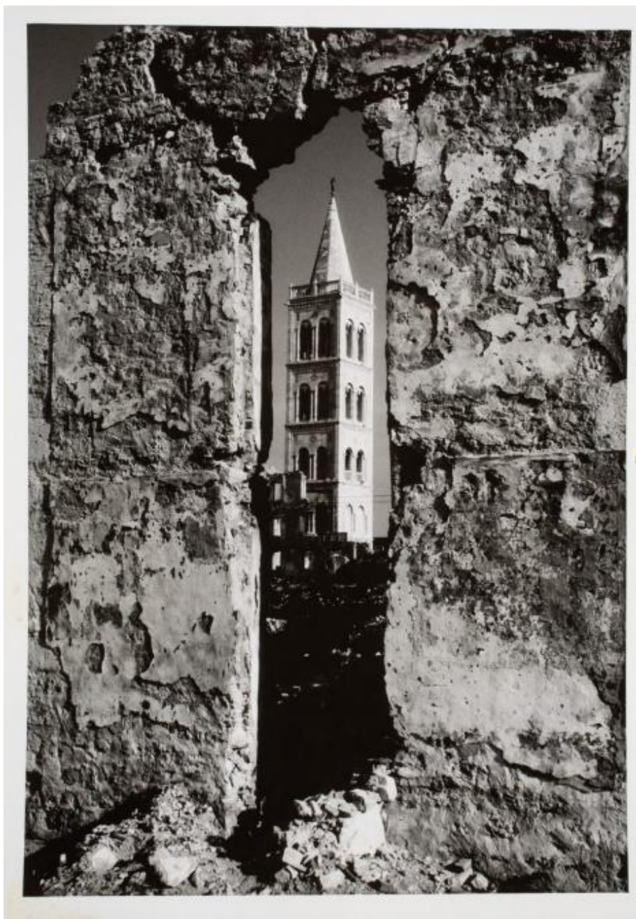
Ante Brkan, Prozor boga Marsa , 1945. (BRAĆA BRKAN – Fotografije, Zadar 1956., 16.)