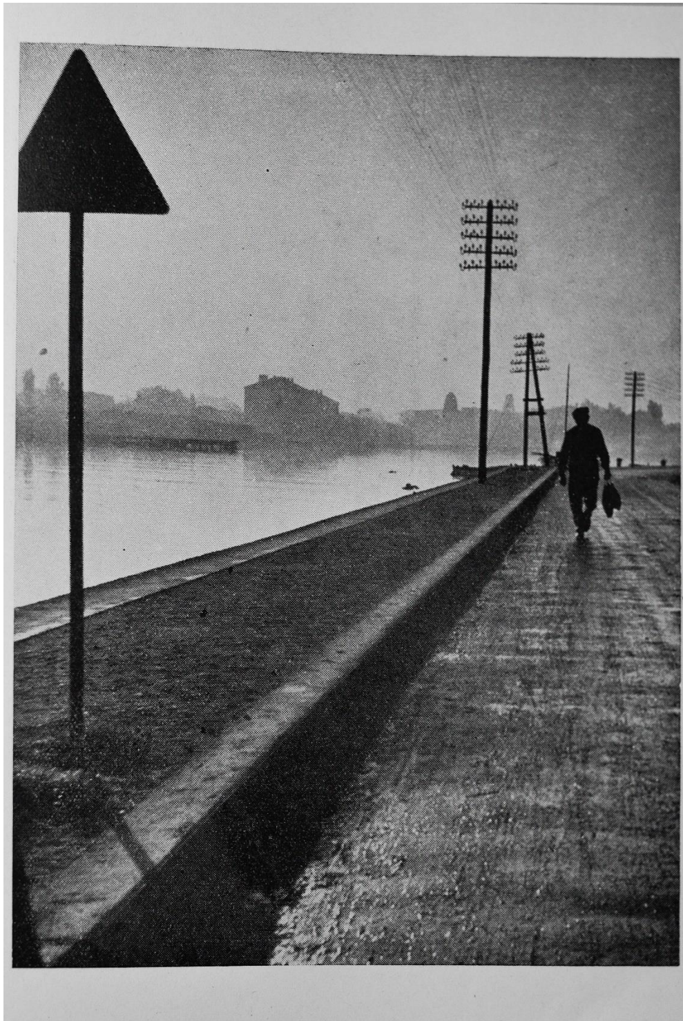
Zvonimir Brkan, Dan se budi, 1954. (BRAĆA BRKAN – Fotografije, Zadar 1956., 19.)