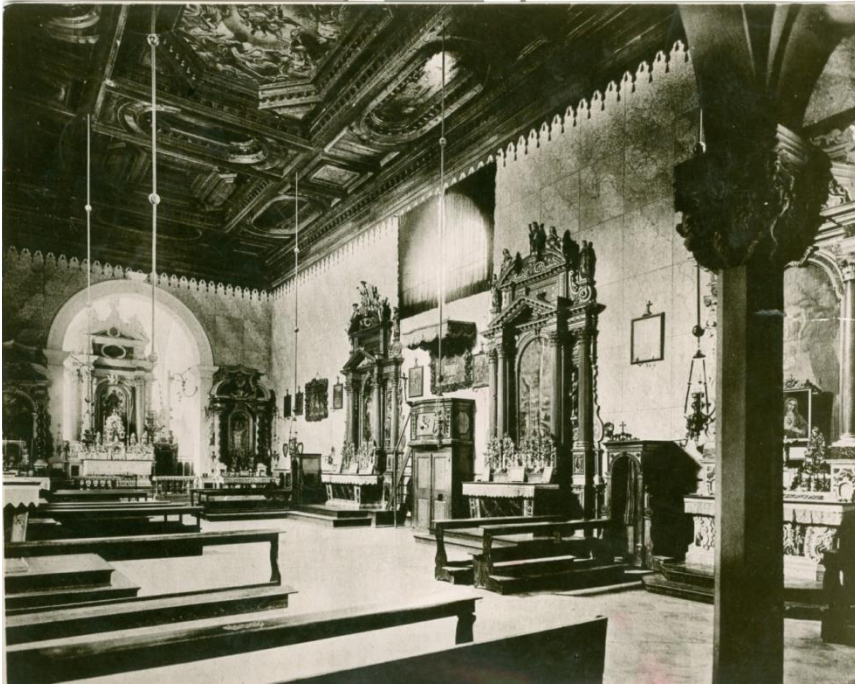
Slika 1. Unutrašnjost crkve sv. Frane u Šibeniku, fotografija stanja u 19. stoljeću