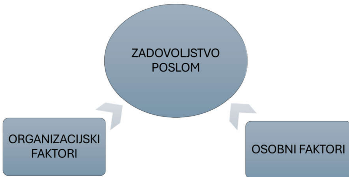
Slika 1. Faktori zadovoljstva poslom

okruženje i uvjete, međuljudske odnose, te stil vođenja. Pored organizacijskih, osobni čimbenici poput osobnosti, očekivanja, dobi, obrazovanja i spola također imaju važnu ulogu u zadovoljstvu poslom.