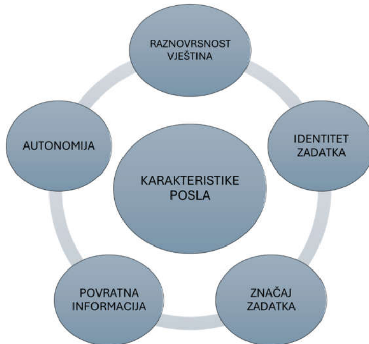
Slika 5. Model karakteristika posla

koliko posao obuhvaća dovršavanje cjelovitog i prepoznatljivog dijela rada. Značaj zadatka definiran je kao utjecaj posla na živote ili rad drugih ljudi. Autonomija se odnosi na slobodu koju posao pruža zaposlenicima u planiranju i odlučivanju o načinima obavljanja posla. Na kraju, povratna informacija opisuje koliko radne aktivnosti omogućuju dobivanje jasnih i izravnih informacija o učinkovitosti obavljenog posla (Hackman i Oldman, 1976).