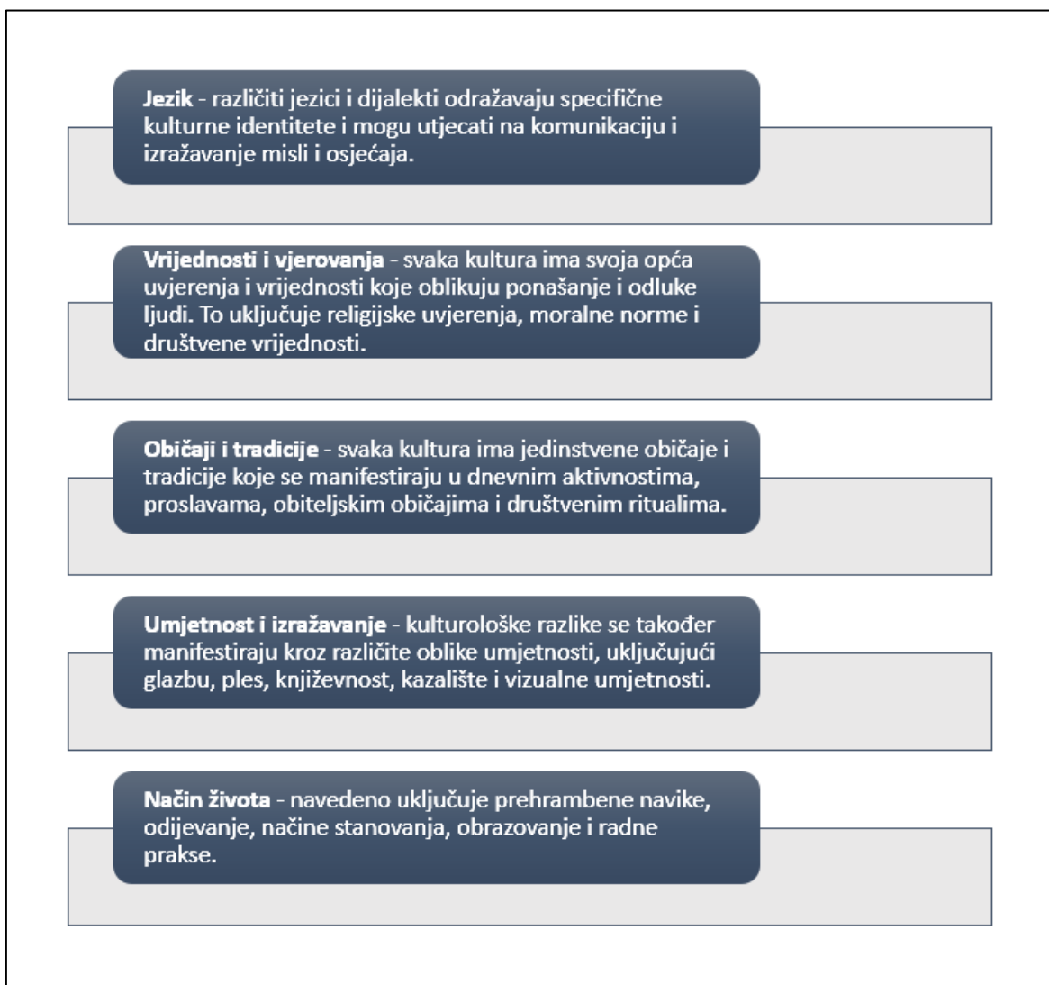
Slika 1. Ključni aspekti kulturoloških razlika