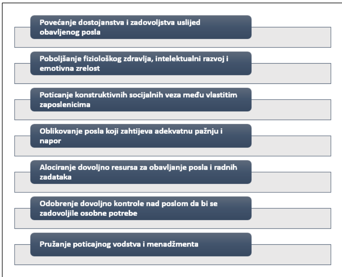
Slika 3. Dimenzije nematerijalnog sustava nagrađivanja