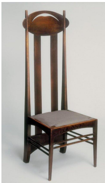
Slika 9. C. R. Mackintosh, Stolica od hrastovog drveta, Viktorija & Albert muzej, 1897. – 1990. (izvor: https://collections.vam.ac.uk/item/O11281/chair-mackintosh-charles-rennie/ , pristup 13.9.2024.)