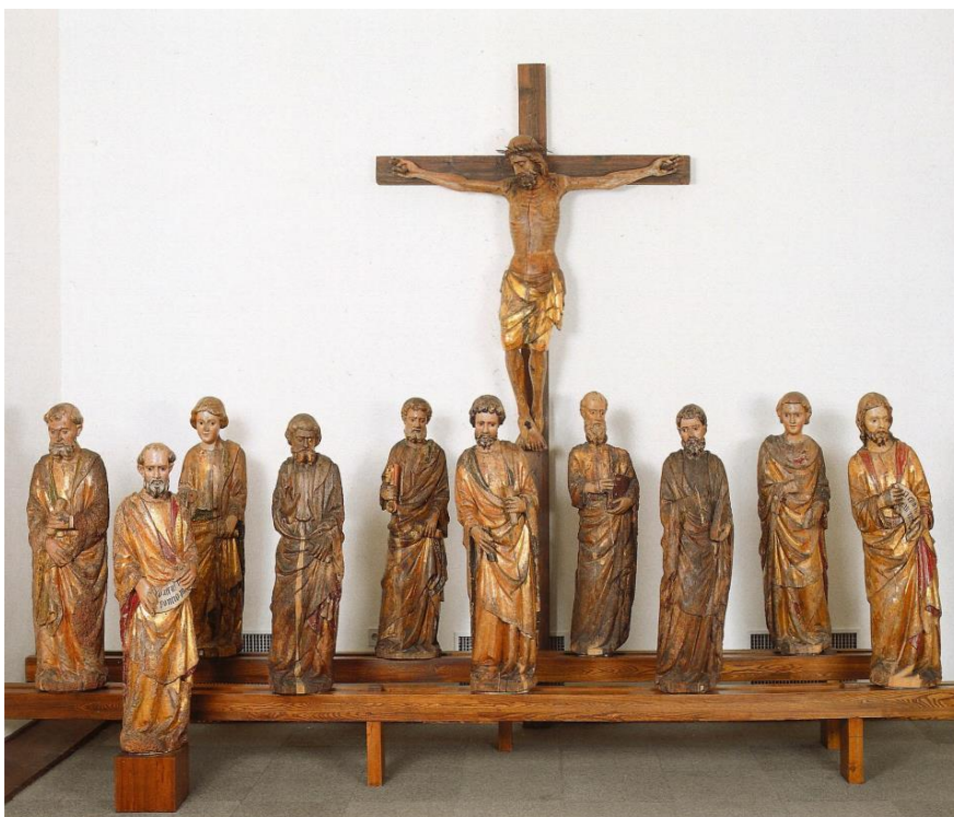
Slika 3. Matej Moronzon i Ivan Petrov iz Milana, Kipovi s letnera zadarske katedrale , SICU, Zadar, 1426. – 1433.