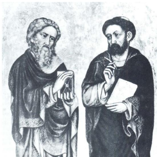
Slika 8. Ivan Petrov iz Milana (?), Dijelovi poliptiha s četvoricom svetaca (dva evanđelista) , Švicarska, privatna zbirka (izvor: I. PRIJATELJ, 1990., 64)