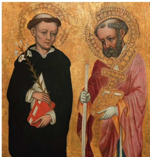
Slika 7. Ivan Petrov iz Milana (?), Dijelovi poliptiha s četvoricom svetaca (sv. Dominik i nepoznati svetac) , Švicarska, privatna zbirka (izvor: KATALOG, 2009., 8 (René Millet, kat. jed. 7))