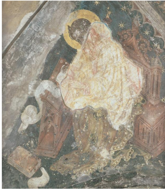
Slika 1. Ivan Petrov iz Milana i Dujam Marinov Vučković, Freske na svodu kapele sv. Dujma u splitskoj katedrali (evanđelist Luka) , katedrala u Splitu, 1429.