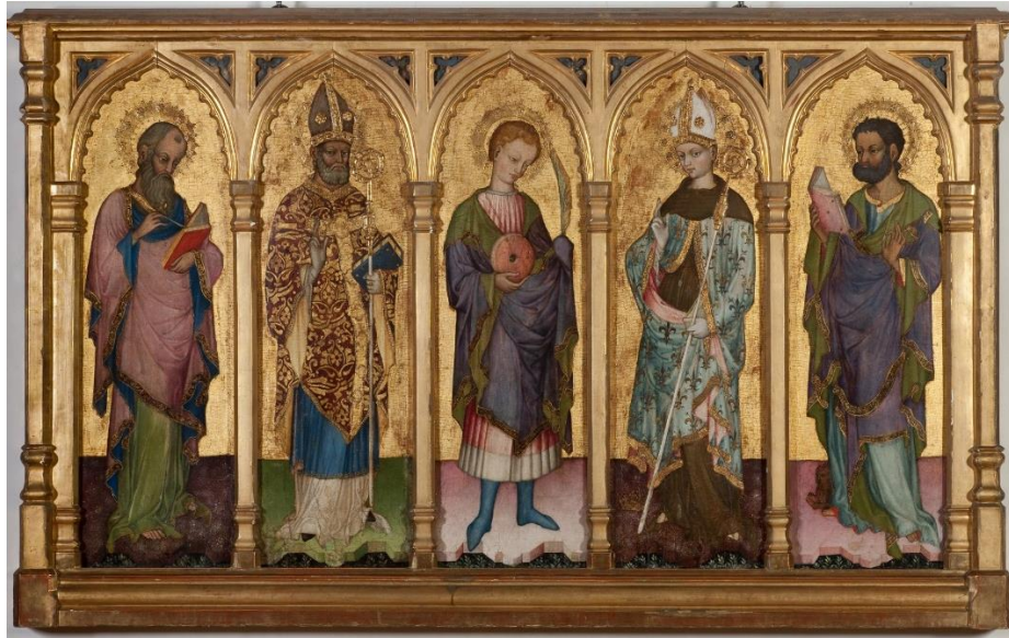
Slika 11. Ivan Petrov iz Milana (?), Sv. Matej evanđelist, Sv. Dujam, Sv. Ludovik Tuluški i Sv. Marko evanđelist , Split (?), 15. stoljeće