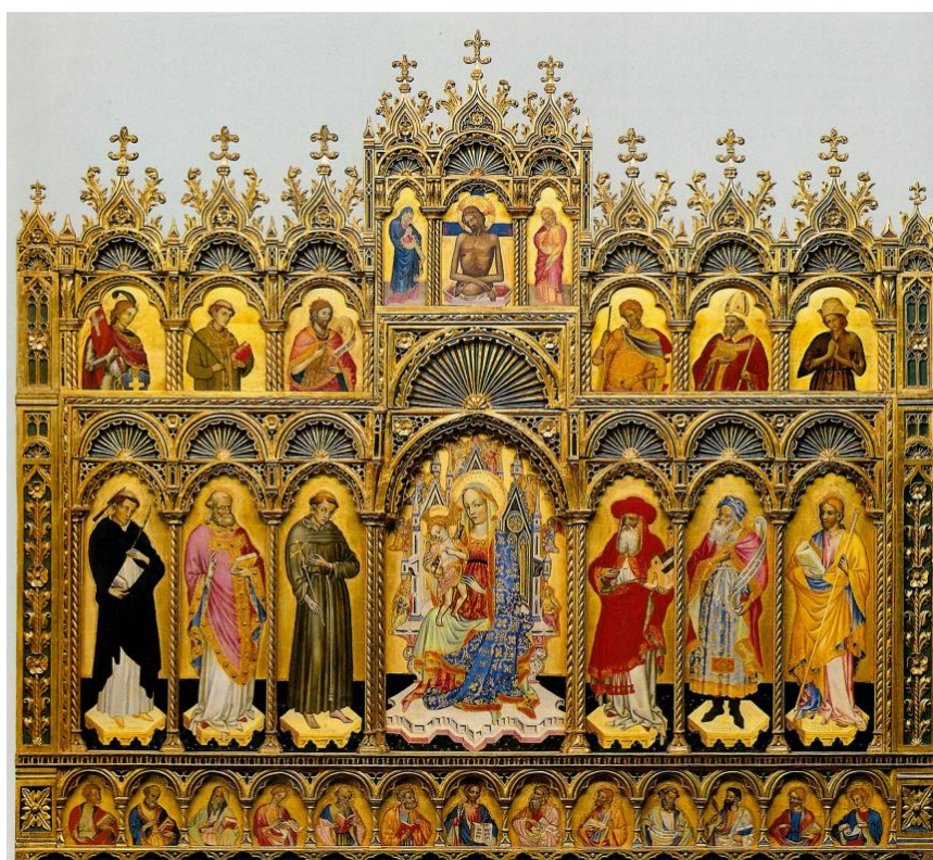
Slika 4. Ivan Petrov iz Milana, Ugljanski poliptih , Riznica samostana sv. Frane, Zadar, druga četvrtina 15. stoljeća (izvor: E. HILJE – R. TOMIĆ, 2006., 170)