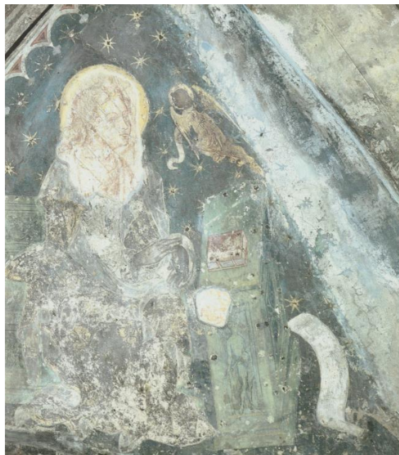
Slika 2. Ivan Petrov iz Milana i Dujam Marinov Vučković, Freske na svodu kapele sv. Dujma u splitskoj katedrali (evanđelist Matej) , katedrala u Splitu, 1429. (izvor: : K. PRIJATELJ – N. GATTIN, Splitska katedrala , 1991., 148-149)