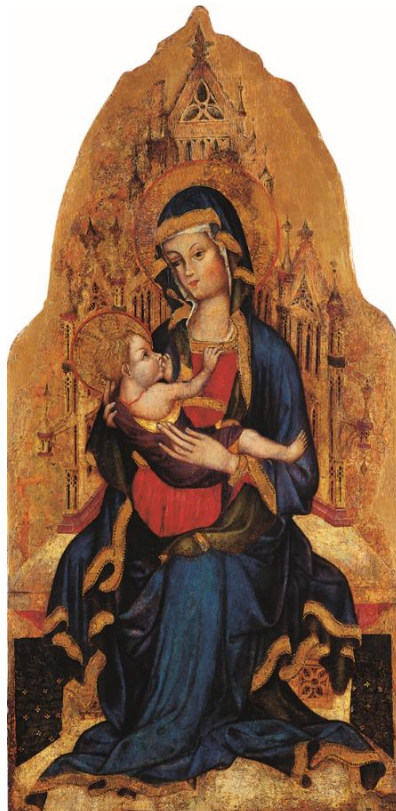
Slika 6. Ivan Petrov iz Milana, Bogorodica koja doji Dijete iz samostana sv. Marije u Zadru , SICU, Zadar, druga četvrtina 15. stoljeća