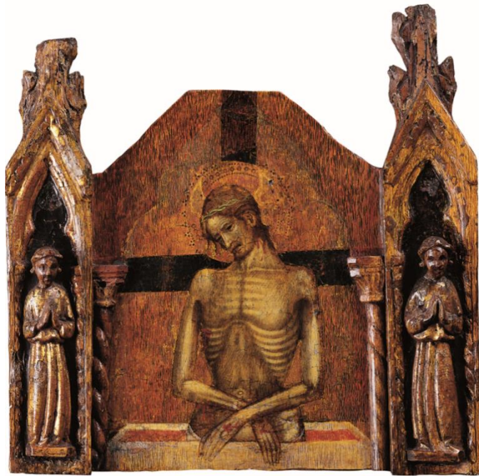
Slika 5. Ivan Petrov iz Milana, „ Imago pietatis “ s poliptiha iz Luke na Dugom otoku, SICU, Zadar, druga četvrtina 15. stoljeća