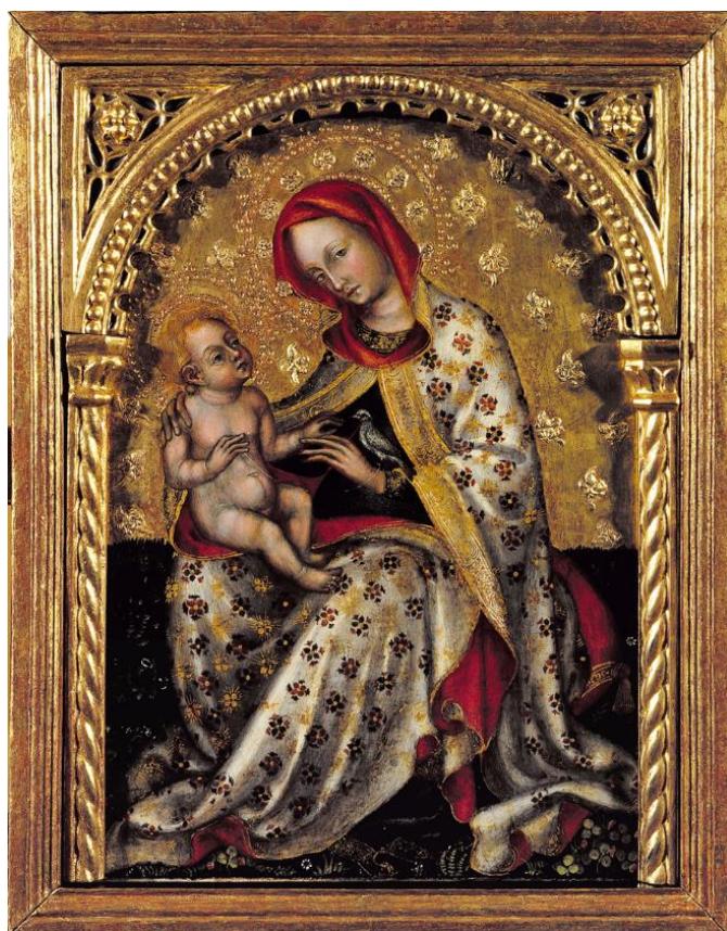
Slika 9. Ivan Petrov iz Milana (?), Bogorodica s Djetetom , dvorac Wawel, Krakov, druga četvrtina 15. stoljeća