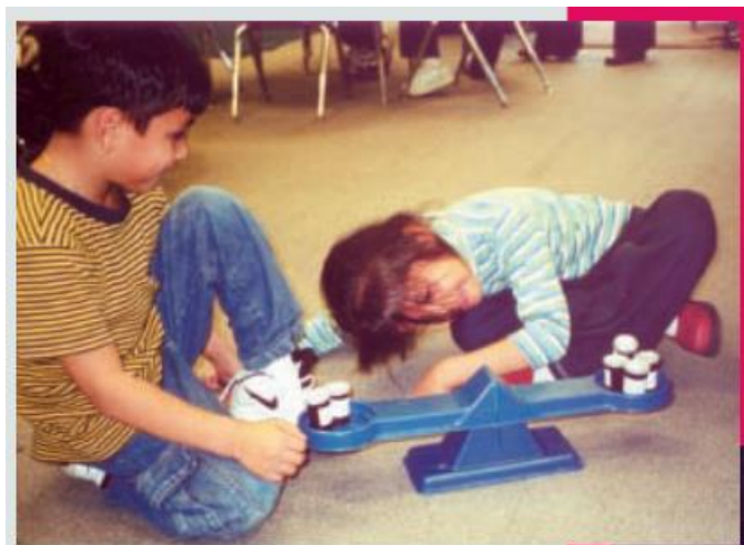
Slika 2 Pan balansne vage