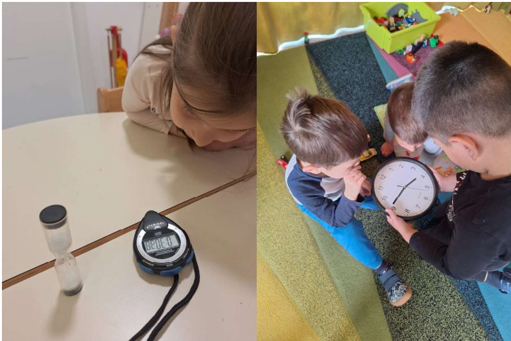
Slika 9. Razumijevanje pojma vremena uz pomoć štoperice, pješčanog sata i zidnog sata

Kao duhovit, ali pronicljiv izvor, možete pogledati isječak "Dave Allen Teaching your Kid Time" na YouTubeu.