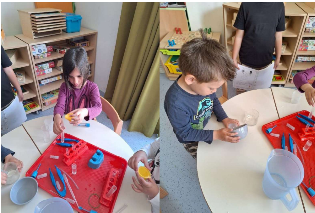
Slika 5. Istraživanje kocepta volumena