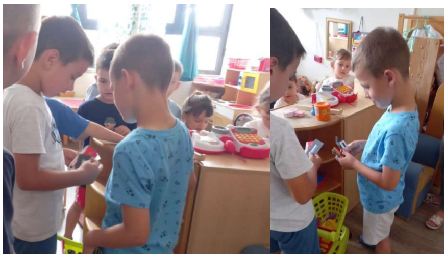
Slika 1. Igra trgovine

Odsutnost aritmetike u igri naglašava činjenicu da matematički koncepti poput brojanja i računanja nisu svojstveni okolini, već su prije društvene norme koji zahtijevaju namjerno učenje i vodstvo od obrazovanih odraslih i vršnjaka. Kao takva, strukturirana intervencija odraslih postaje ključna u poticanju matematičkog razvoja kod mladih učenika. Međutim, ova intervencija ne bi trebala podrazumijevati prerano uvođenje formalne aritmetike kroz suhoparne radne listove ili radne bilježnice, jer to može dovesti do negativnih stavova prema matematici.