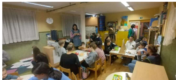
Slika 3. Suradnja roditelja i djece na radionicama

Nadalje, aktivnosti suradnje s odraslima djeci nude vrijedna iskustva učenja. Sudjelujući u stvarnim životnim zadacima s odraslima, poput kuhanja ili kupovine, djeca se uključuju u praktične primjene matematičkih pojmova poput mjerenja, količine i vremena. Ova autentična iskustva ne samo da potiču razumijevanje matematike, već također pokazuju važnost matematike u svakodnevnom kontekstu.