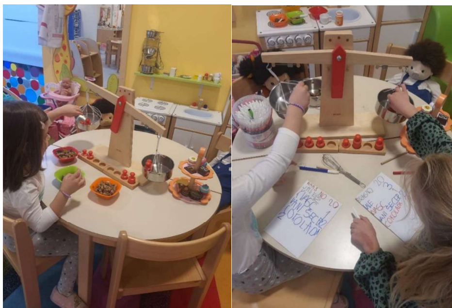
Slika 7. Razumijevanje težine uz pomoć vage

Njihovo razumijevanje težine često je relativno u odnosu na njih same, uzimajući u obzir faktore poput toga mogu li lako podići neki predmet. Međutim, i dalje ih može zvesti veličina predmeta, pod pretpostavkom da svi veliki predmeti moraju biti teški. Također mogu imati pogrešne predodžbe o plovnosti, misleći da svi laki predmeti lebde, a teški tonu. Iako mogu početi koristiti grednu vagu za usporedbu utega, možda još ne razumiju da će teži predmeti uzrokovati pad te strane vage, zahtijevajući dovoljno prilika za istraživanje i otkrivanje.