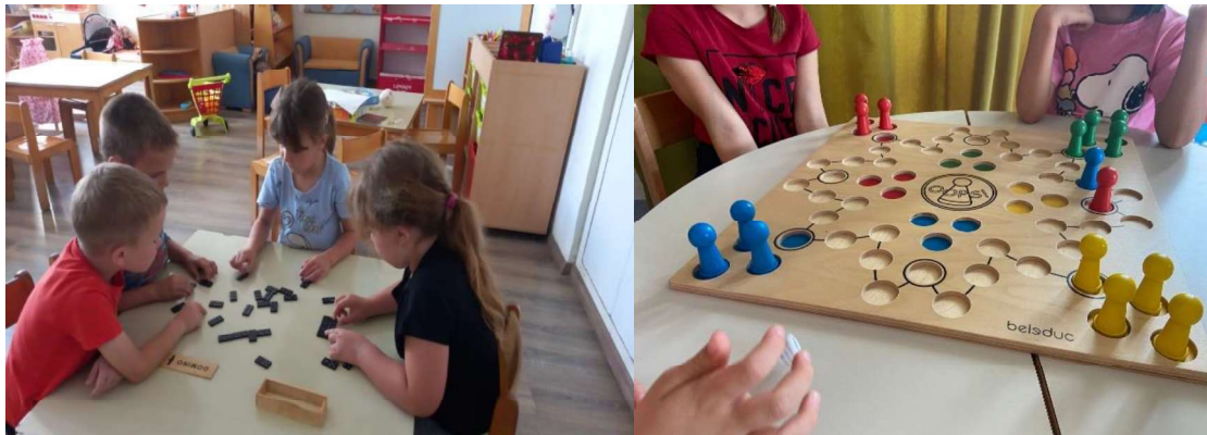
Slika 2. Tradicionalne igre

brojanje polja na ploči za igru, naglašavajući važnost usmjeravanja odraslih i rasprave tijekom igranja.