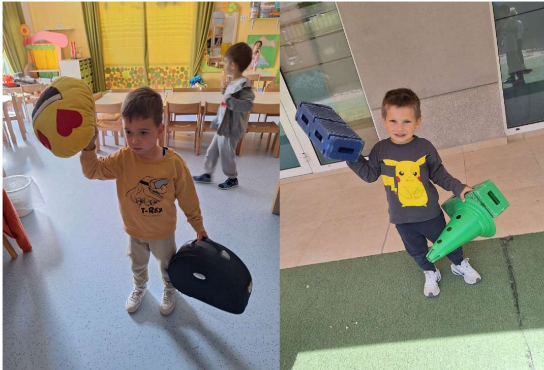
Slika 4. Djeca mjere i uspoređuju

Kada je riječ o mjerenju duljine, djeca također uzimaju u obzir čimbenike poput udaljenosti, širine, visine i dubine, od kojih svaki uvodi svoj skup složenosti i jezika. Do dobi od četiri godine djeca će možda moći usporediti dvije jednake površine i složiti se da su iste veličine, osobito ako mogu vizualno postaviti jednu preko druge. Međutim, kada je riječ o podjeli volumena, kao što je rezanje torte za lutke, one se mogu boriti da naprave jednake dijelove, što rezultira nejednakim dijelovima.