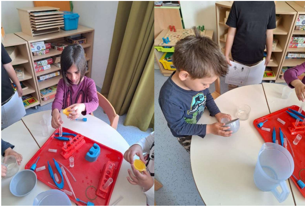
Slika 5. Istraživanje kocepta volumena