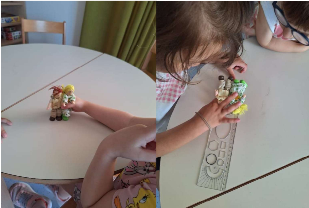
Slika 8. Mjerenje visine lutke na ravnanu u svrhu razvoja tranzitivnosti

Ako je duljina prve lutke 20 cm na ravnanu, a duljina druge lutke 20 cm na ravnanu, tada je duljina prve lutke jednaka duljini druge lutke.