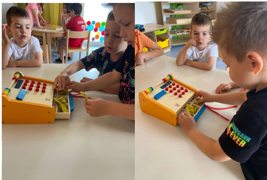
Slika 11. Upoznavanje s pojmom novca

Povijesno, istraživanje dječjeg razumijevanja novca bilo je usmjereno na njihovu sposobnost prepoznavanja i korištenja valute. Na primjer, rane studije pokazale su da su djeca do treće godine mogla identificirati novac i razumjeti njegovu svrhu plaćanja, ali im je nedostajala svijest o konceptima poput razmjene i vrijednosti. Do četvrte godine neka su djeca prepoznala da različite stvari koštaju različite iznose, a do šeste su godine razumjela koncept davanja sitniša. Međutim, s obzirom na prevalenciju debitnih i kreditnih kartica danas, znanje i iskustvo djece s novcem može se razlikovati. Osim toga, obrazovanje o novcu postalo je složenije, uključujući financijske koncepte kao što su zarađivanje, trošenje, dijeljenje, posuđivanje i štednja, a sve se to može istražiti kroz aktivnosti igranja uloga. Razumijevanje društvenog konteksta koji okružuje novac ključno je za djecu jer uče o utjecajima i vrijednostima povezanim s njim. Međutim, postoje značajne varijacije u dječjoj izloženosti raspravama o novcu kod kuće, pa čak i kada roditelji razgovaraju o novcu kao robi, možda neće zadubiti u njegova numerička svojstva ili vrijednost.