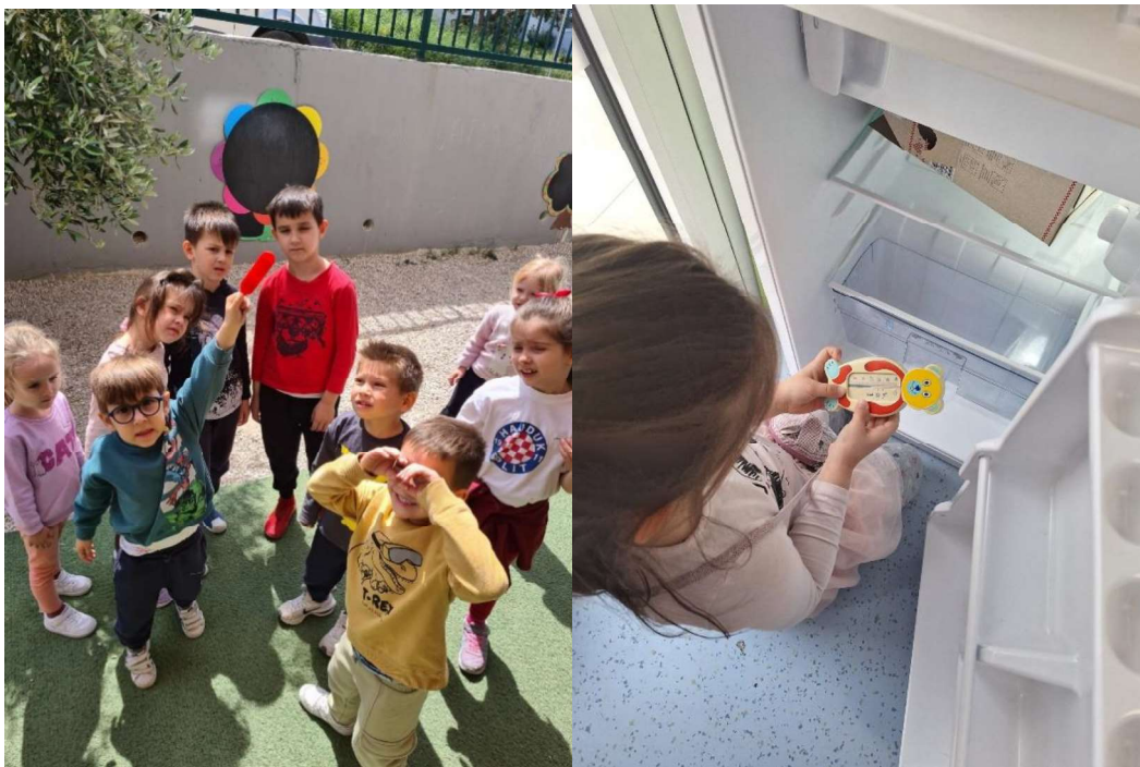
Slika 10. Mjerenje temperature

Od malih nogu djeca počinju razvijati razumijevanje temperature kroz različita svakodnevna iskustva. Na primjer, uče mjeriti temperaturu vode za kupanje, odabiru odgovarajuću odjeću na temelju vremenskih prilika i prepoznaju kada im je vruće ili hladno nakon fizičkih aktivnosti. U početku, djeca imaju tendenciju opisivati temperaturu koristeći izravne usporedbe, kao što je opipavanje predmeta kako bi procijenili jesu li topli ili hladni. Međutim, da bi shvatili temperaturu kao kontinuirano mjerenje, djeca trebaju biti izložena nizu temperaturnih iskustava. Nažalost, ograničena iskustva, gdje su objekti jednostavno označeni kao "vrući" ili "hladni", mogu spriječiti ovaj razvoj.