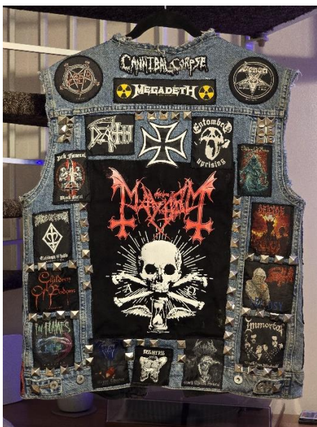
Slika 3. Traper prsluk s prišvicima