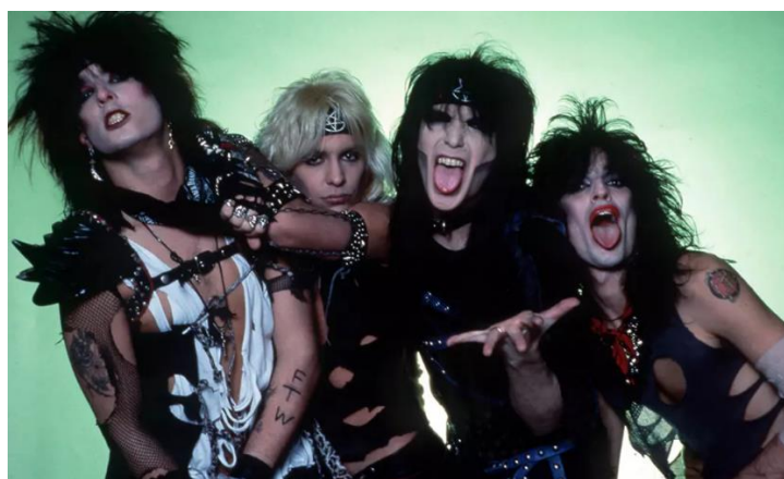
Slika 11. Glam metal bend Mötley Crüe (Preuzeto 29.7.2024. sa https://www.cityliveglasgow.com/journalism/2024/5/28/the-best-dressed-glam-metal-bands-of-all-time )