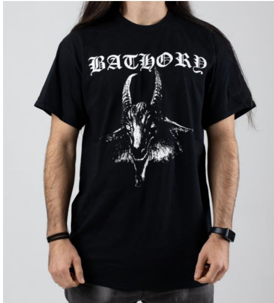
Slika 10. Majica s logotipom benda Bathory- Bafomet (Preuzeto 29.7.2024. sa https://www.impericon.com/products/bathory-goat-t-shirt )