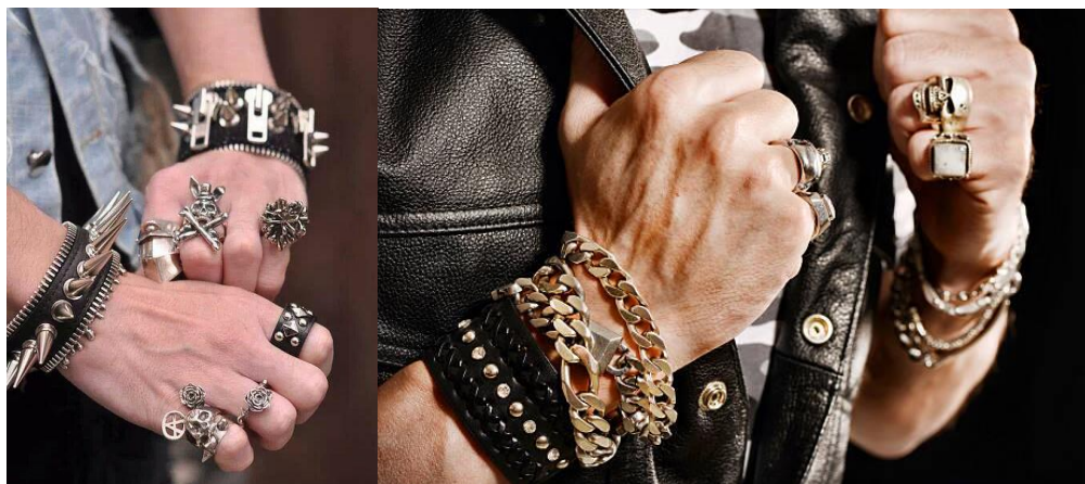
Slika 4. i Slika 5. Primjer nakita (Preuzeto 17.7.2024. sa https://x.com/wealtrnative i 18.17.2024. sa https://www.gettyimages.com/search/2/image?alloweduse=availableforalluses&family=creative&phrase=rock%20jewelry&sort=mostpopular )