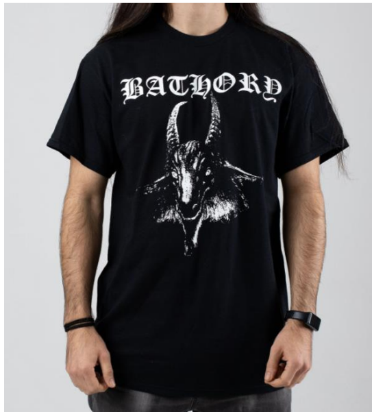
Slika 10. Majica s logotipom benda Bathory- Bafomet