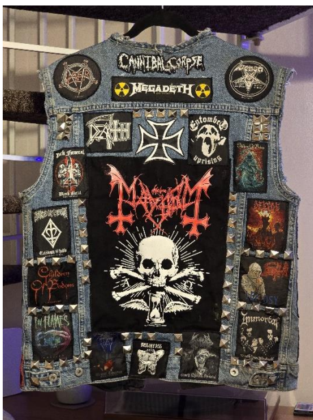
Slika 3. Traper prsluk s prišvicima