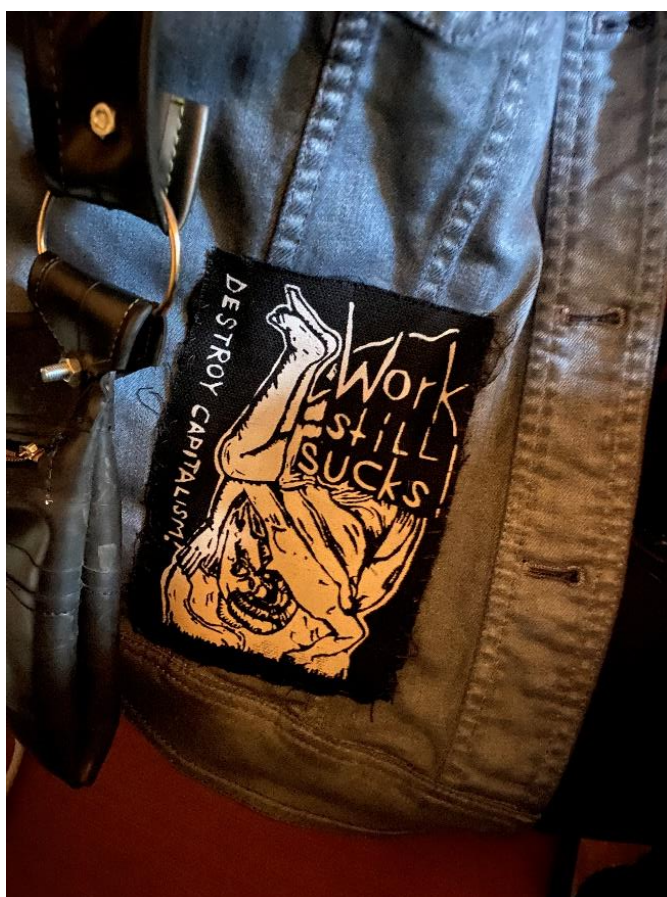
Slika 9. Prišivak " Destroy capitalism! Work still sucks! "

Nešto što se jako često spominjalo među sudionicima kada smo razgovarali o njihovom stilskom izričaju ili onom koji primjećuju kod drugih aktera scene, vezano je uz prišivke. Sami prišivci su vrlo česti u punk supkulturi i jedan su od najboljih primjera udruživanja stilskog izričaja i DIY kulture, pogotovo kada akteri izrađuju prišivke za sebe ili druge.