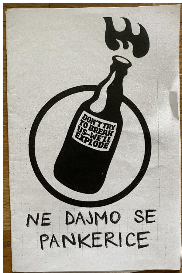
Slika 4. Pamflet sudionice istraživanja, pod nazivom "Ne dajmo se pankerice"

Govoreći o razlikama u odnosu muškaraca i žena u različitim grupama unutar punk scene, Sheila ističe kako na strani nekih desnih grupa unutar punk supkulture rjeđe vidi žene: "Mislim da je puno veća koncentracija muškaraca u tom svijetu, dok onak' na toj ljevičarskoj strani, nazovimo, punka, je dosta izjednačeno" (Sheila). Patrik zaključuje nešto slično i napominje: "Ako vidiš ekipu skinsa ili punkera, ako vidiš cure s njima većinom su onda ok. Al' ak vidiš ekipu da nema ni jedne cure, onda je onak' ... onda će se vjerojatno potuć' zbog cigare" (Patrik). Objašnjavajući nadalje svoje iskustvo odnosa između muškaraca i žena na sceni, Patrik napominje da je taj odnos uvijek bio zanimljiv, ali jako dobar: "[...] cure i dečki su tu fakat isti, znači zajedno cugamo, cure se isto ponašaju tak', dečki se ponašaju nekak', znaš ono, najnormalnije, kužiš. Svi su, čini mi se, jednaki, nema neke granice ono cura – dečko da bi sad neko maltretirao curu, ali je velika tolerancija" (Patrik). Nadalje, opisujući na što misli pod tim dobrim odnosom, daje primjer odnosa s nekim prijateljicama iz srednje škole: "Da sam se ja