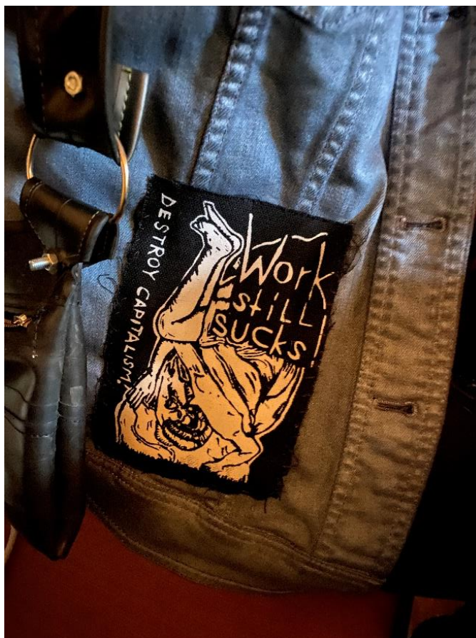
Slika 9. Prišivak "Destroy capitalism! Work still sucks!"

Nešto što se jako često spominjalo među sudionicima kada smo razgovarali o njihovom stilskom izričaju ili onom koji primjećuju kod drugih aktera scene, vezano je uz prišivke. Sami prišivci su vrlo česti u punk supkulturi i jedan su od najboljih primjera udruživanja stilskog izričaja i DIY kulture, pogotovo kada akteri izrađuju prišivke za sebe ili druge.