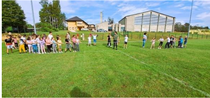
Slika 3. Elementarna igra „ potezanje konopa“