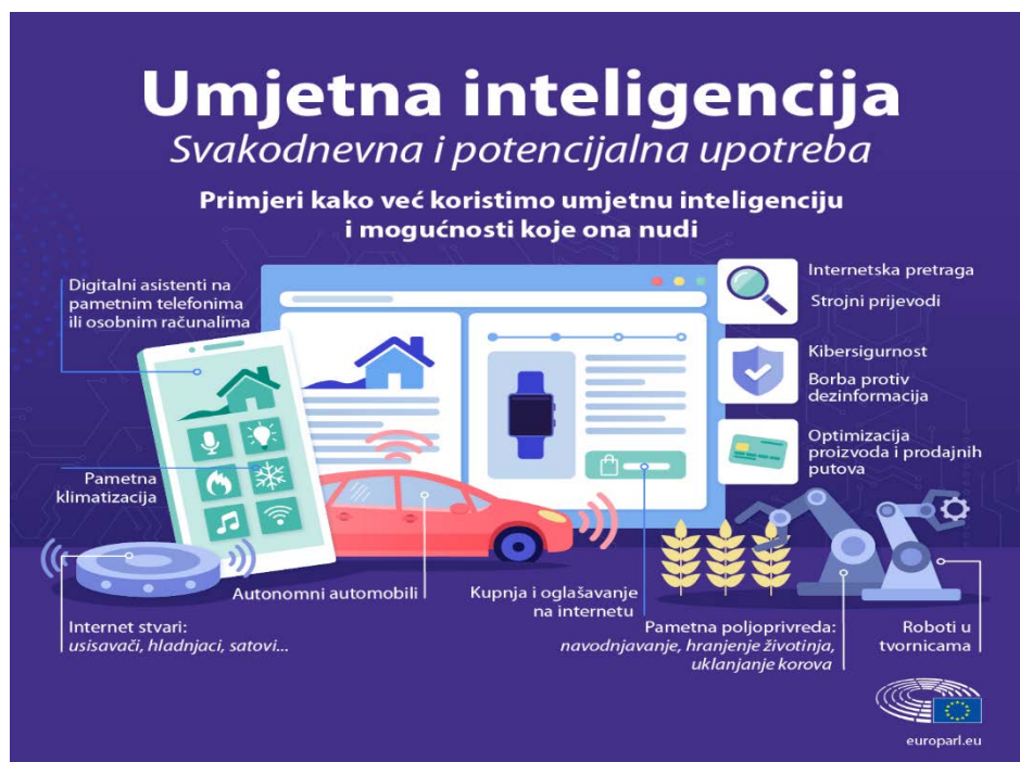
Slika 1. Umjetna inteligencija: svakodnevna i potencijalna upotreba

Umjetna inteligencija sve je prisutnija u poslovnom svijetu i u svakodnevnom životu. Od mnogobrojnih definicija umjetne inteligencije najprihvaćenija je McChartyjeva (2004) koji je definira kao znanost i istraživanje s namjerom izrade inteligentnih strojeva, posebice inteligentnih računalnih programa. Prema Prister (2019), umjetna inteligencija je grana računalne znanosti koja je usmjerena na razvoj sposobnosti računala sa ciljem izvršavanja određenih zadataka koji zahtijevaju neku vrstu inteligencije. To podrazumijeva sposobnost učenja novih koncepata, snalaženje u novim situacijama, razumijevanje prirodnog jezika, donošenje zaključaka, prepoznavanje slika. Slika br. 1 prikazuje svakodnevnu i potencijalnu upotrebu umjetne inteligencije.