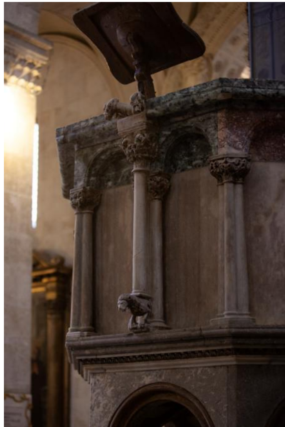
Slika 43. Parapet propovjedaonice katedrale Sv. Lovre u Trogiru