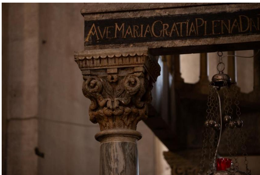
Slika 54. Kapitel ciborija katedrale Sv. Lovre u Trogiru