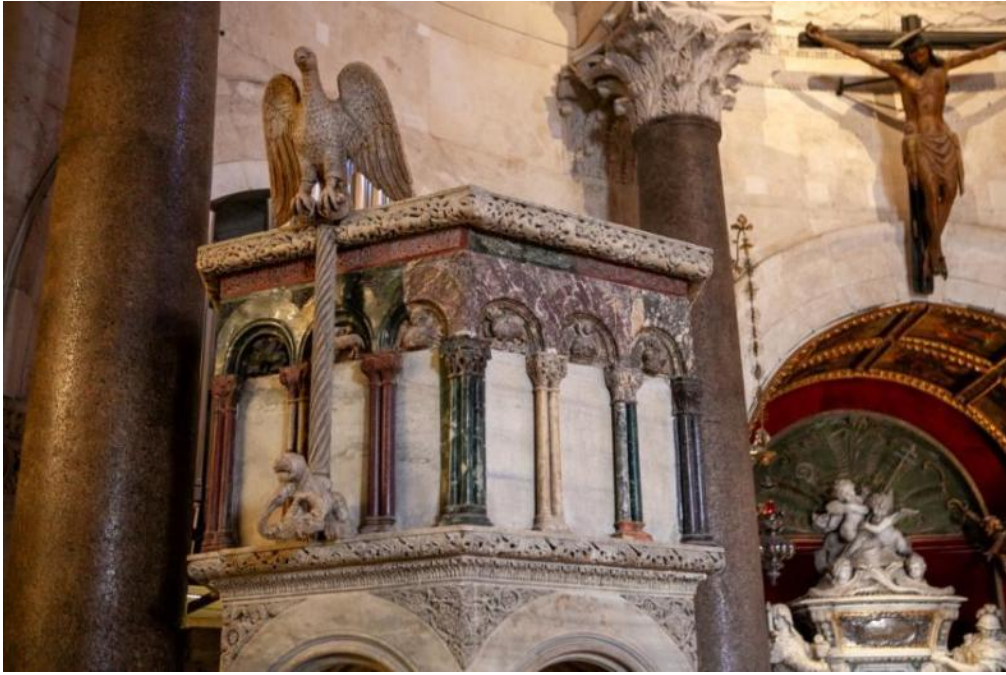
Slika 17. Parapet propovjedaonice katedrale Sv. Dujma u Splitu