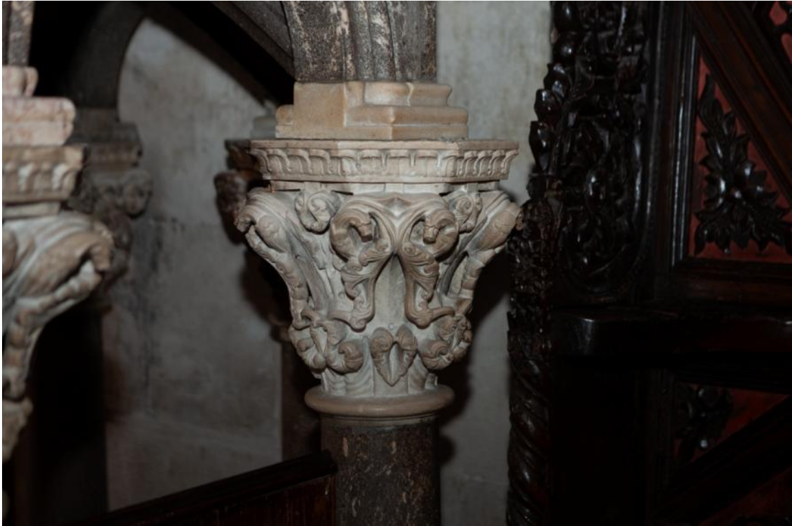
Slika 37. Kapitel propovjedaonice katedrale Sv. Lovre u Trogiru