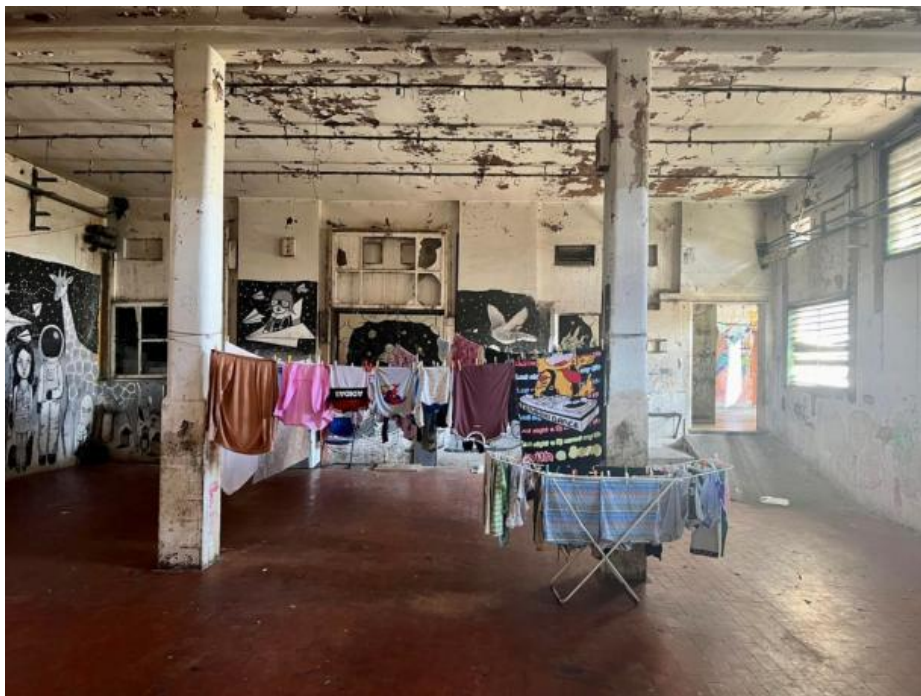
Slikovni prilog 4. Fotografija unutrašnjosti naseljenog Muzeja.

Kontrast sumornom ozračju prekinut je pogledom na masivna željezna vrata ukrašena raznobojnim poštanskim sandučićima s imenima i prezimenima njihovih vlasnika, stanovnika Metropoliza . Već na samom ulazu, s osmijehom su nas dočekali neki od stanara te Giorgio de Finis, antropolog, filmaš, autor znanstvenih radova, intelektualac i kreator MAAM -a. 4 Nakon kratkog razgovora, Giorgio nas je uveo u prostor Metropoliza . Pred nama se otvorio nevjerojatan prostor koji uistinu funkcionira kao onaj gradski s vlastitom toponimijom. Primjerice, Plaza Peru označava dio Metropoliza u kojem stanuju isključivo Peruanci, a među njima i obitelj koja nam je kuhala gotovo svaki dan. Plaza Peru označena je monumentalnom željeznom instalacijom čija se tri kraka spajaju u središnjoj točki, dok završavaju masivnim kuglama punog volumena. Ulaz u Museo dell'Altro e dell'Altrove di Metropoliz nalazi se u blok-zgradi istaknutoj krovnom natpisom FART . Od tamo se širi mreža hodnika, dvorišta, soba s umjetničkim djelima koja supostoje s netaknutim tvorničkim strojevima za obradu mesnih prerađevina. U središtu