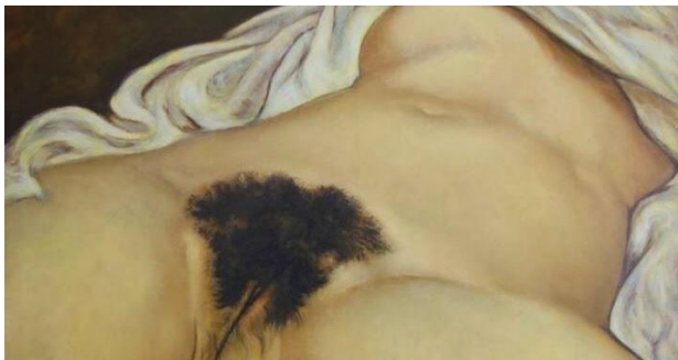
[Il.3] G. Courbet, Podrijetlo svijeta, 1866., Musee Courbet, Ornans. ( http://www.musees-franche-comte.com )