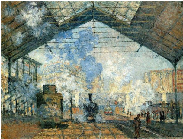
[Il.1] C. Monet, Unutrašnjost željezničke stanice Saint Lazare, 1877., Musee d' Orsay, Pariz ( http://www.musee-orsay.fr )