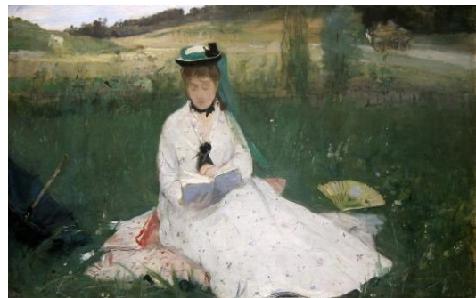
[Il.4] Berthe Morisot, Reading, 1873. The Cleveland Museum of Art ( http://www.clevelandart.org )