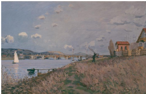
[Il.11] A. Sisley, Le Pont d' Argenteuil, 1872. Memphis Brooks Museum of Art, Memphis ( http://www.brooksmuseum.org )