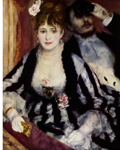
[Il.6] P.A. Renoir, La Loge, 1874. Courtauld Gallery, London ( http://courtauld.ac.uk )