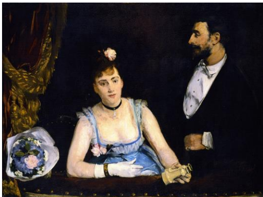
[Il.7] Eva Gonzales, A Loge at the Théâtre des Italiens, 1874., Musée d'Orsay, Paris ( http://www.musee-orsay.fr )