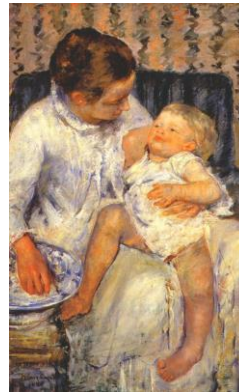
[Il.8] Mary Cassat, Majka koja se sprema oprati svoje pospano dijete, 1880. Country Museum of Art, Los Angeles ( http://www.lacma.org )