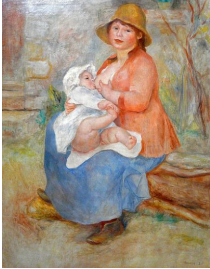
[Il.9] P.A.Renoir, Majčinstvo, 1885. Musee d' Orsay, Pariz ( http://www.musee-orsay.fr )