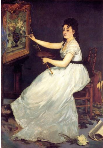
[Il.5] E. Manet, Portret Eve Gonzales, National Gallery, London ( https://www.nationalgallery.org.uk )