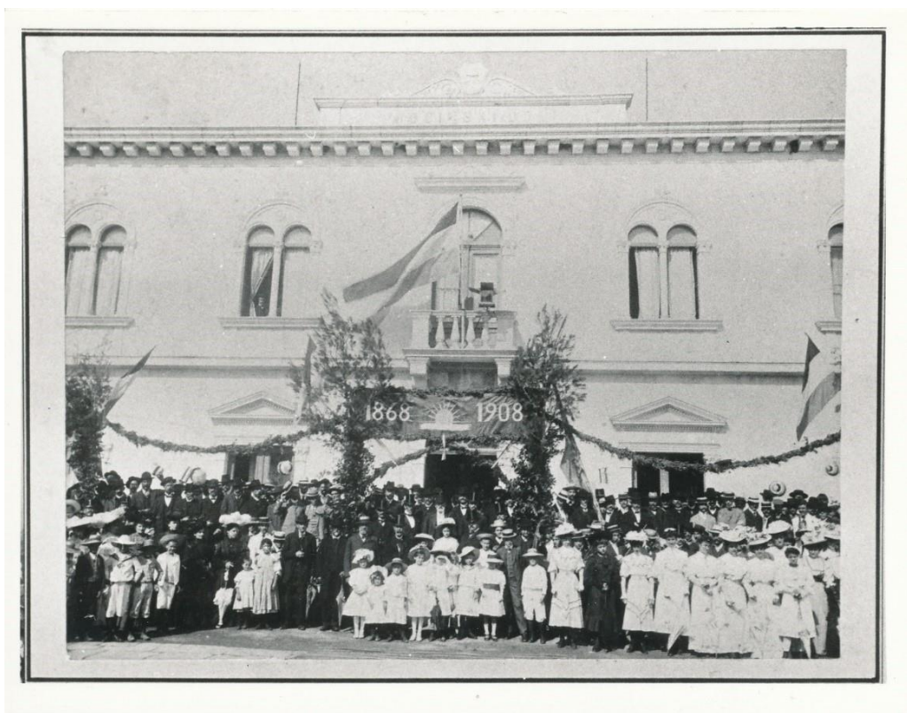
Slika 6. Zajednička fotografija s proslave četrdesete obljetnice osnivanja čitaonice, 1908.