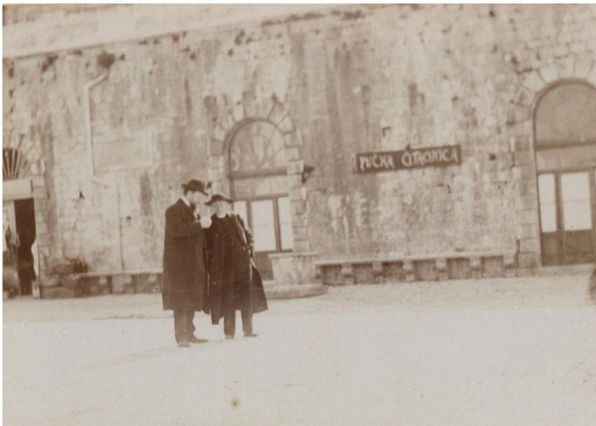
Slika 1. Prva javna čitaonica u gradu Hvaru na glavnom trgu (Pjaci), oko 1907.