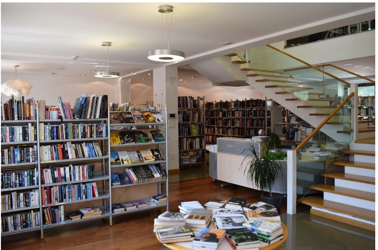
Slika 9. Knjižnica u novom prostoru.