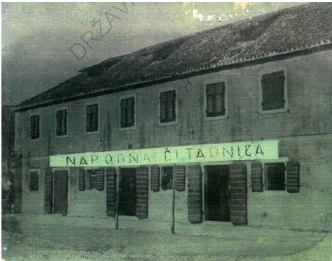
Slika 3. Prvo sjedište narodne čitaonice na Pjaci u Jelsi, danas Trg narodnog preporoda, fotografija s kraja 19. stoljeća.