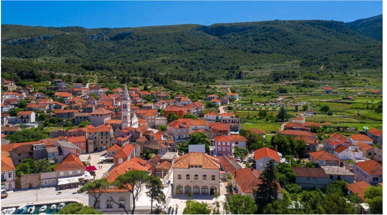
Slika 10. Pogled na središte Jelse sa zgradom knjižnice u prvom planu, ožujak 2024.