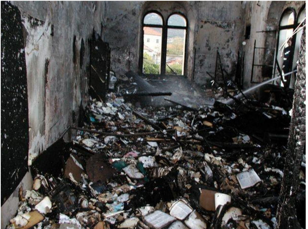
Slika 8. Uništena knjižnica nakon požara 10. studenog 2003. godine.