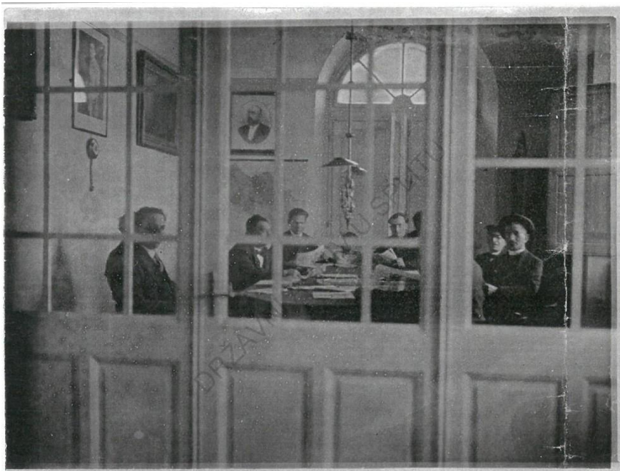
Slika 5. Čitaonica smještena u Općinskom domu u Jelsi.