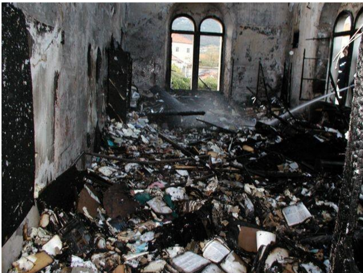
Slika 8. Uništena knjižnica nakon požara 10. studenog 2003. godine.