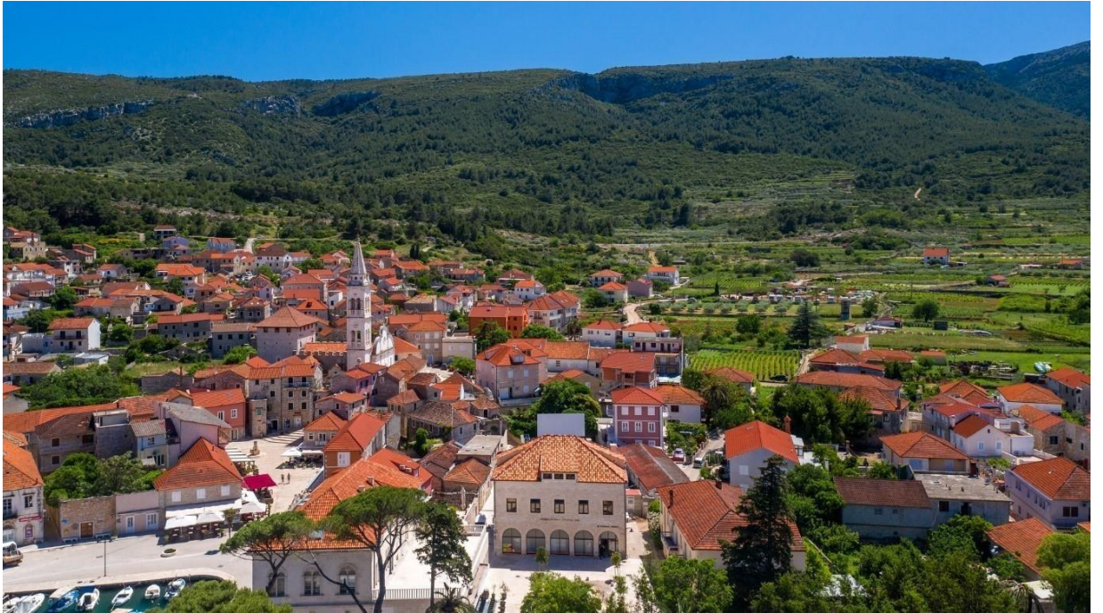
Slika 10. Pogled na središte Jelse sa zgradom knjižnice u prvom planu, ožujak 2024.