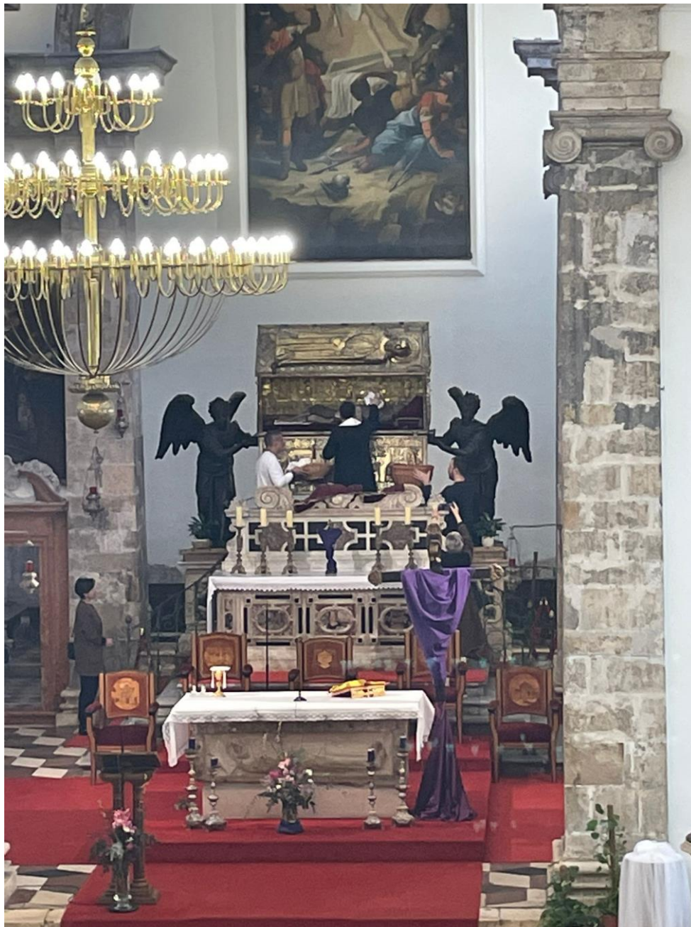
Prilog 12. Posvećivanje Pamuka sv. Šime.