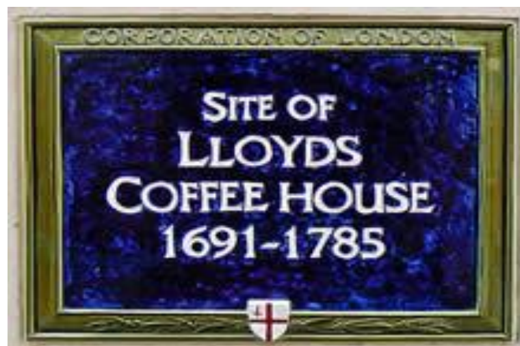
Slika 3. Lloyds Coffee House

Nadalje, tijekom 17. i 18. stoljeća engleske trgovačke brodove više su puta otele ili uništile mornarice Francuske, Španjolske ili Sjedinjenih Američkih Država. Tako je primjerice tijekom Američkog rata za neovisnost pedeset i pet teško natovarenih engleskih trgovačkih brodova oteto kod rta St. Vincent zajedno s teretom. Bio je to težak udarac britanskoj trgovačkoj floti. [5] Većinu gubitka brodovlasnika nisu pokrili privatni pomorski osiguratelji koji su poslovali na području Lloyd's Coffee Housea , koji nisu niti mogli, niti htjeli, preuzeti takve potencijalno katastrofalne rizike. [4, 5]