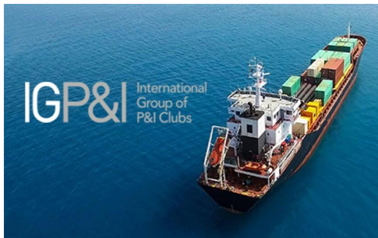
Slika 4. International Group of P&I Clubs

Svaki od devetnaest P&I klubova u grupi neovisna je, neprofitna udruga za uzajamno osiguranje, odnosno klub, koja pruža pokriće svojim članovima, u odnosu na odgovornost njihovih tvrtki. Svaki klub kontroliraju njegovi članovi preko Upravnog odbora (u nastavku: odbor) koji je odabralo članstvo. Odbor zadržava odgovornost u odnosu na pitanja vezana za strategiju i politike, ali delegira svakodnevno upravljanje P&I klubom rukovoditeljima s punim radnim vremenom. P&I klubovi, članovi međunarodne grupe P&I kluba, zajedno osiguravaju više od 90 % svjetske tonaže robe u međunarodnom prometu. [6]