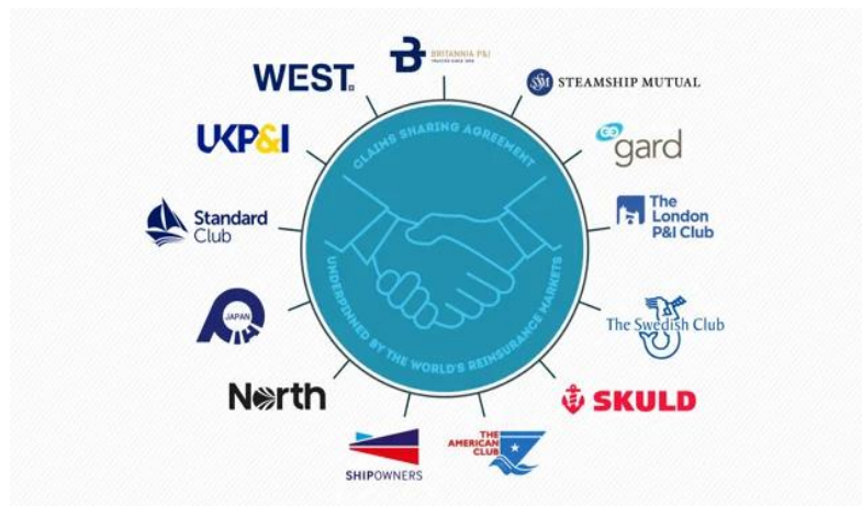
Slika 6. P&I clubs worldwide

Upravljanje unutar Međunarodne grupe P&I klubova odvija se putem strukturiranih odbora, radnih grupa i koordinacijskih tijela koji se bave različitim aspektima rada P&I klubova. Ovi organi omogućuju efikasnu komunikaciju, donošenje odluka i implementaciju strategija usmjerenih na zaštitu interesa članova i poboljšanje usluga koje pružaju. [12]