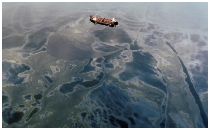
Slika 2. Exxon Valdez oil spill