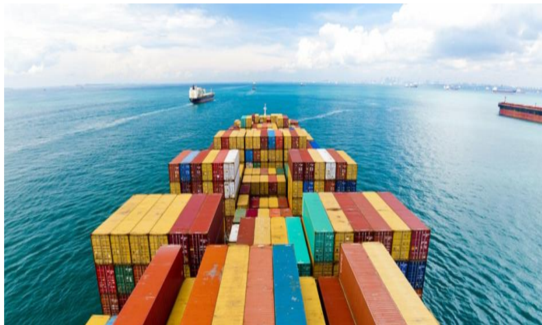
Slika 10. Container ship

U zaključku, nastup osiguranog slučaja i isplata osigurnine kod P&I kluba ključni su elementi za osiguranike u pomorskoj industriji. Kroz njih, osiguranici dobivaju zaštitu od financijskih gubitaka i olakšanje u slučaju neočekivanih događaja ili šteta. Stoga je važno razumjeti ovaj proces i imati povjerenja u podršku koju pružaju P&I klubovi kako bi se osigurala sigurnost i stabilnost u poslovanju broдача i pomorskih operatera.