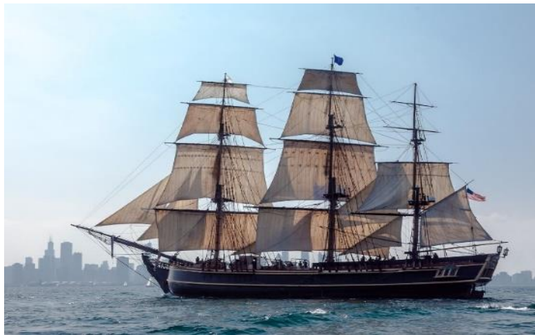
Slika 5. Bounty merchant ship

Ukratko, povijest nastanka P&I klubova obuhvaća razvoj ovih organizacija od 19. stoljeća do danas, kada su postali ključni “igrači” u osiguranju pomorskih brodova i pružanju pravne podrške njihovim članovima. Od svojih skromnih početaka kao zajednice brodovlasnika koji su se udružili radi zajedničke zaštite od financijskih gubitaka, P&I klubovi su evoluirali u profesionalne organizacije s kompleksnim operacijama i globalnim utjecajem. Njihova povijest svjedoči o kontinuiranom prilagođavanju pomorske industrije potrebama svojih članova te njihovoj ključnoj ulozi u osiguranju sigurnosti, stabilnosti i zaštite u pomorskom svijetu.