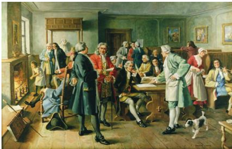
Slika 4. British shipowners

Rizik od odgovornosti za gubitak ili oštećenje tereta koji se prevozi na osiguranom brodu prvi je put dodan pokriću 1874. godine. Vrijednosti tereta porasle su pa su osiguratelji tereta postali motiviraniji u povratu gubitaka od brodovlasnika, u čemu ih je ohrabrio nešto suosjećajniји pristup sudova. Nakon 1874. mnogi klubovi dodali su klasu odštete kako bi osigurali potrebno pokriće. Nakon toga, većina tih zasebnih klasa spojena je s klasom rezerviranom za izvorne rizike zaštite, a danas je razlika između tih dviju klasa gotovo nestala u okviru P&I klubova. [5]