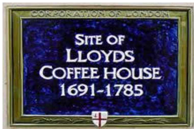
Slika 3. Lloyds Coffee House

Nadalje, tijekom 17. i 18. stoljeća engleske trgovačke brodove više su puta otele ili uništile mornarice Francuske, Španjolske ili Sjedinjenih Američkih Država. Tako je primjerice tijekom Američkog rata za neovisnost pedeset i pet teško natovarenih engleskih trgovačkih brodova oteto kod rta St. Vincent zajedno s teretom. Bio je to težak udarac britanskoj trgovačkoj floti. [5] Većinu gubitka brodovlasnika nisu pokrili privatni pomorski osiguratelji koji su poslovali na području Lloyd's Coffee Housea , koji nisu niti mogli, niti htjeli, preuzeti takve potencijalno katastrofalne rizike. [4, 5]