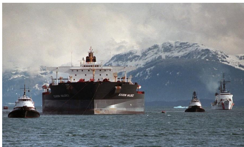
Slika 1. Exxon Valdez oil tanker

Temom pomorskog osiguranja te osiguranjem odgovornosti brodara, odnosno broda brojni domaći i inozemni autori bavili su se u okviru svog znanstvenog rada te je ta literatura izvrstan izvor za razumijevanje ove teme. U ovom radu koristit će se, stoga, dostupni izvori koji će biti polazna točka u razumijevanju ove problematike. Uz korištenje različite dostupne literature, u radu će se koristiti uobičajene znanstvene metode, posebno metode analize, sinteze i usporedbe.