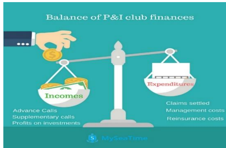
Slika 5. Balance of P&I club finances

Budući da Međunarodna grupa P&I klubova dijeli naknade putem sustava udruživanja, u zajedničkom su interesu sprječavanje i kontrola gubitaka te održavanje standarda kvalitete tijekom cijelog razdoblja trajanja članstva.