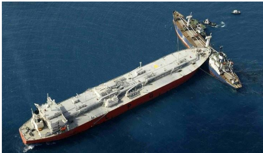
Slika 7. Sudar brodova (Ships in collision)

Nekad su osiguratelji mogli naglasiti osiguraniku da ne pokrivaju kaznenu odgovornost te se to odricanje podrazumijevalo. Bilo kojom drugačijom izjavom osiguratelj bi se izložio potencijalnoj odgovornosti za kazneno djelo. Činjenica da je osigurateljsko pokriće bilo ograničeno uvjetom slučajnosti općenito je sprječavala bilo kakva pitanja o pokrivanju kaznene odgovornosti. Podrazumijevalo se da se kaznena odgovornost nameće samo za „namjerno loše postupanje“, tj. gubitke koje je osiguranik namjerno ostvario ili na koje namjerno nije obraćao pažnju, iako je znao da će se vjerovatno dogoditi. [11]