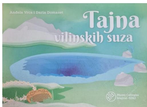
Slika 2. Slikovnica Tajna vilinskih suza

Slikovnica je na standardnom književnom jeziku, a pisana je u prozi. Tekst i slika se nadopunjuju. Ilustratorica Alira Hrabar Oremović svojim je apstraktnim stilom ilustracije kod čitatelja potaknula vizualizaciju tekstualnog dijela slikovnice. Apstraktni stil ilustriranja uključuje jednostavan i sažet pristup čija je odlika isticanje likovnih elemenata poput forme, boje i koncepta (Balić-Šimrak, 2011).