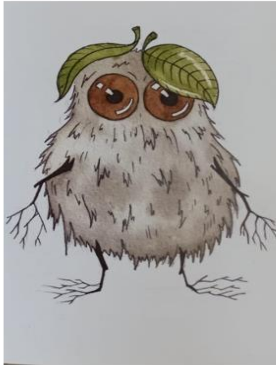
Slika 1. Ilustracija lika Liskana

i likovi precizno i uredno ilustrirani (Balić-Šimrak, 2011). Slikovnica je pisana standardnim književnim jezikom.