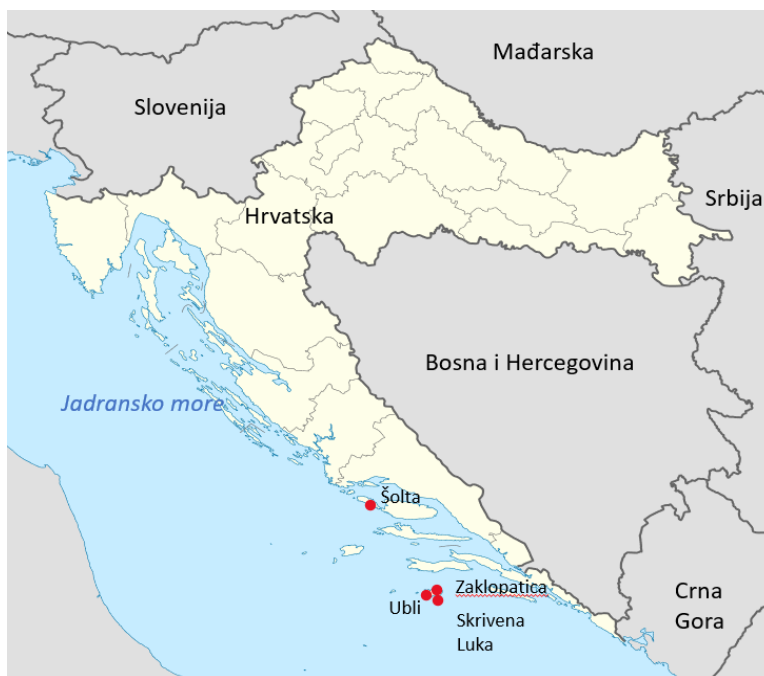
Slika 1. Geografski prikaz GSA 17 Jadranskog mora sa označenim mjestima istraživanja

U ovom istraživanju, analizirana je upotreba jednostrukih i trostrukih mreža stajaćica te su testirane mitigacijske mjere u malom priobalnom ribolovu. Istraživanje se usmjerilo na ukupan prilov ugroženih i osjetljivih morskih organizama u geografskom području istočnog Jadranskog mora. Za ovaj rad prikupljeni su podaci o prilovu ugroženih i osjetljivih morskih organizama iz Jadranskog mora iz područja GSA 17. Prikupljanje podataka o prilovu za ovu studiju provedeno je u skladu sa smjernicama dokumenta “GFCM Data Policy”. Dokument koji je objavio GFCM sadrži detaljna pravila i postupke za pohranjivanje, zaštitu, pristup i korištenje podataka, kao i njihovu distribuciju u bazi podataka usputnog ulova u ribarstvu u Sredozemnom i Crnom moru. U razdoblju od travnja 2021. do svibnja 2022. godine provedeno je ukupno 66 anketa u lukama i 21 terenskih promatranja sa plovila. Glavne iskrcajne luke bile su na području otoka Lastova (Zaklopatica, Skrivena Luka, Ubli) i otoka Šolta gdje su se provodile mitigacijske mjere (Slika 1.).