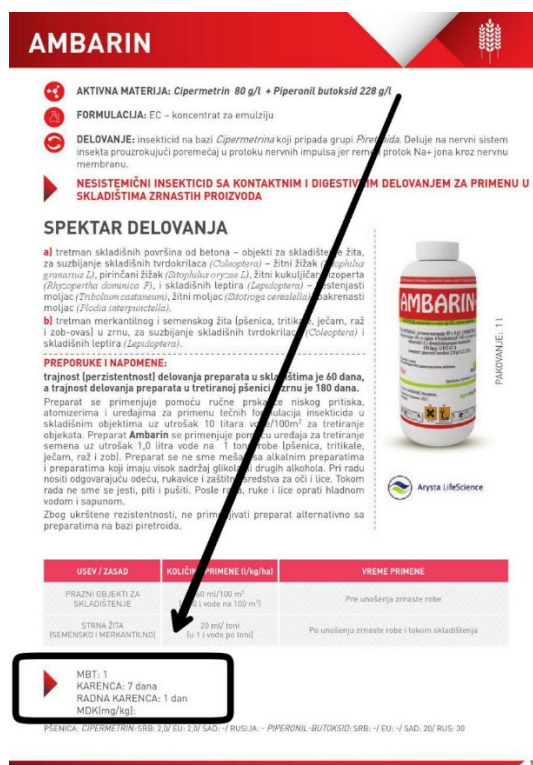
Slika 3. Primjer karence pesticida u iznosu od sedam dana.

Karenca je definirana kao vrijeme koje mora proći nakon zadnje aplikacije sredstva za protekciju bilja do žetve ili berbe, a izražava se u danima. Taj sigurnosni razmak iznimno je bitan jer omogućuje da se aplicirano sredstvo za zaštitu razgradilo do propisane vrijednosti. Propisana vrijednost za svaku biljnu kulturu određena je prema karakteristikama sredstava za zaštitu bilja, načinu korištenja, količini primijenjenog sredstva i metabolizmu aktivne tvari. Karenca istog sredstva može biti različita za različite kulture na koje se primjenjuje. Također, propisana je zabrana rada za vrijeme koje mora proći od primjene sredstva do ponovnog ulaska radnika na tretiranu površinu. Osim za radnike, radna zabrana se može odrediti i za životinje koje dolaze na ispašu. Za ljude se izražava u satima, a za životinje u danima. Ukoliko se karenca ne poštuje moguća je veća izloženost ostacima pesticida od dopuštenih što može biti štetno za zdravlje i ljudi i životinja. Osim na tretiranim područjima, ostatke pesticida možemo pronaći i na susjednim, netretiranim područjima. Do toga dolazi ukoliko se pesticidi primjenjuju kod vjetrovitog vremena kada dolazi do širenja na okolna područja (10).