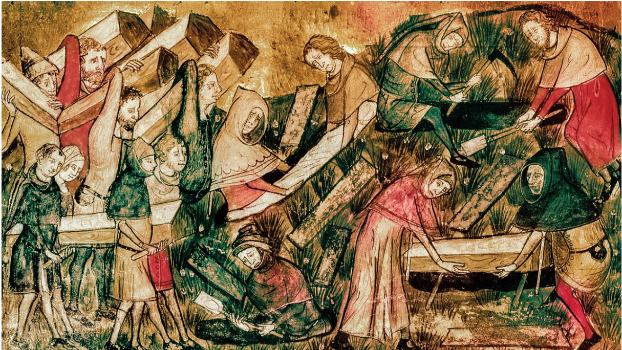
Slika 3 Najraniji prikaz utjecaja kuge -prikazuje ljude kako nose ljesove onih koji su umrli od bolesti u Tournaiju, dan. Belgija, 1349.

različitosti spolova te kako se smatra da žene ili muškarci mogu ili ne mogu konzumirati određene namirnice, s dozom banalnosti da muškarci ne mogu konzumirati hladnu salatu.