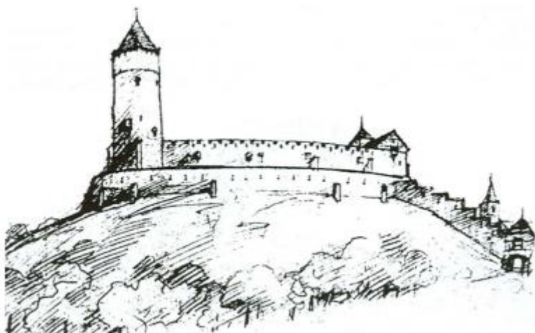
Slika 1. Rekonstrukcija nekadašnjeg izgleda tvrđave u Požegi (preuzeto iz B. Nadilo, 2005, str. 55.)