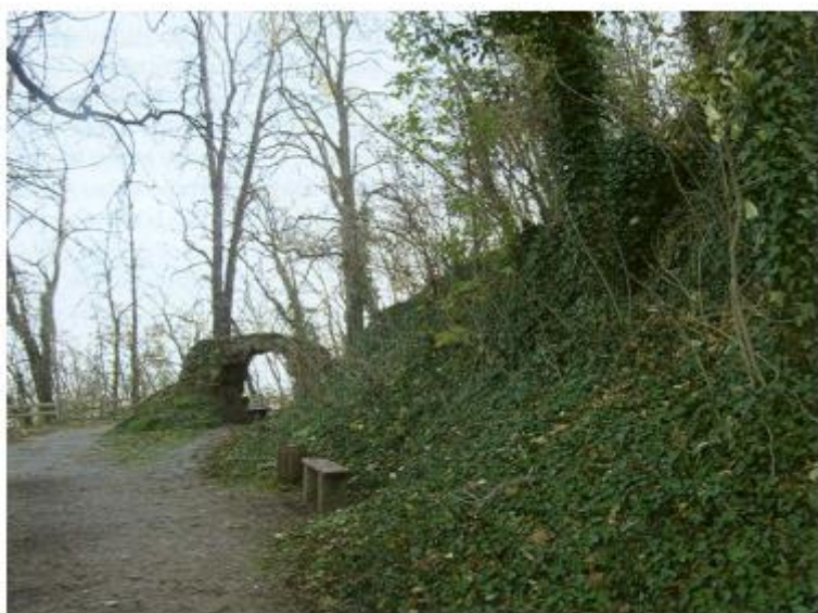
Slika 2. Sadašnje šetalište na mjestu nekadašnje utvrde (preuzeto iz B. Nadilo, 2005, str. 57. )