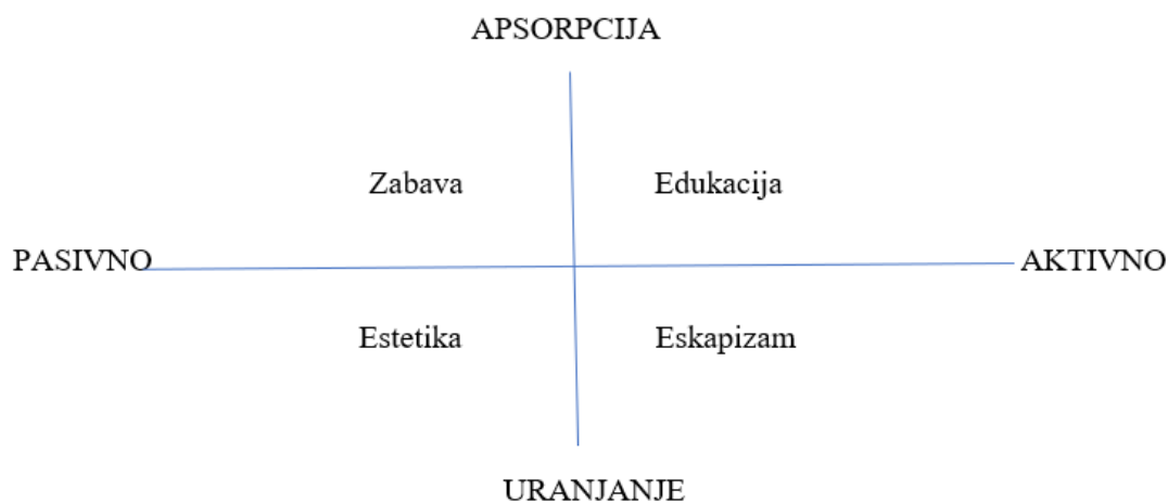
Slika 1. Dimenzije doživljaja

Dimenzije jedinstvenih i pamtljivih doživljaja razvijaju se duž dvije osi, a to su razina angažmana (uključenosti) korisnika i razina povezanosti korisnika s okruženjem (Slika 1.).