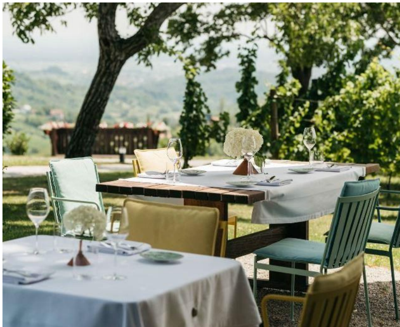
Slika 7. Restoran Korak

predstavljene na jedinstven način. Značajna pažnja se posvećuje i estetici te se nastoji isporučiti vizualni užitak gostima restorana. Svako je jelo pomno i vješto dekorirano te prikazuje jedinstvenu međuigru tekstura i inovativnih elemenata u gastronomiji. Posvećenost chefa Bernarda korištenju lokalnih sezonskih namirnica i njegov pedantan pristup kulinarskim tehnikama čine ovaj objekt ključnim odredištem za pojedince koji cijene iznimnu kuhinju i izvorne okuse (Slika 7.). ( https://croatia.hr/hr-hr/hrana-i-pice/jre-hrvatska/restaurant-korak )