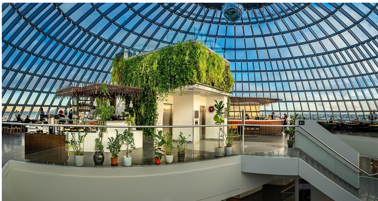
Slika 5. Restoran Perlan

koje se pruža panoramski pogled na Reykjavik, obližnje planine, more i nebo. Restoran je smješten unutar velike okretne staklene kupole, koja pruža zadivljujući arhitektonski element koji posjetiteljima omogućuje da uživaju u okruženju koje se neprestano mijenja dok se prepuštaju svojim obrocima, stvarajući na taj način živopisno i interaktivno iskustvo objedovanja. Jedna od primarnih privlačnosti restorana je njegov izvanredan i prostran vidik, koji posjetiteljima pruža priliku da promatraju planinski lanac Reykjavika, svjedoče prostranstvu Atlantskog oceana i uživaju u prostranstvu neba na horizontu. Osim što je poznat po svojim slikovitim vidicima, restoran je poznat i po izuzetnoj kulinarskoj ponudi. Gosti imaju priliku uživati u iskustvu objedovanja dok se dive slikovitom okruženju. Nadalje, Perlan ne obuhvaća samo restoran, već organizira niz događaja, uključujući koncerte i izložbe. (Stewart, 2017) Gosti restorana Perlan uživaju u kombinaciji izvanrednog arhitektonskog dizajna, izvrsnih kulinarskih mogućnosti i prekrasnih pogleda na islandske prirodne krajolike koji oduzimaju dah. Ovaj objekt pruža jedinstveni spoj koji obuhvaća niz atrakcija, od vizualne privlačnosti do gastronomske izvrsnosti (Slika 5.).