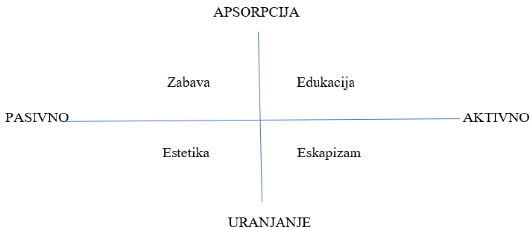
Slika 1. Dimenzije doživljaja

Dimenzije jedinstvenih i pamtljivih doživljaja razvijaju se duž dvije osi, a to su razina angažmana (uključenosti) korisnika i razina povezanosti korisnika s okruženjem (Slika 1.).