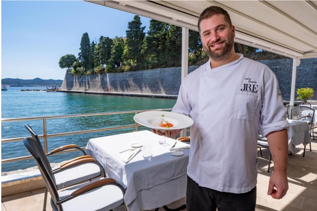
Slika 9. Jedinstveni ambijent restorana Foša

Restoran Foša nastoji ugoditi raznolikoj lepezi gostiju predstavljajući spoj tradicionalne dalmatinske gastronomije i modernih kulinarskih tendencija, u zadivljujućem povijesnom ambijentu luke Foša (Slika 9.).