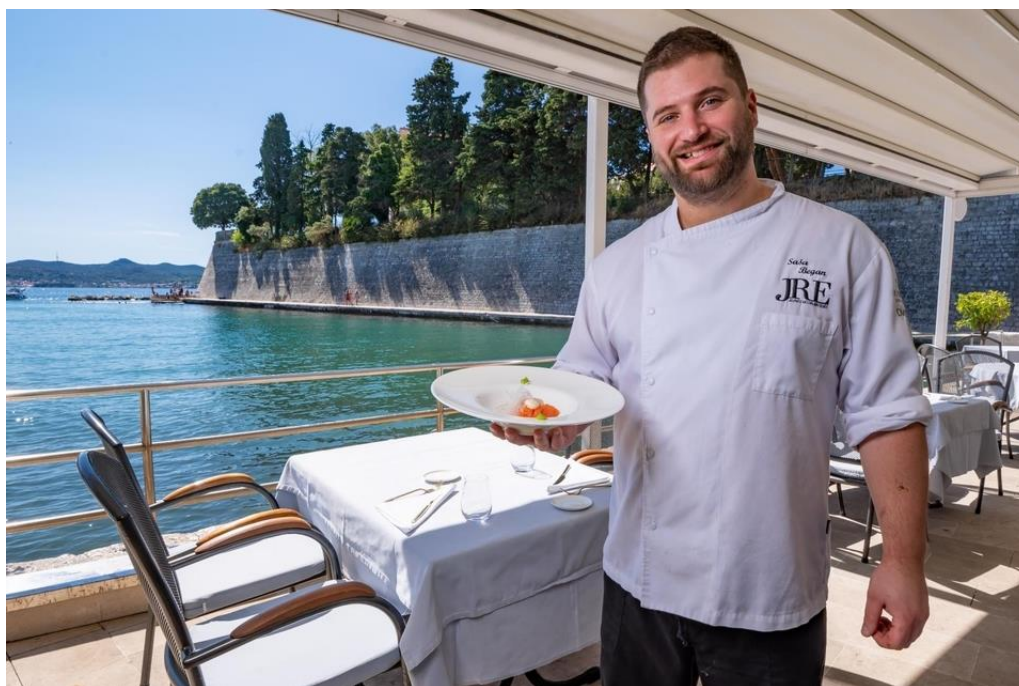
Slika 9. Jedinstveni ambijent restorana Foša

Restoran Foša nastoji ugoditi raznolikoj lepezi gostiju predstavljajući spoj tradicionalne dalmatinske gastronomije i modernih kulinarskih tendencija, u zadivljujućem povijesnom ambijentu luke Foša (Slika 9.).