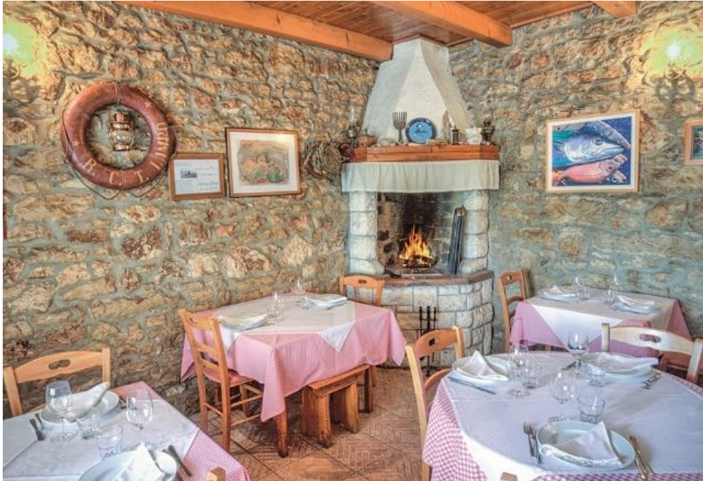
Slika 8. Konoba Batelina

Konoba Batelina ne daje prioritet luksuznom uređenju i prezentaciji hrane. Umjesto toga, naglašava jednostavnost i izvorne okuse, s ciljem pružanja autentičnog i tradicionalnog iskustva objedovanja (Slika 8.). ( https://hr.gaultmillau.com/restaurants/konoba-batelina?lang=en )