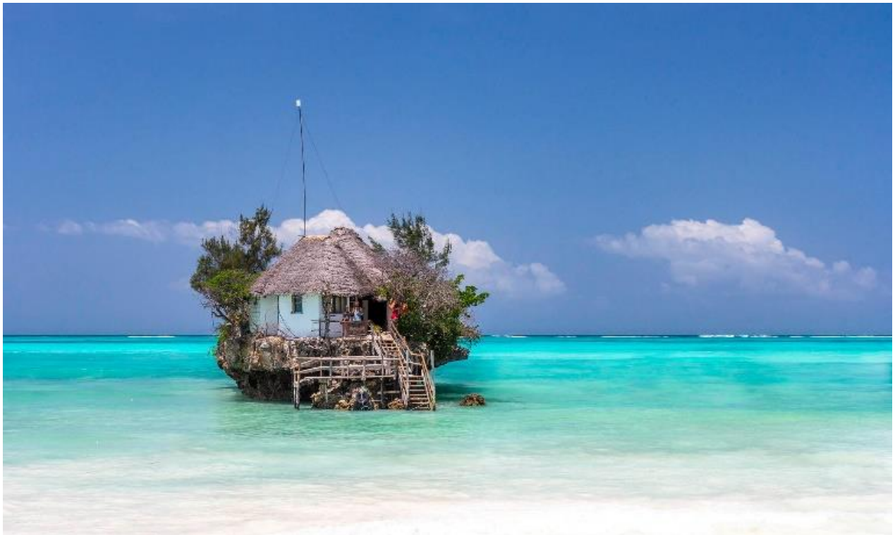
Slika 4. Restoran The Rock u Zanzibaru

Restoran poznat kao The Rock nalazi se na slikovitoj obali Zanzibara, idiličnog tropskog otoka u Tanzaniji. Njegova prepoznatljiva karakteristika je smještaj na vrhu prirodne stijene koja strši iz okolnog oceana. Ova posebna geološka značajka čini restoran naizgled izoliranim za vrijeme plime, a opet pristupačnim pješice za vrijeme oseke. Posljedično, posjetiteljima je omogućeno iznimno iskustvo putovanja morem kako bi pristupili ovom ugostiteljskom objektu. Nadalje, osim svog povoljnog geografskog položaja, restoran posjetiteljima pruža zadivljujuće poglede na široke oceanske horizonte. Gosti imaju priliku uživati u sveobuhvatnom pogledu koji se pruža prema golemom moru, stvarajući tako idealan ambijent za intimne večeri ili mirne večere s voljenima. Restoran besprijekorno spaja nevjerovatno prirodno okruženje s gastronomskim užicima, pružajući posjetiteljima neusporediv susret praćen umirujućim melodijama oceana i prekrasnim prizorima zalaska sunca. (Otengej i sur., 2017) Restoran je nadišao puku gastronomsku uslugu i postao simbol estetske privlačnosti i ekskluzivnosti Zanzibara (Slika 4.).