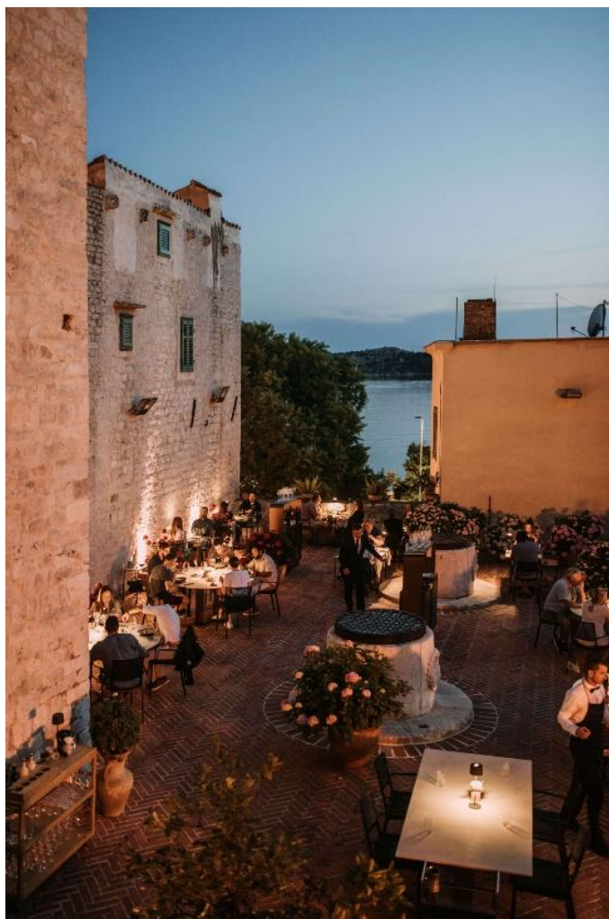
Slika 6. Restoran Pelegrini