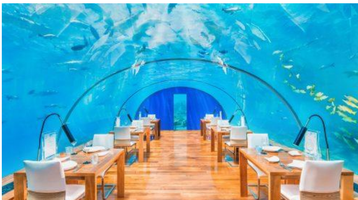
Slika 3. Restoran Ithaa

Zasigurno nezaboravno i pamtljivo gastronomsko iskustvo nudi prvi podvodni restoran na Maldivima, pod nazivom Ithaa . Restoran na Maldivima donosi jedinstveno i luksuzno gastronomsko iskustvo, smješteno u podvodnom okruženju koje oduzima dah. Gosti su okruženi fascinantnim prirodnim ljepotama Indijskog oceana, uključujući šarene koraljne vrtove i raznolike morske životinje. Radi se o ekskluzivnom iskustvu koje se nudi uz premijske cijene zbog jedinstvenog, luksuznog i egzotičnog ambijenta. (Bideki i Cater, 2019) Takvo iskustvo nije samo obrok, već i prilika za goste da urone u podvodni svijet i dožive nešto izvanredno i stvore pamtljive, nezaboravne doživljaje (Slika 3.).