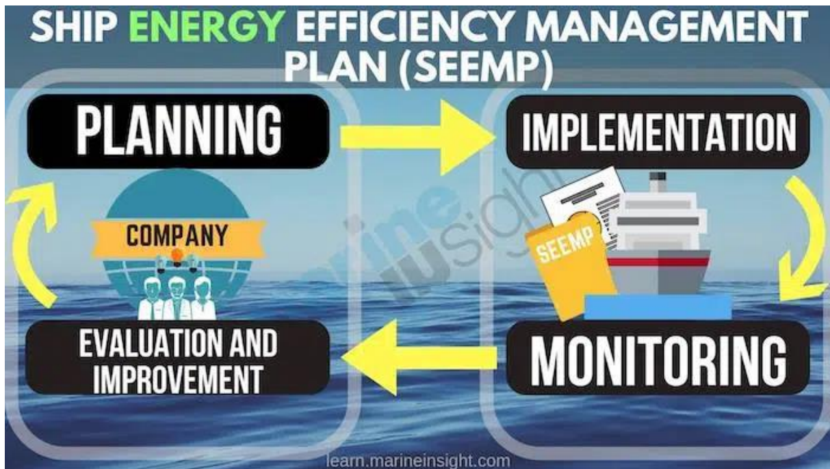
Slika 4. Faze SEEMP-a. [16]