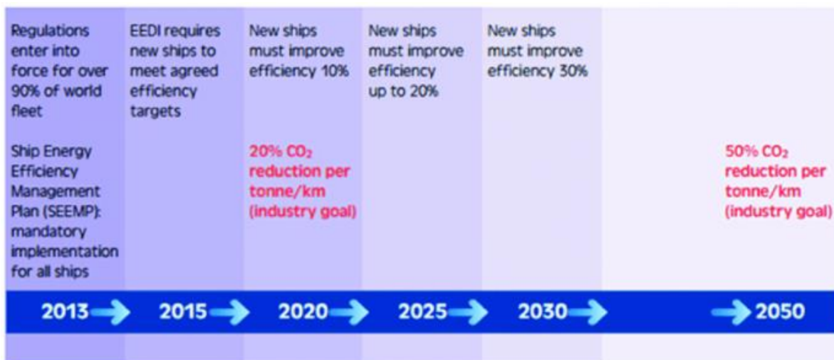
Slika 1. Plan za poboljšanje učinkovitosti brodova od 2013. godine do 2050. godine. [4]

Usvajanje novih mjera temelji se na prethodno usvojenim obaveznim mjerama energetske učinkovitosti IMO-a. [4]