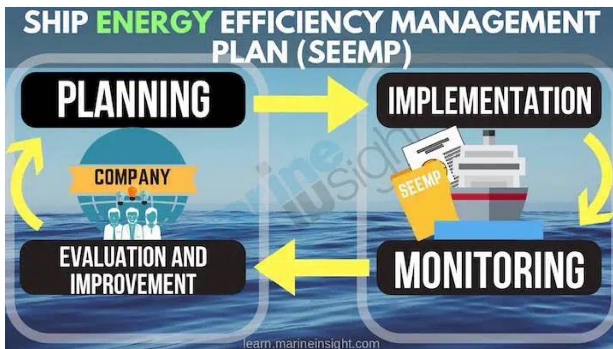
Slika 4. Faze SEEMP-a. [16]